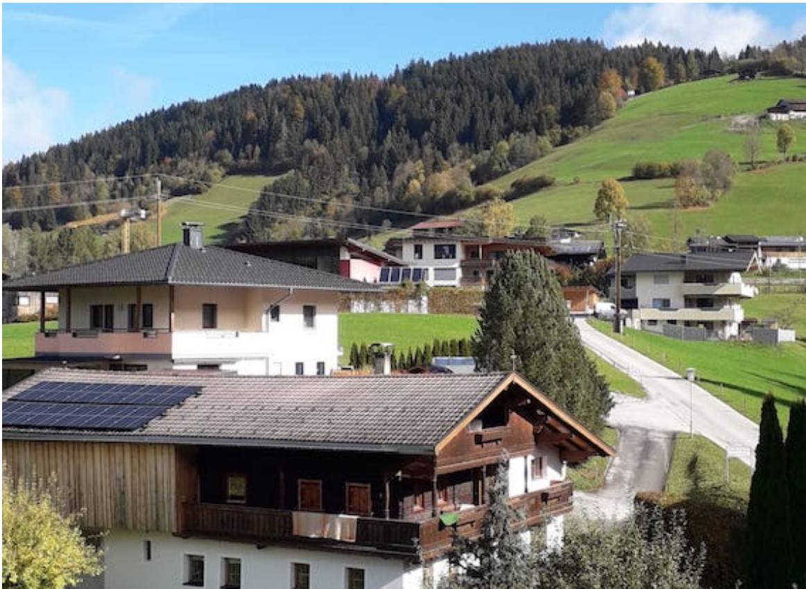
Balkon mit Blick ins Grüne.