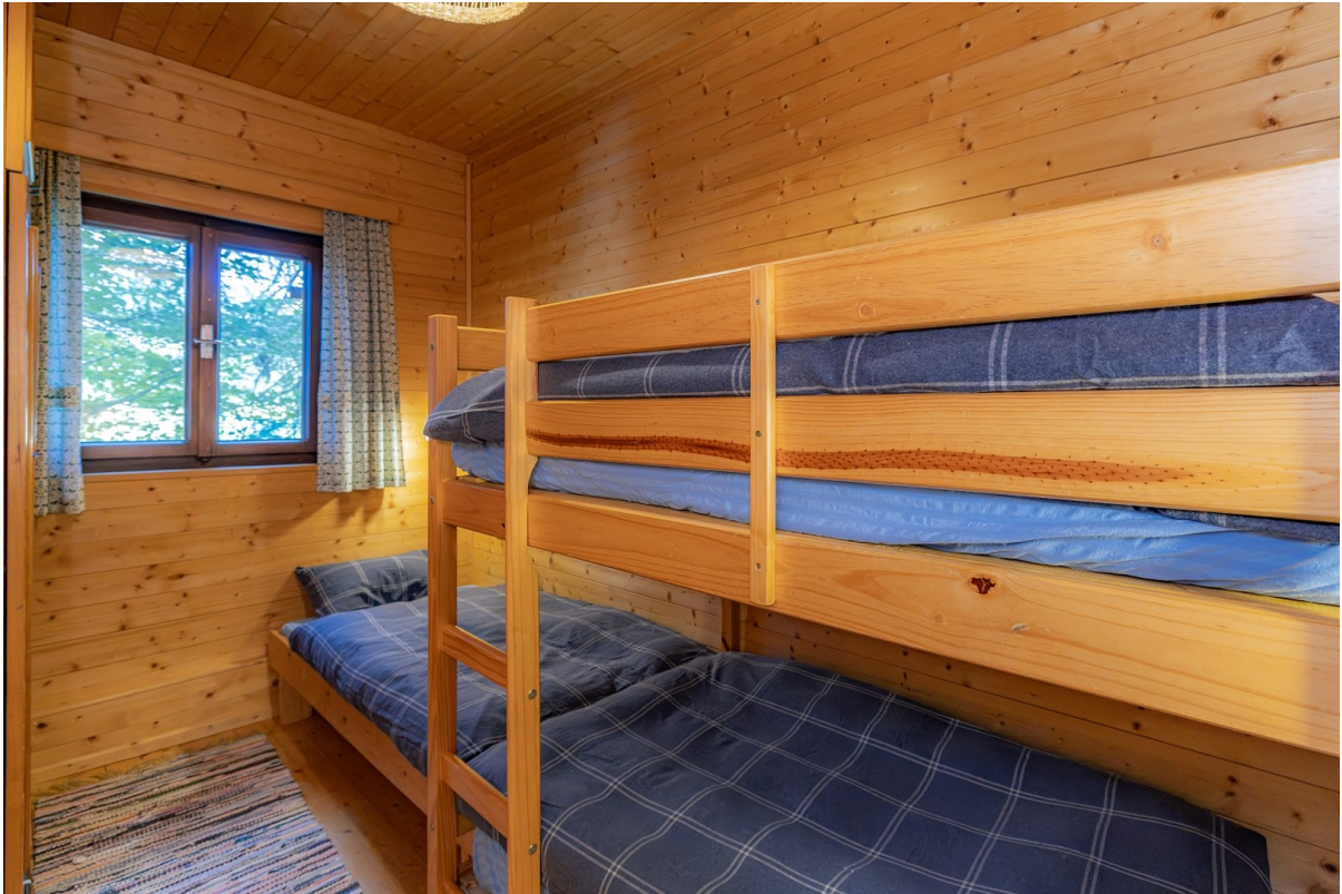
Zimmer für Alle