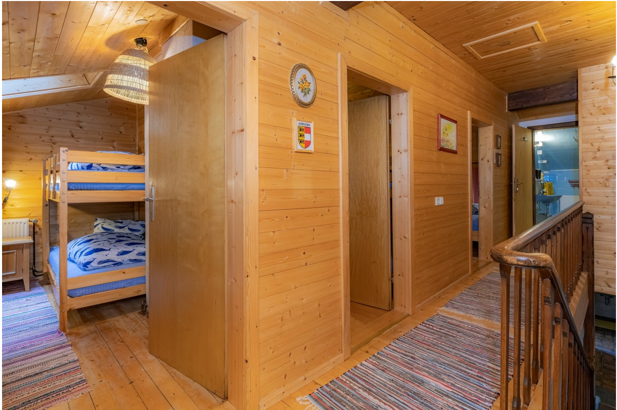
Gang im ersten Stock