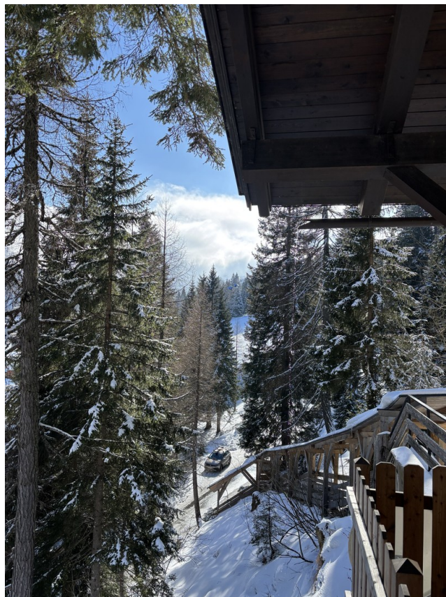
Blick zur Piste