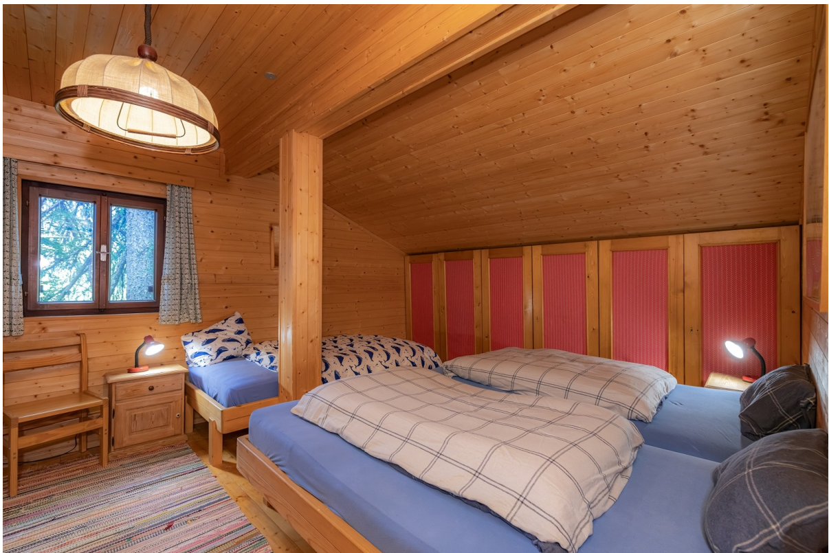
Schlafzimmer im Obergeschoss