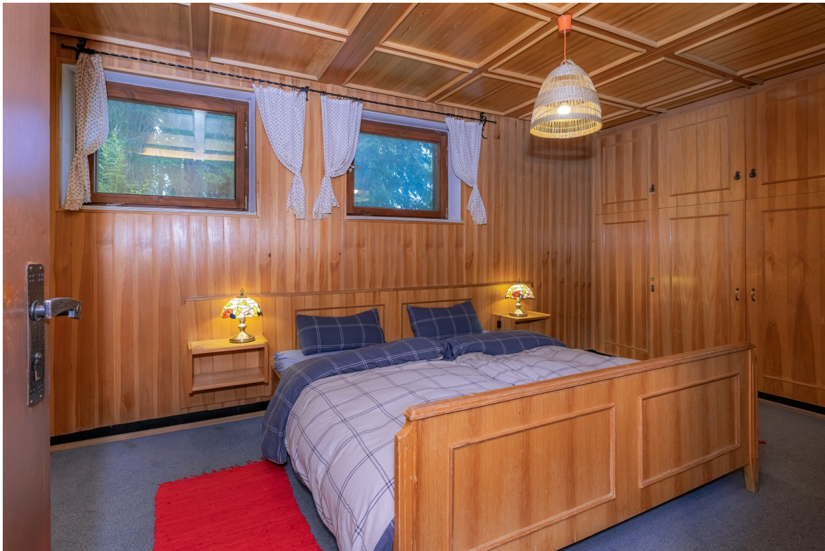
Schlafzimmer im Paterre