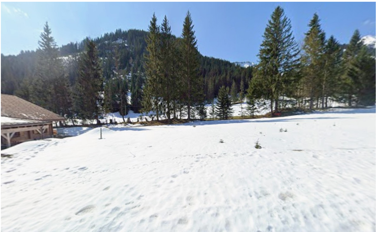
Ausblick vom Bauplatz aus