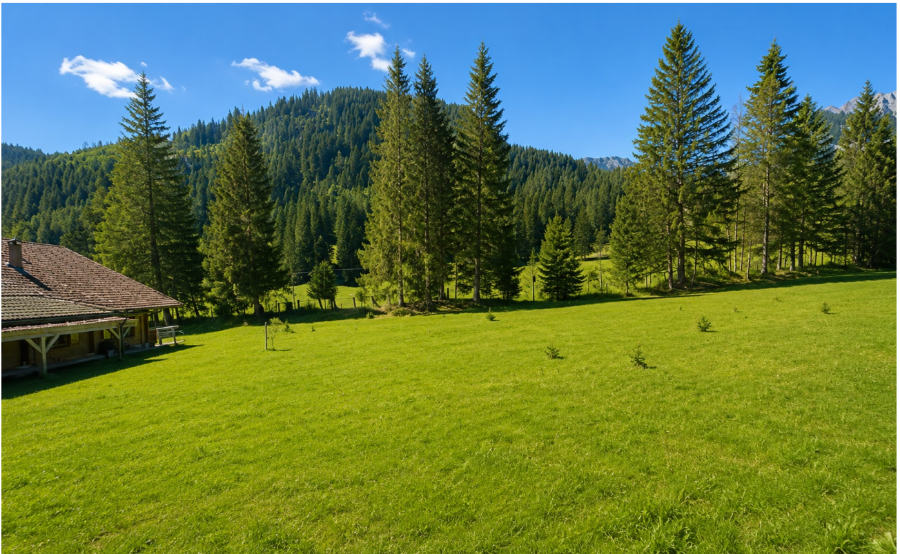
Ausblick auf Wiesen und Berge