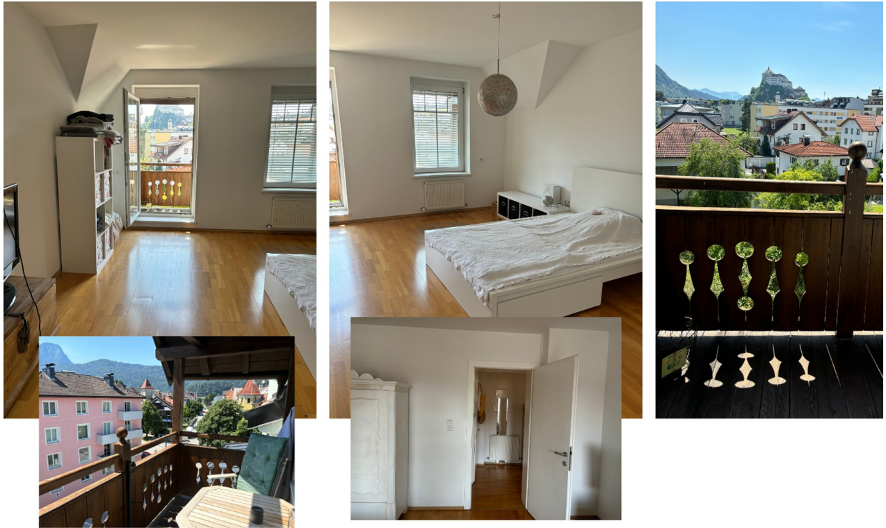
Zimmer 1 mit Balkon