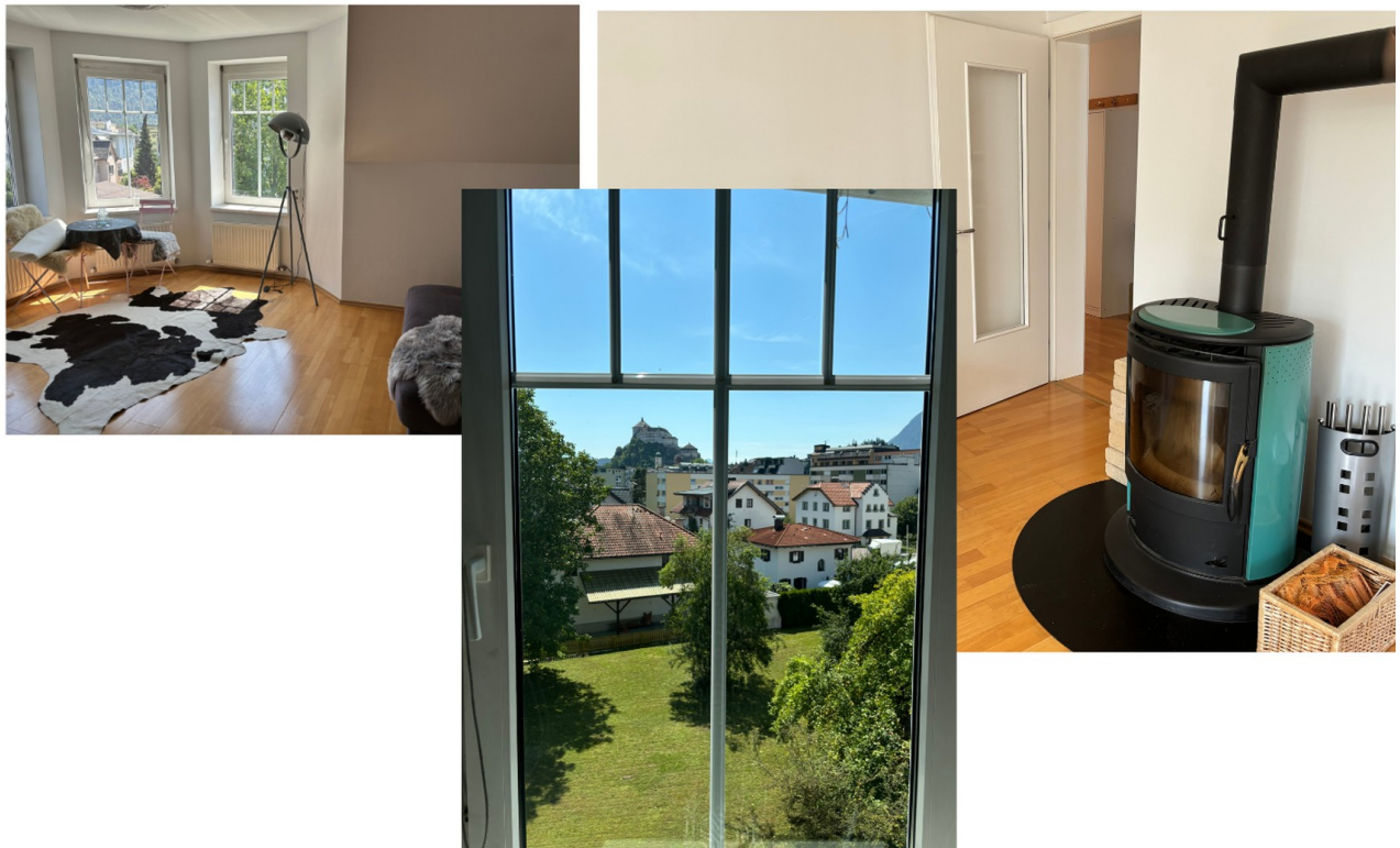
Zimmer 3 mit Holzofen