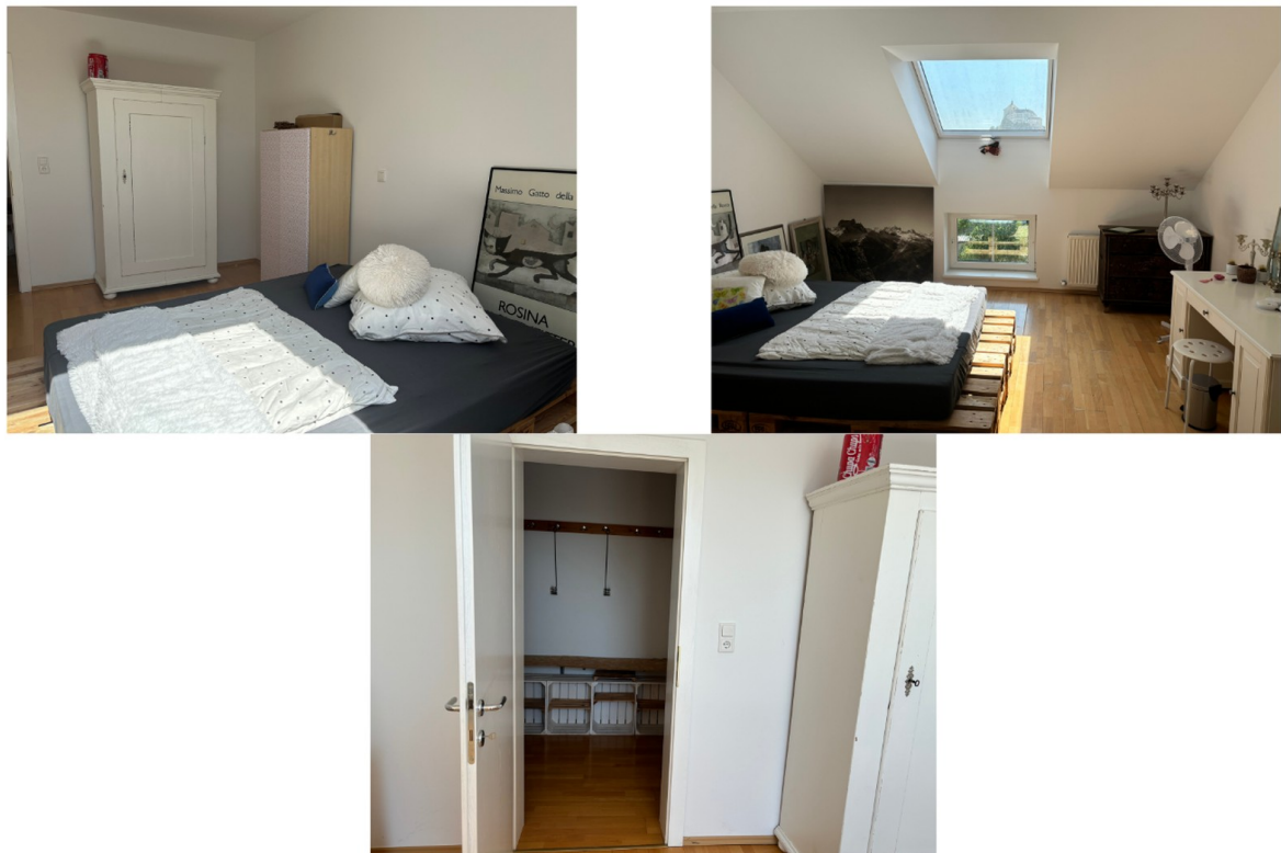
Zimmer 2 / Mansardencharakter