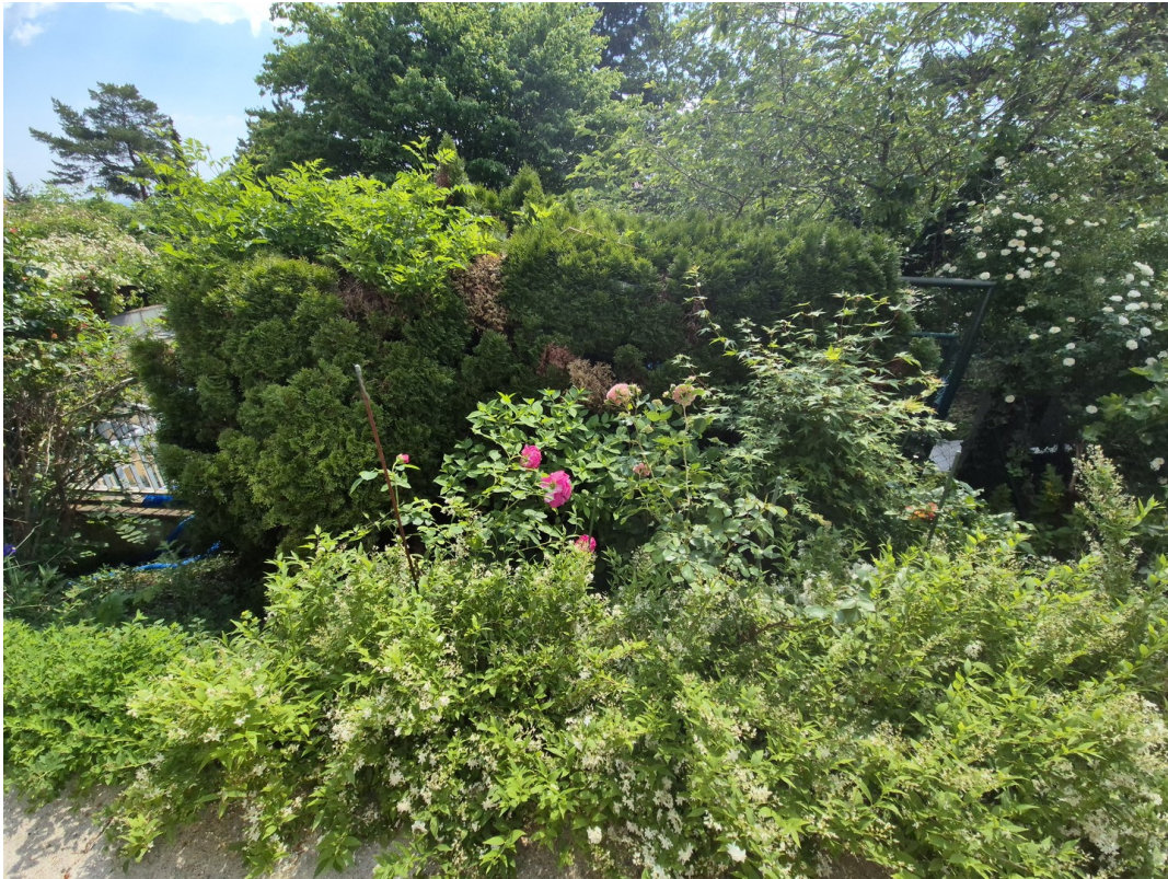
Paradies für Hobbygärtner