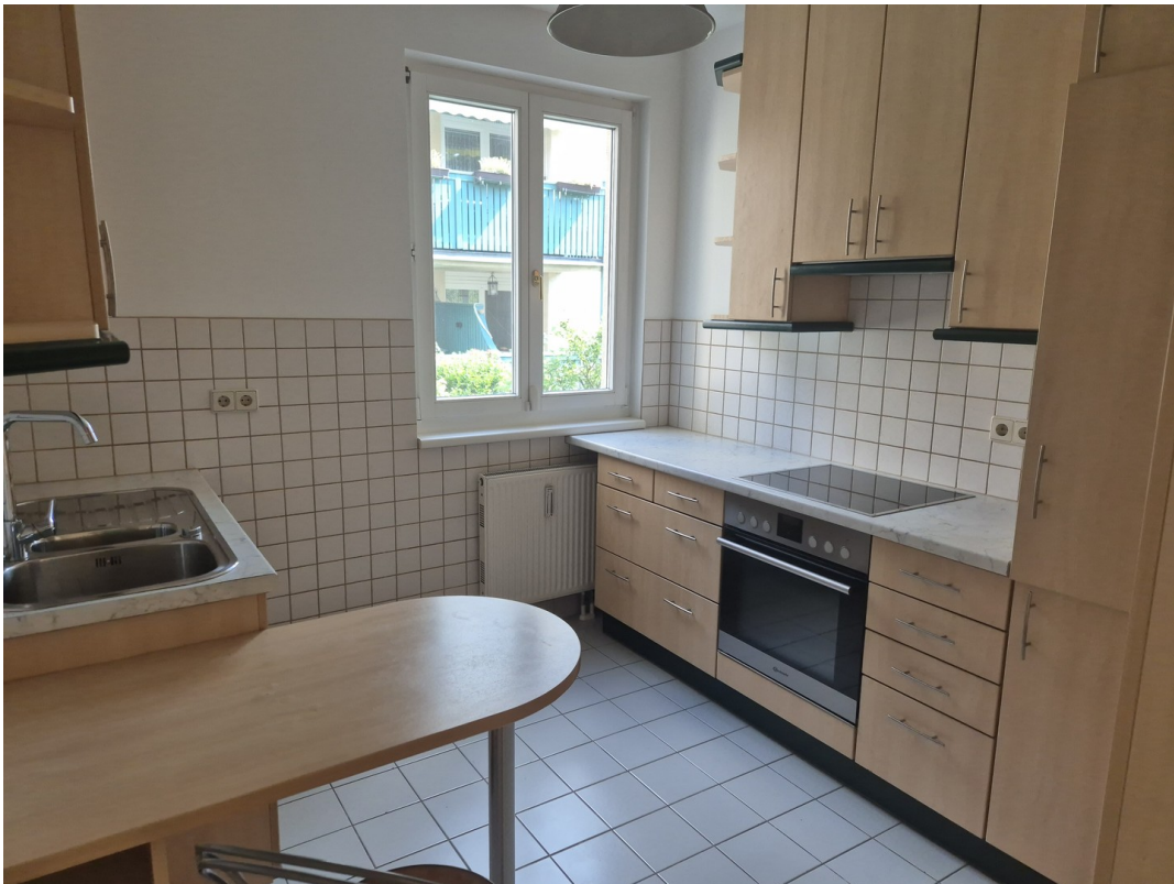
Küche mit Geräten