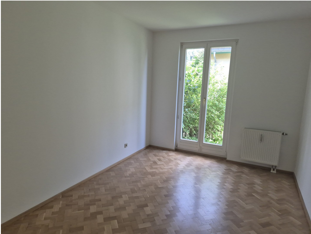
Kinder- oder Arbeitszimmer