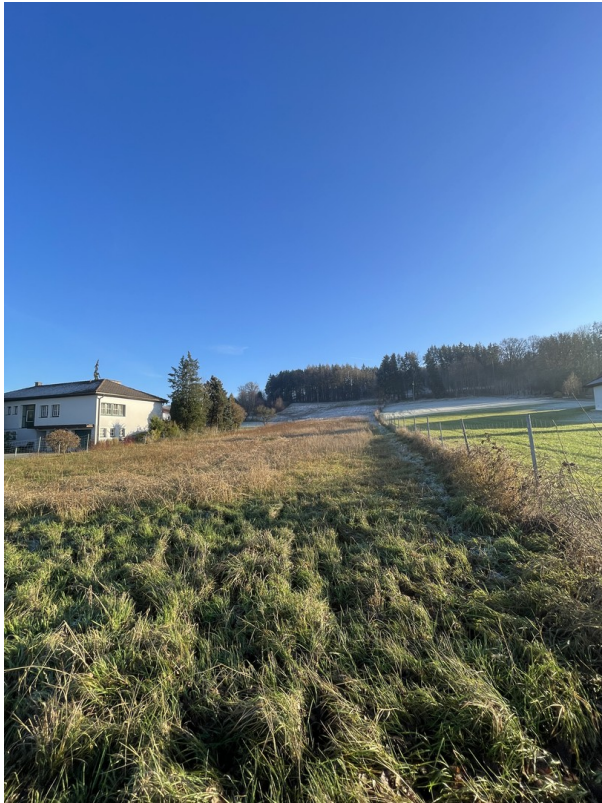
eingezäunter Bereich bis Wald