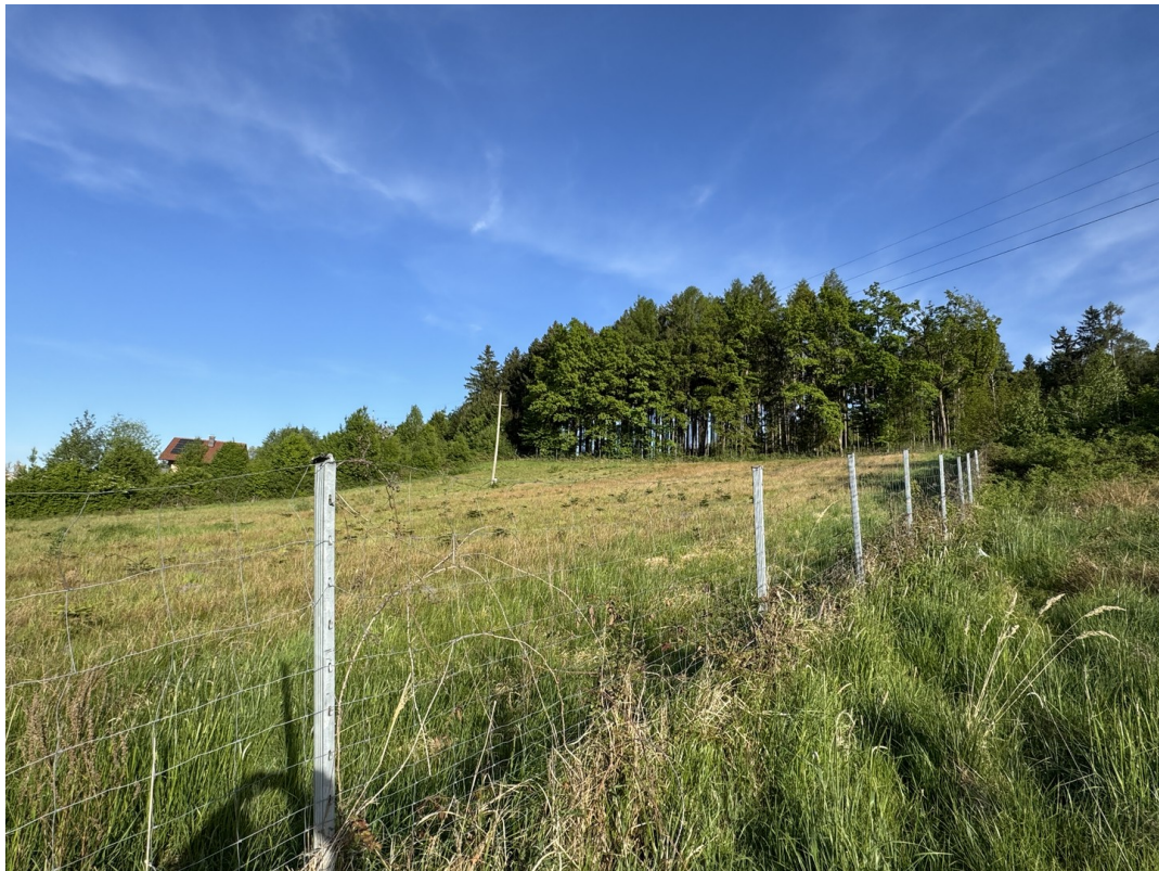
Blick zur Waldgrenze