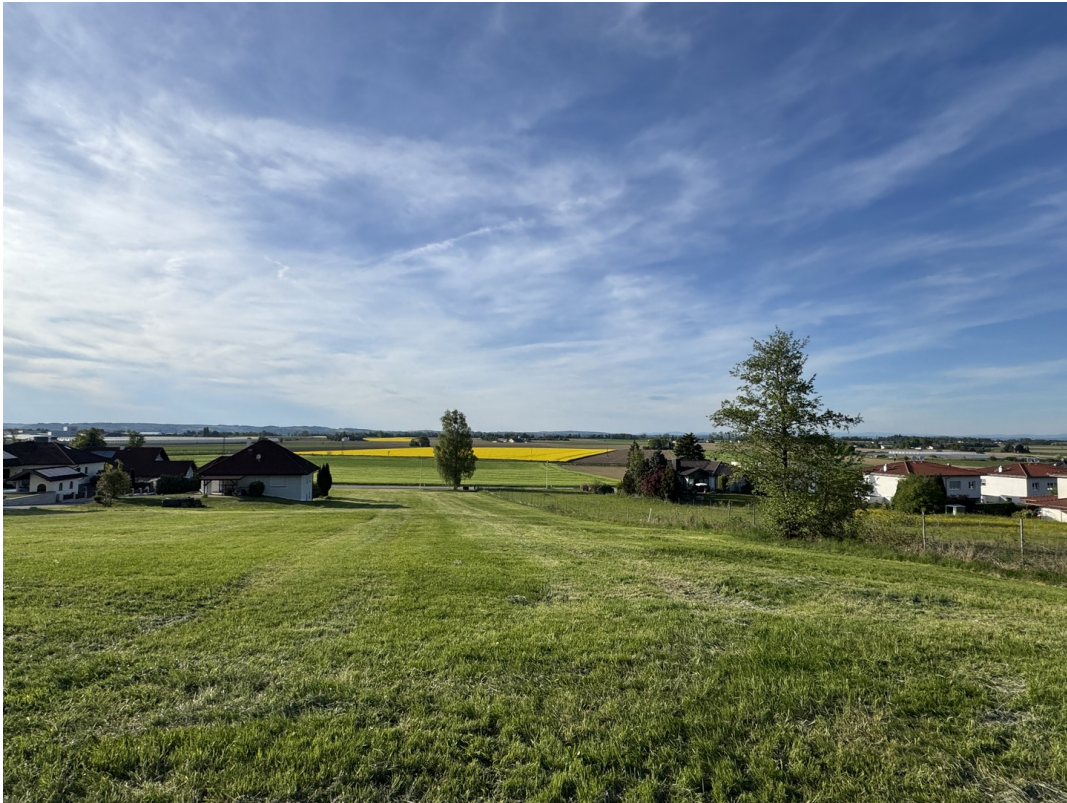
Blick über die Landschaft