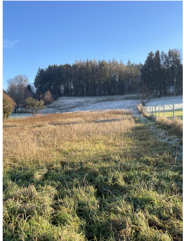
leichte Hanglage, unverbaubar