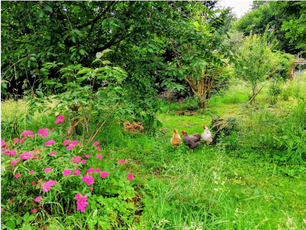
Naschgarten mit Hühnern