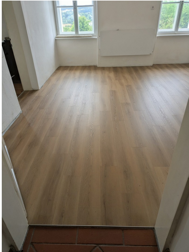
Wohnküche mit neuem Boden