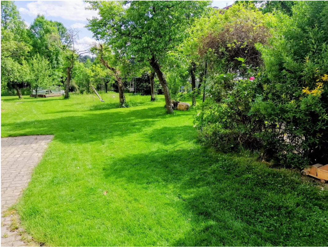
Rasenfläche mit Obstbäumen