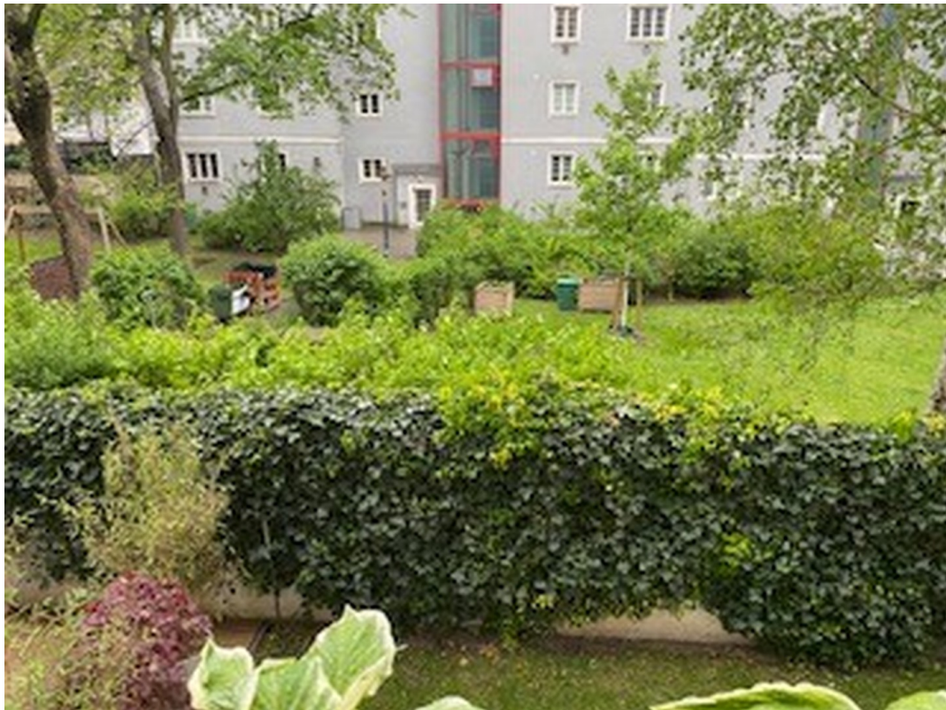
Aussicht in dennInnehof