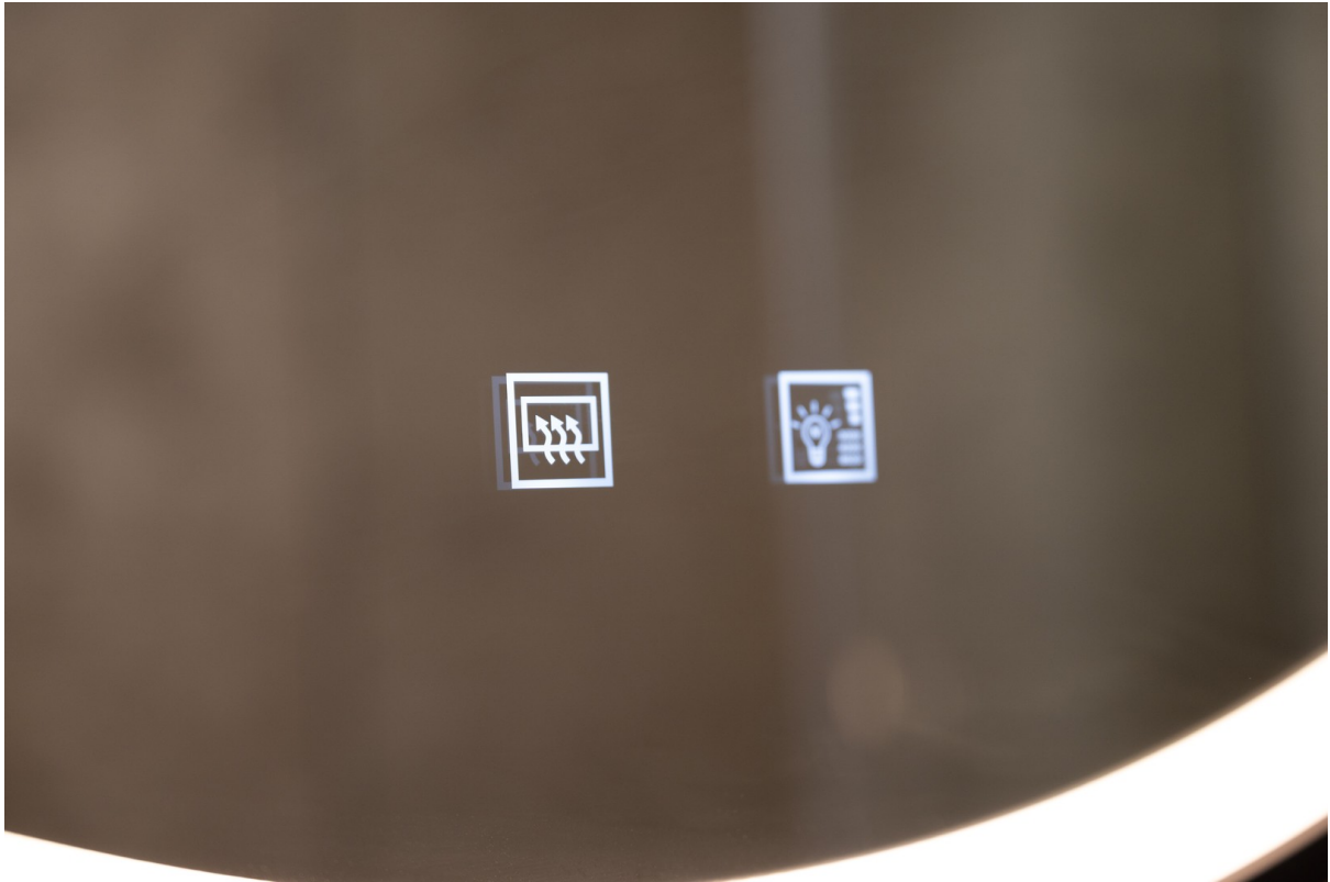
Spiegel inkl. Infrarotheizung