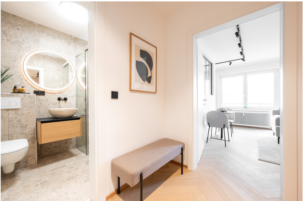
Eingangsbereich & Eingang Bad