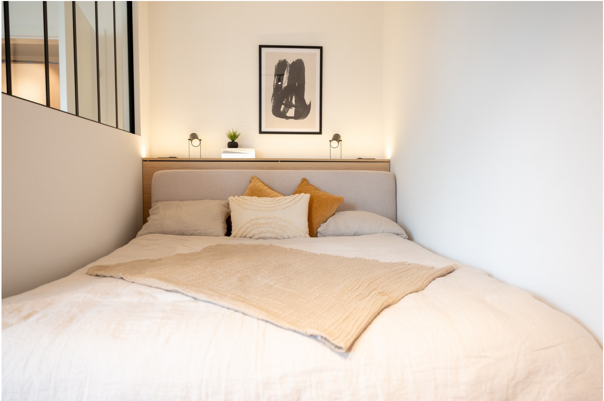
Bett mit ind. Beleuchtung