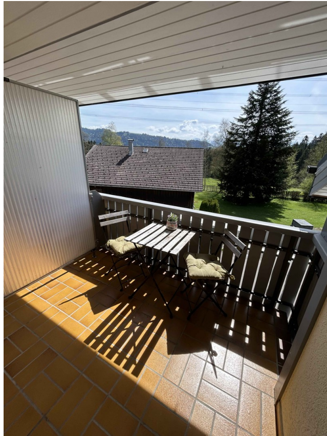
Balkon mit Aussicht