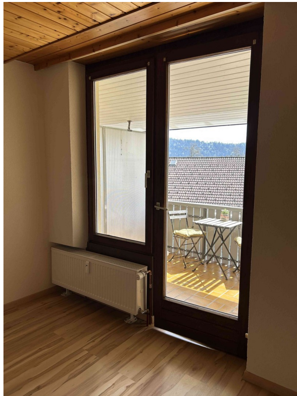
Blick auf den Balkon