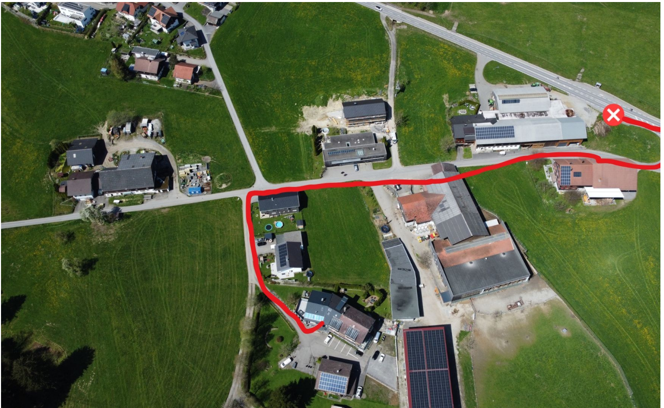
Wohnung - Bushaltestelle