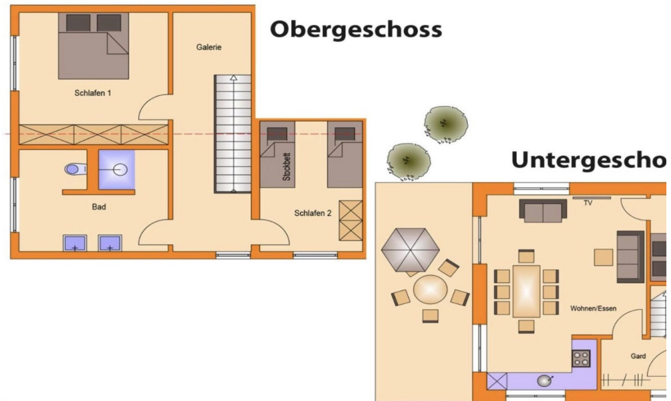
Grundriss grosse Wohnung