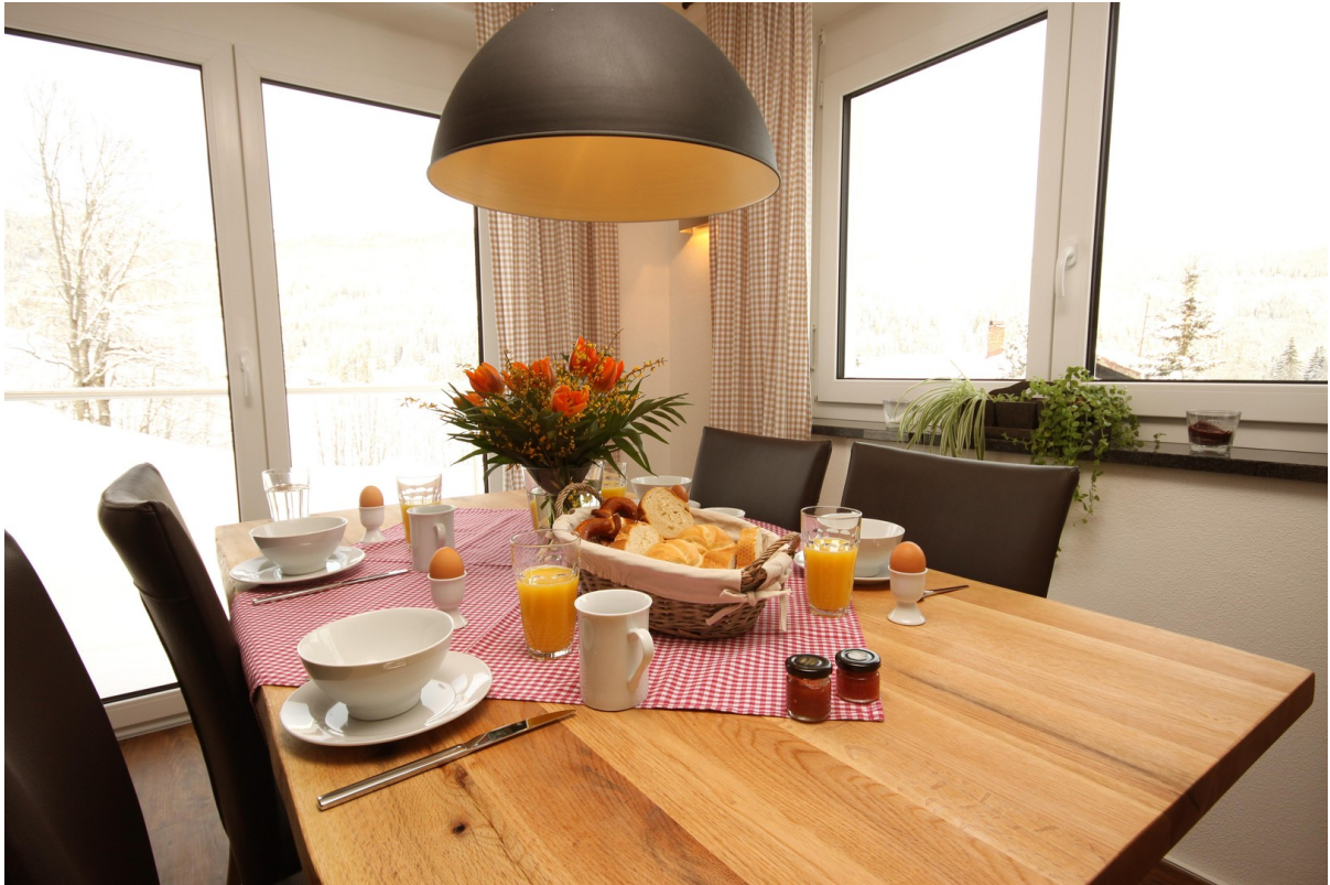
Esszimmer mittlere Whg.