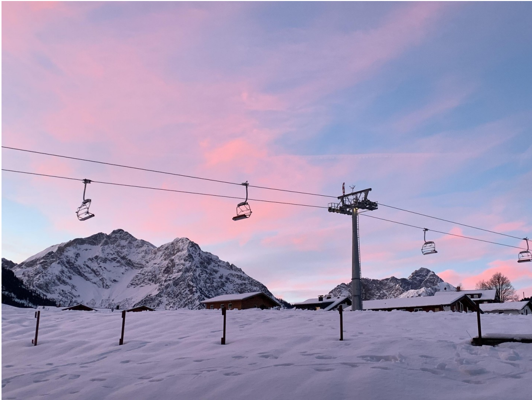
Blick vom Haus auf Skipiste