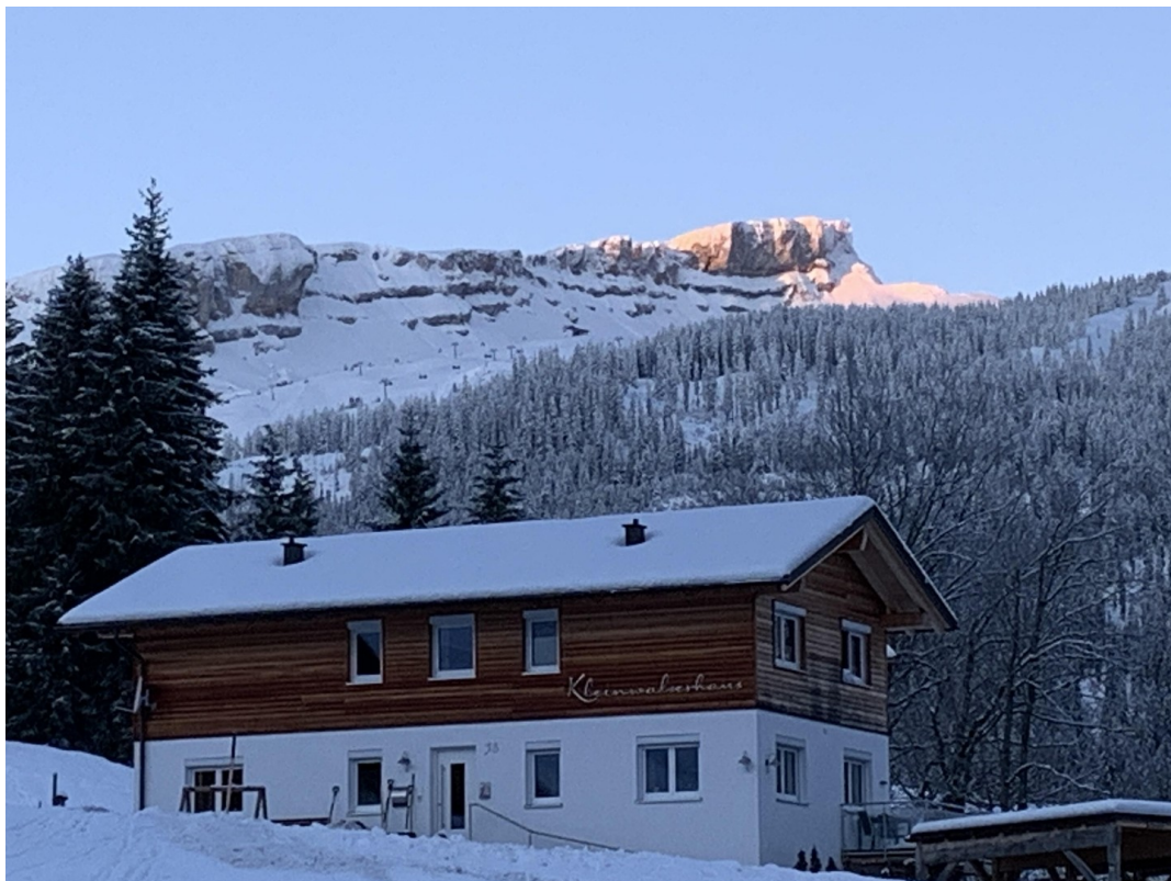
Haus mit Ifen