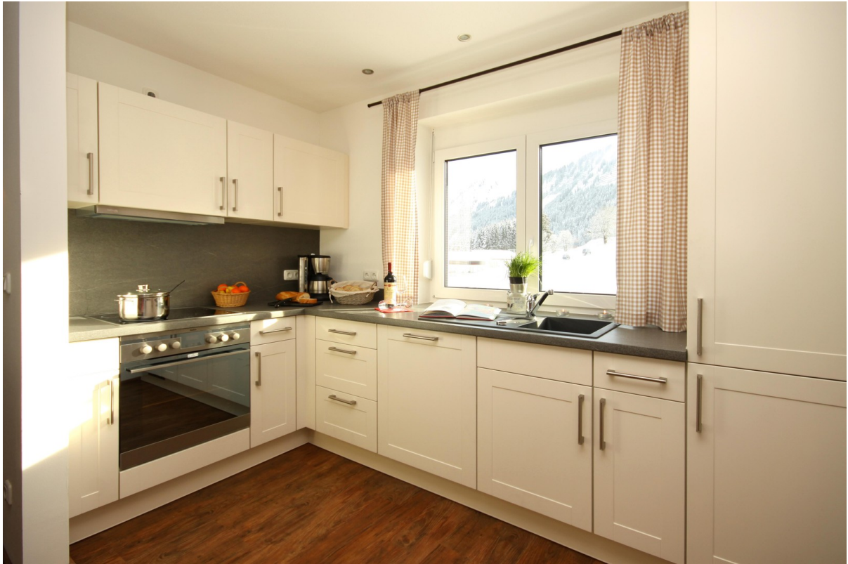
Küche große Whg.