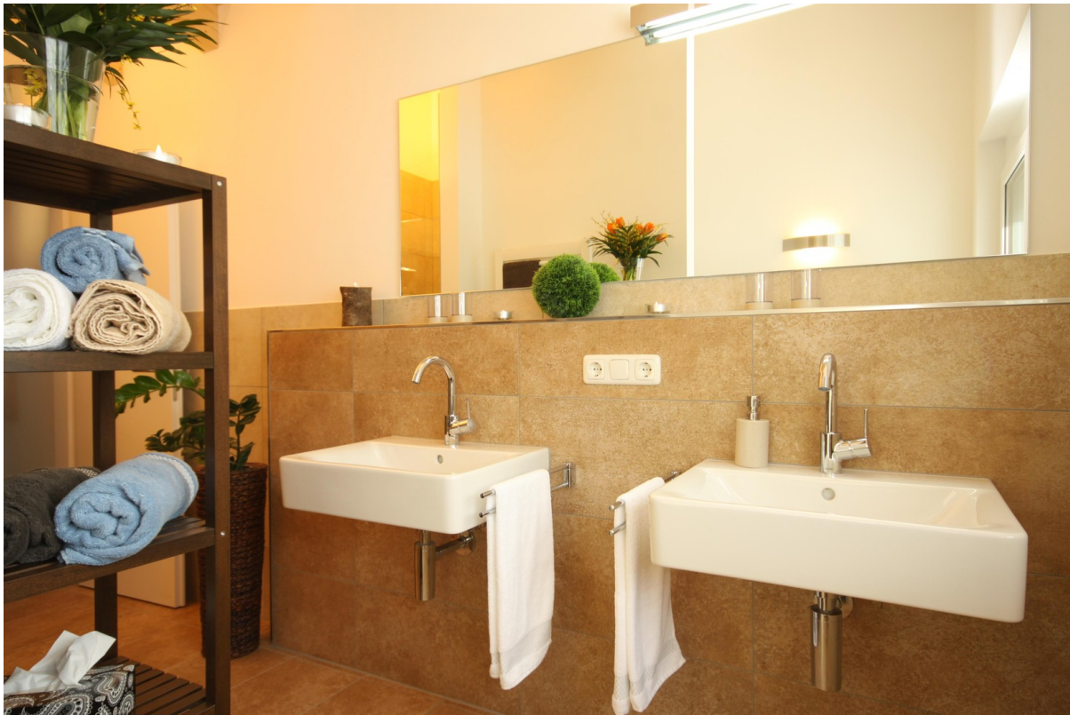
Bad große Whg.