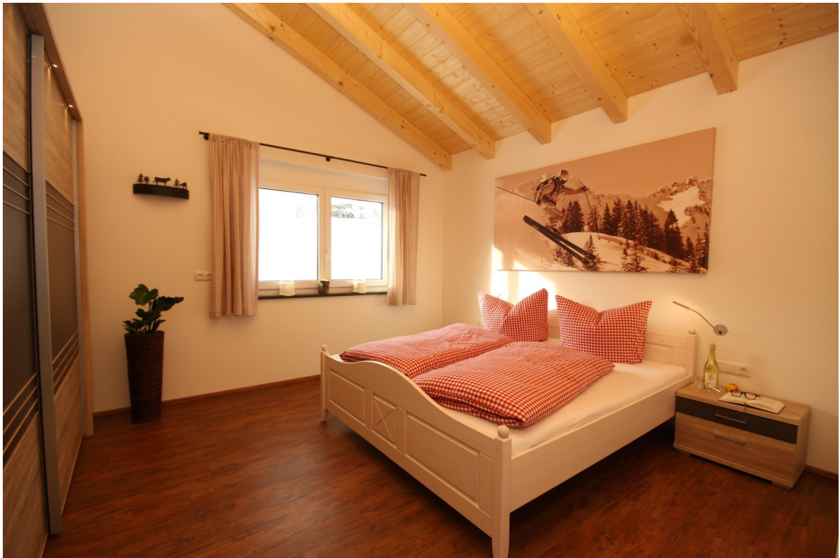
Schlafzimmer 1 große Whg.