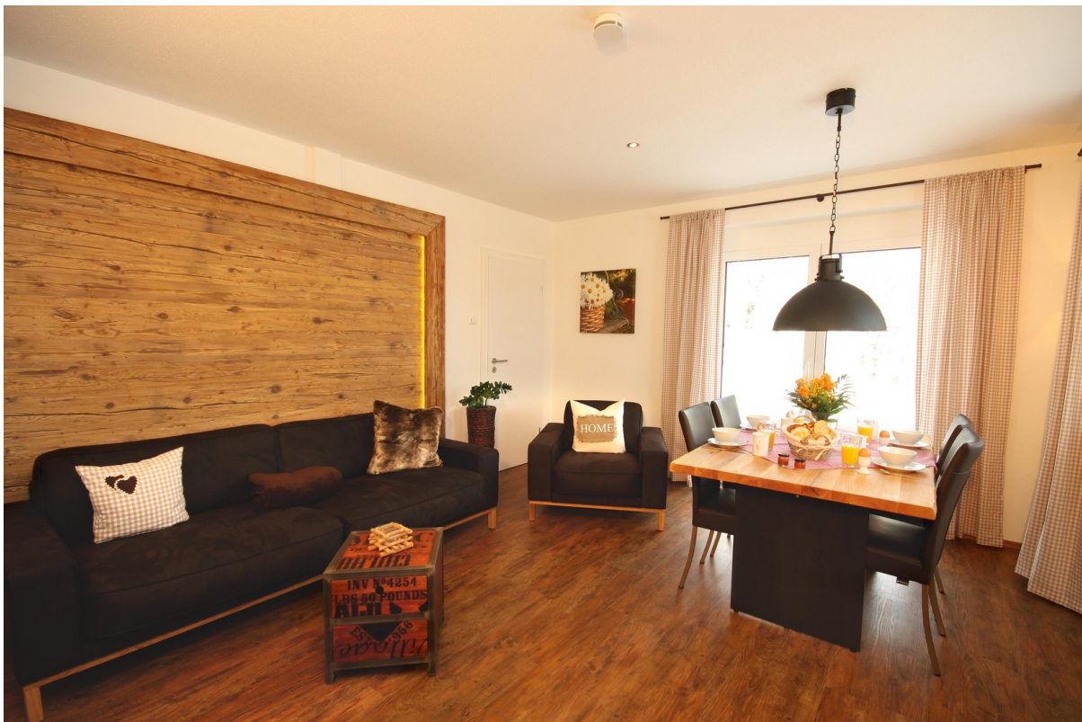
Wohnzimmer mittlere Whg.