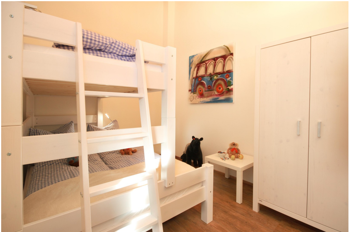
Schlafzimmer 2 mittlere Whg.