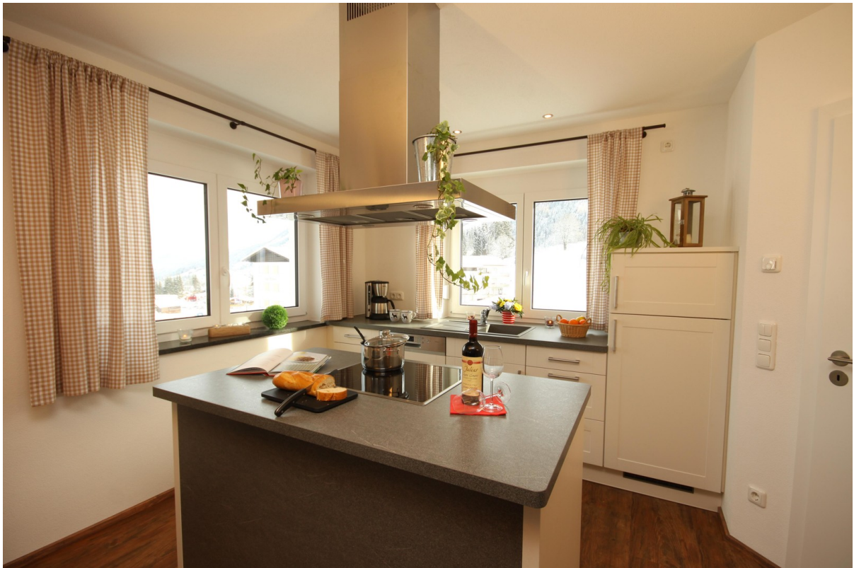
Küche mittlere Whg.