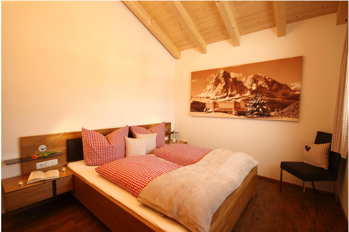
Schlafzimmer 1 mittlere Whg.