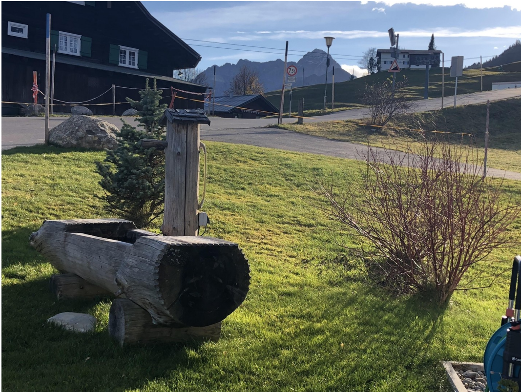
Blick von der Haustüre aus