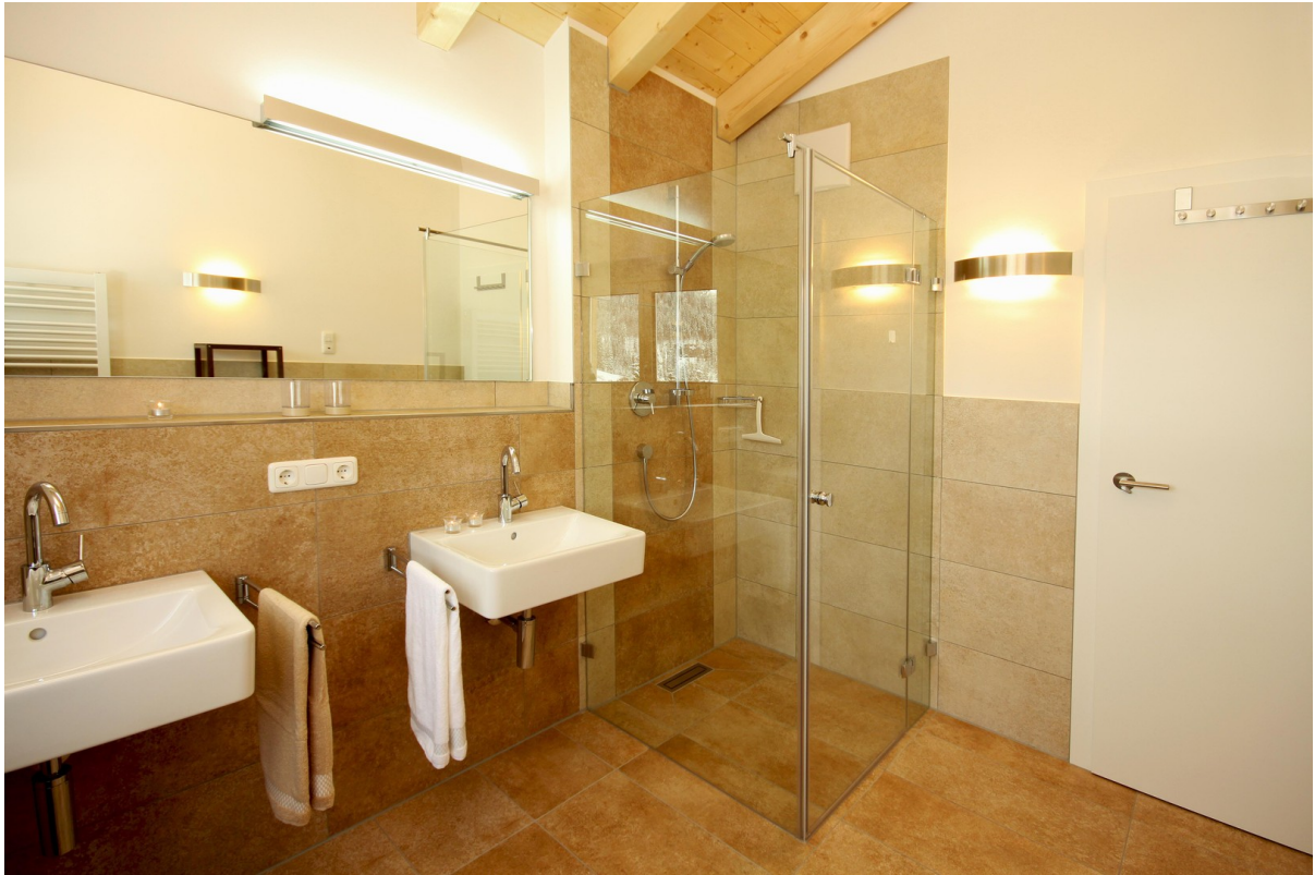
Badezimmer mittlere Whg.