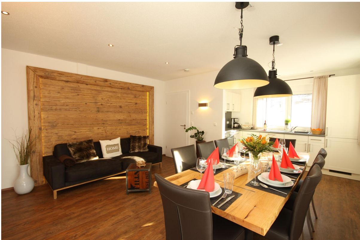
Kü, Wo, Ess-Zimmer große Whg.