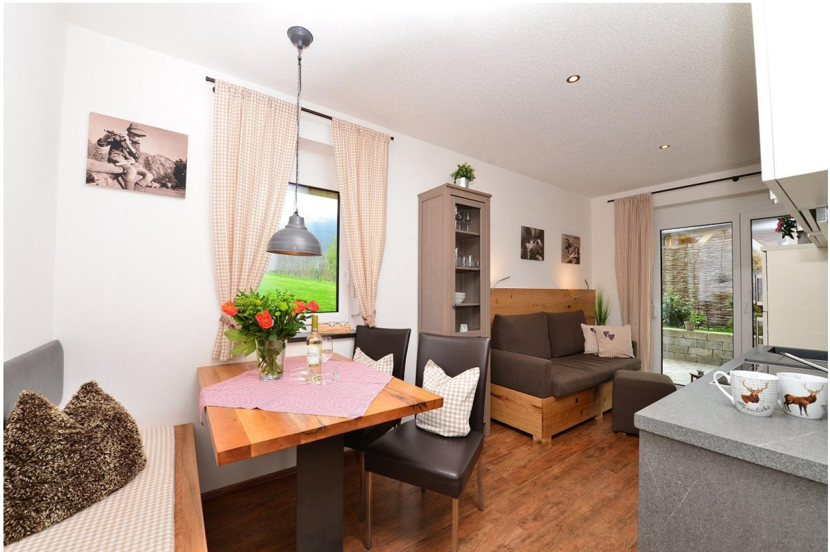
Ess-, Wohnzimmer kleine Whg.