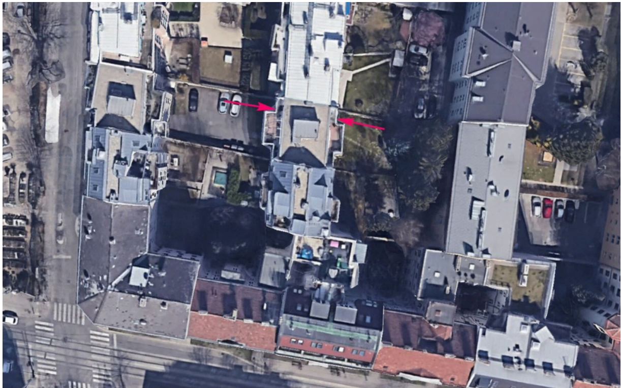
Lage in der Natur und Ausrichtung der Wohnung