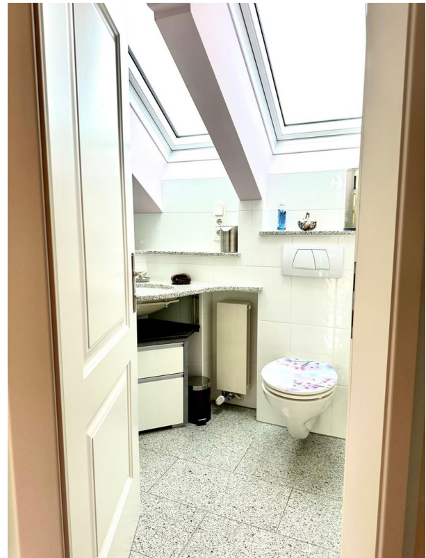
Top 2 - Bad