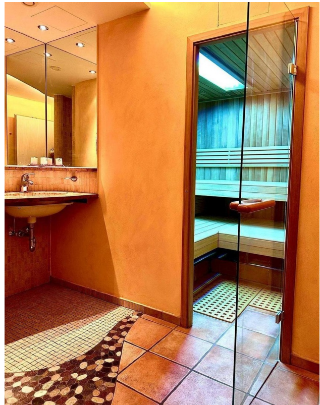
Bad - Wellness