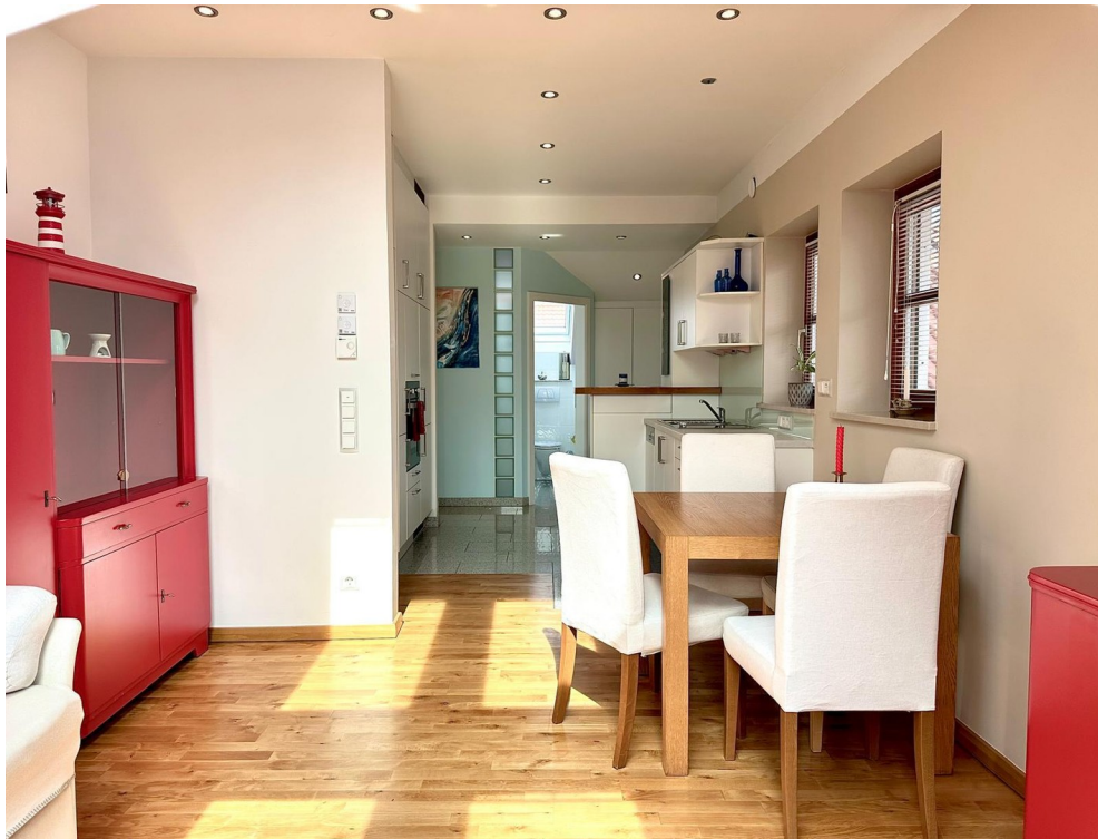
Top 2 - Essen