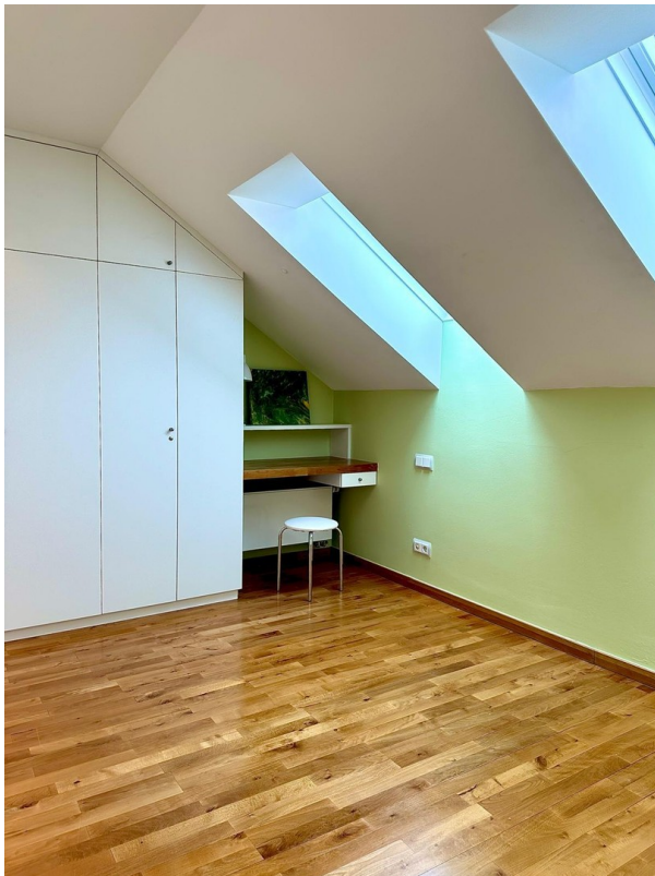
Top 2 - Schlafen