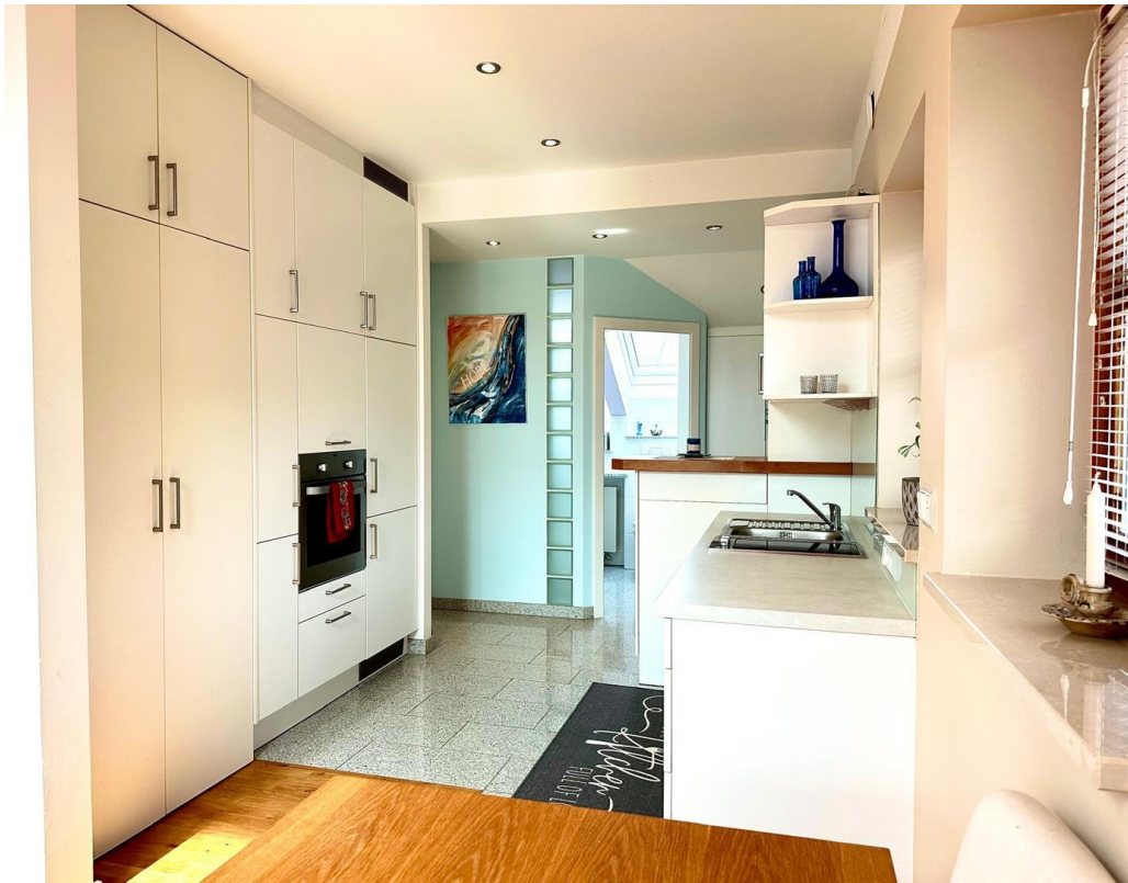
Top 2 - Kochen 2