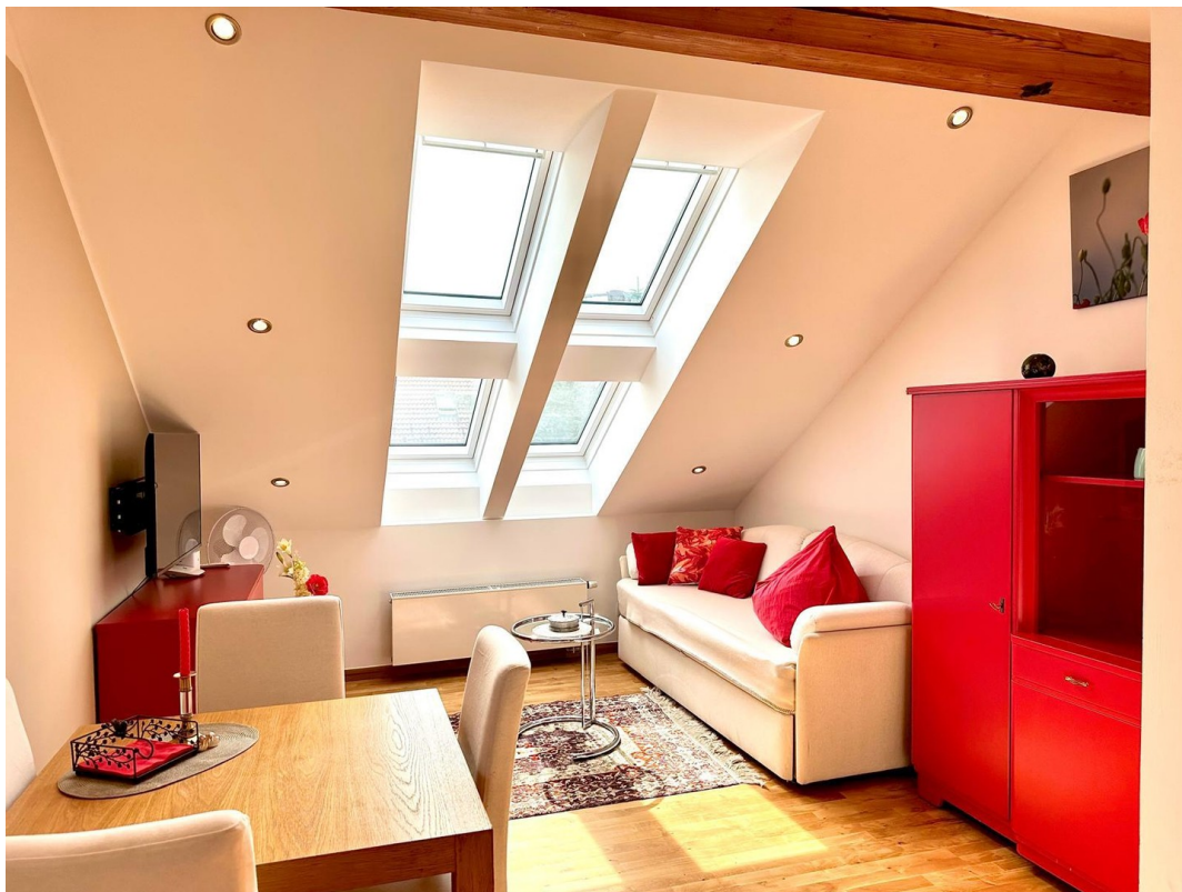
Top 2 - Wohnen