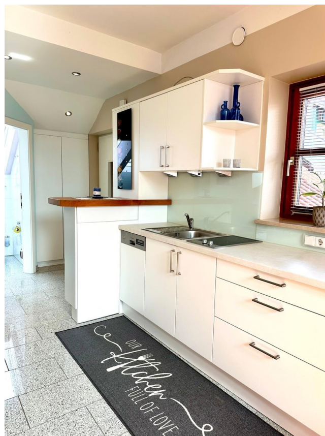
Top 2 - Kochen 1