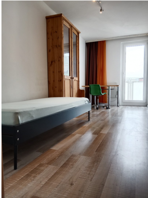
Das Zimmer neben Balkon