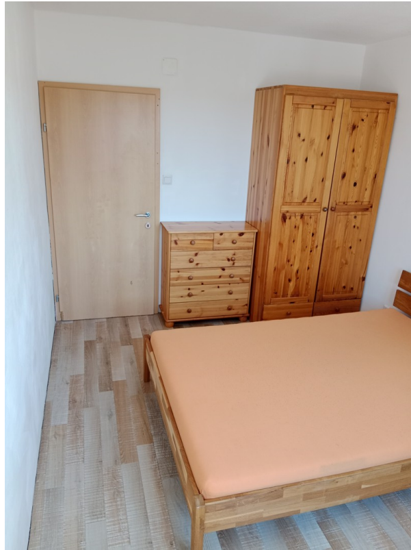
Das Zimmer hofseite