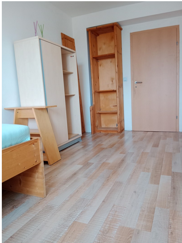
Das Zimmer neben dem Balkon