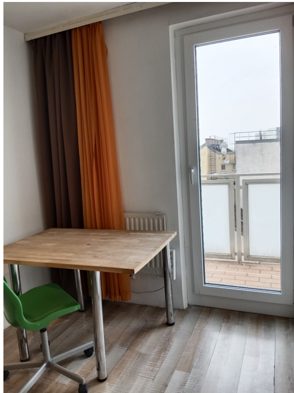
Das Zimmer mit Balkontür