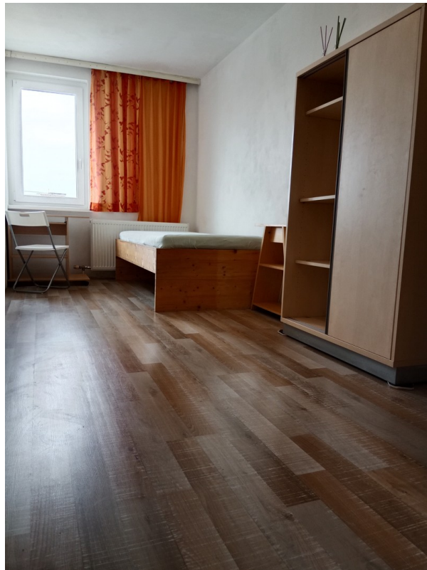
Das Zimmer neben dem Balkon