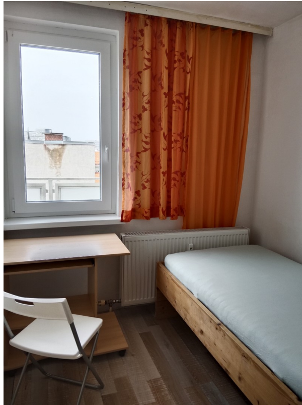
Das Zimmer neben dem Balkon