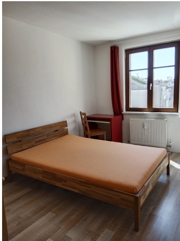
Das Doppelbett Zimmer hofseite