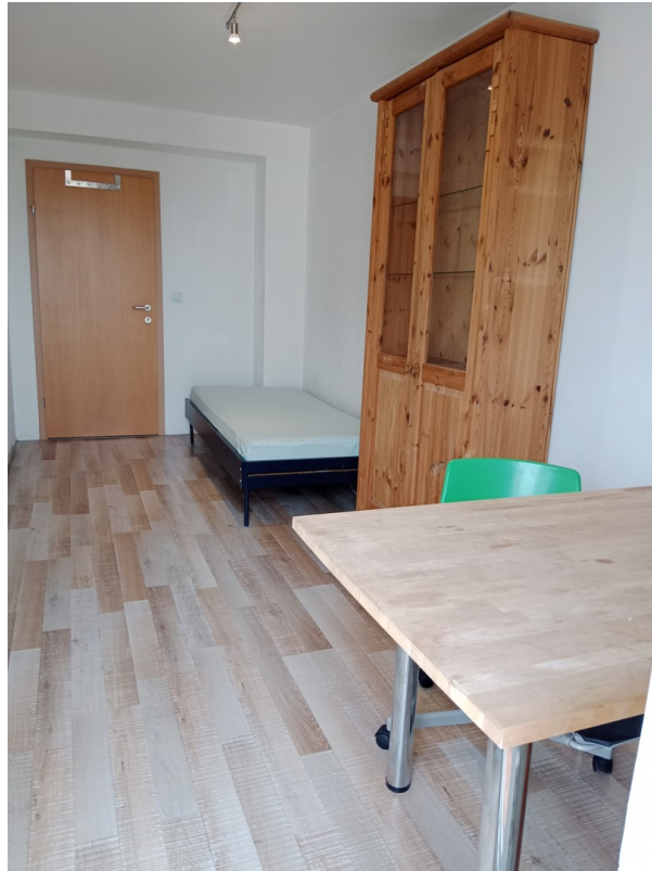
Das Zimmer neben Balkon