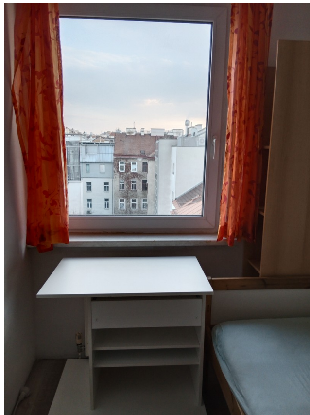
Zimmer Fenster hofseite