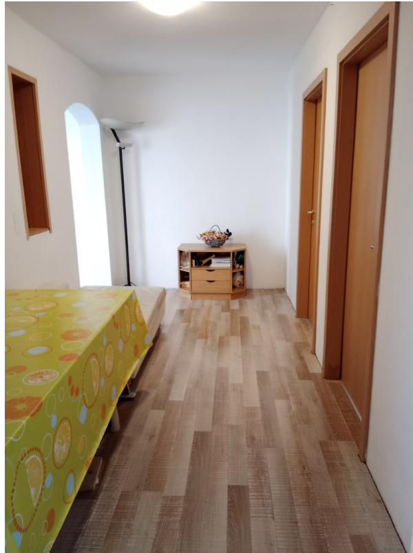
Das Wohnzimmer /Gangbereich