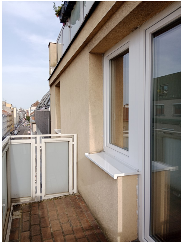
Balkon m. Balkontür Fenster