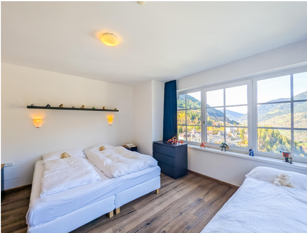
Schlafzimmer 3/Bedroom 3