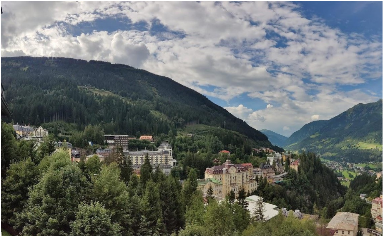
Balkon 1 Sommer/Balcony 1 summ