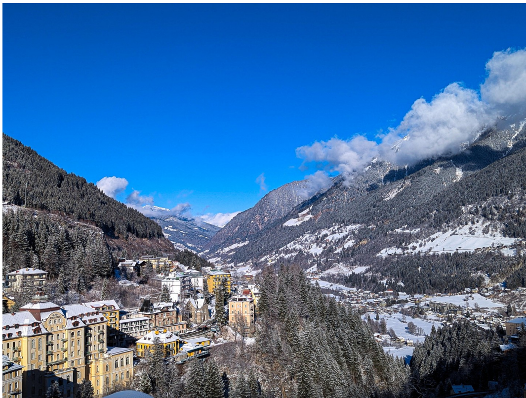
Über Wasserfall/Top of w.fall