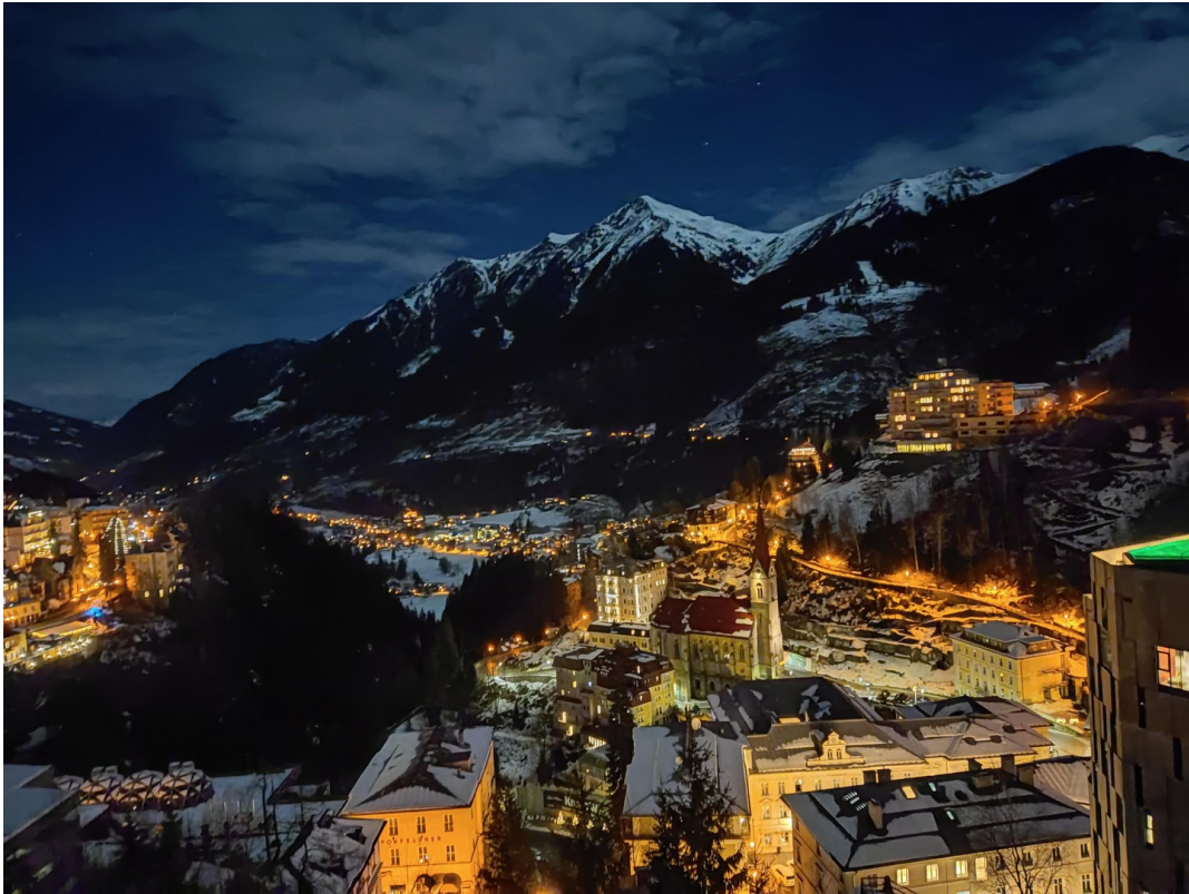
Balkon 1 Nacht/Balcony 1 night