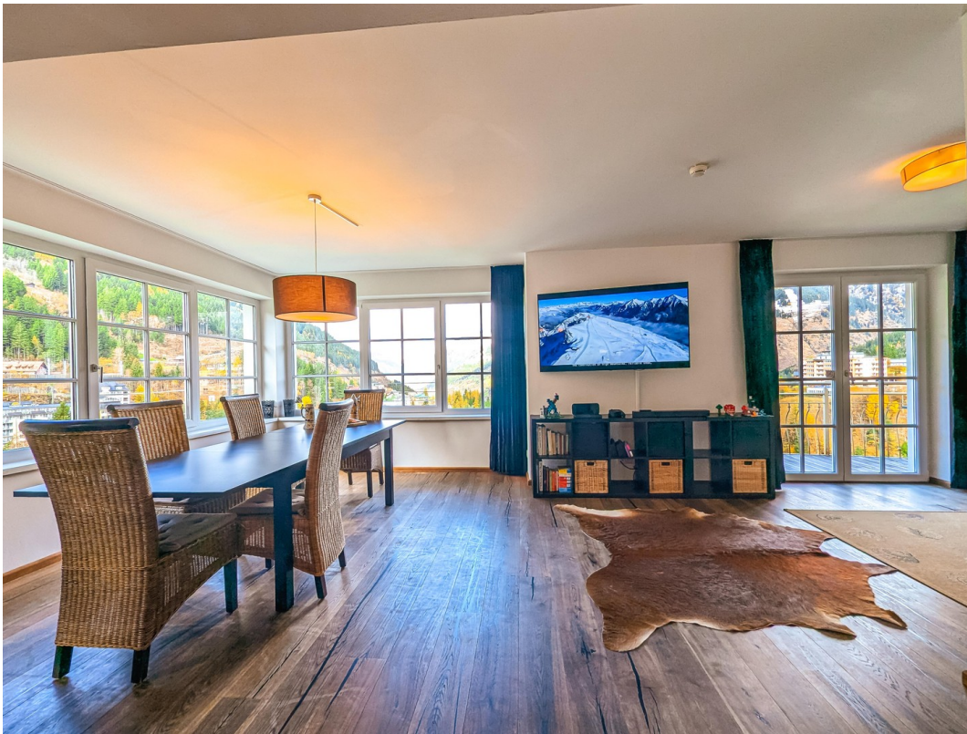
Essen und Leben/Dine and live