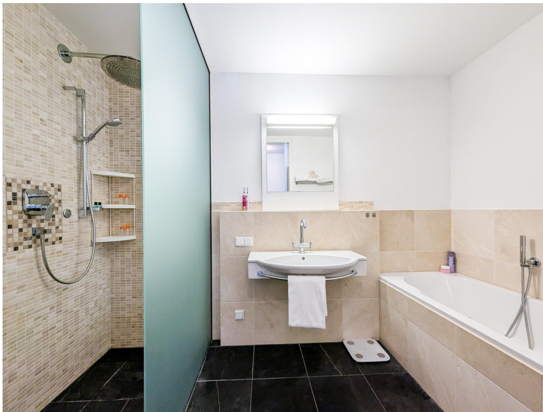
Bad 1/Bath room 1