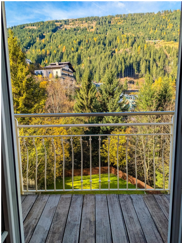
Balkon 2 Herbst/Balcony 2 fall