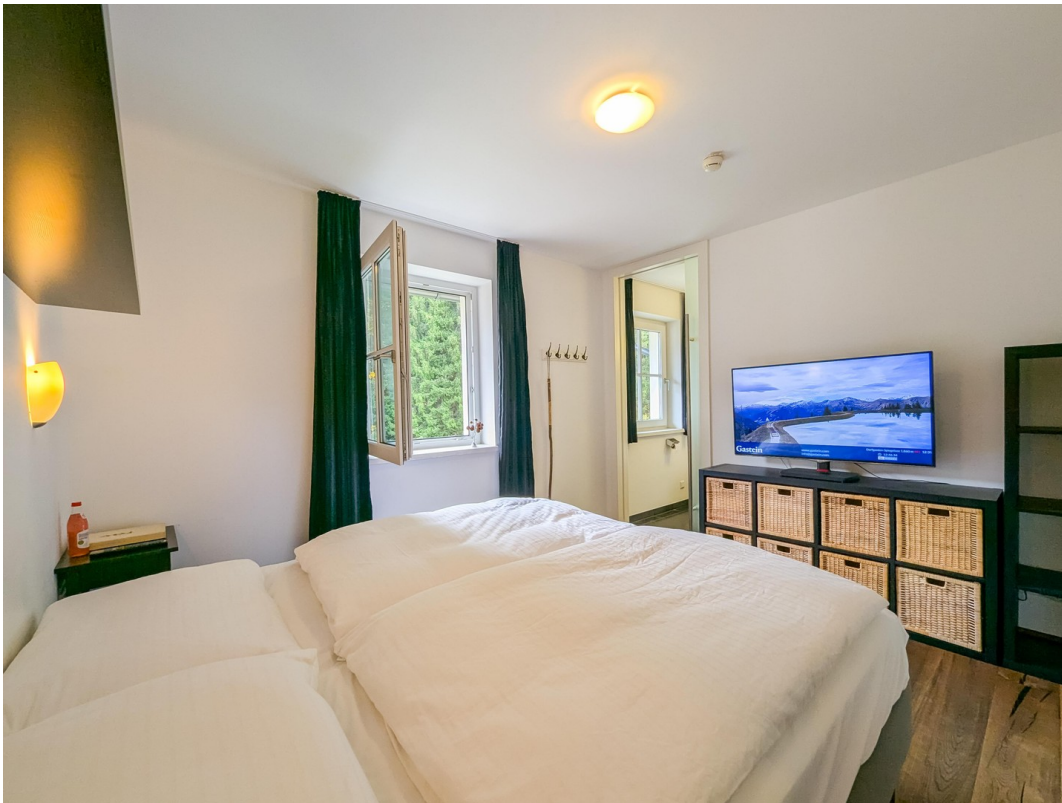
Schlafzimmer 1/Bedroom 1