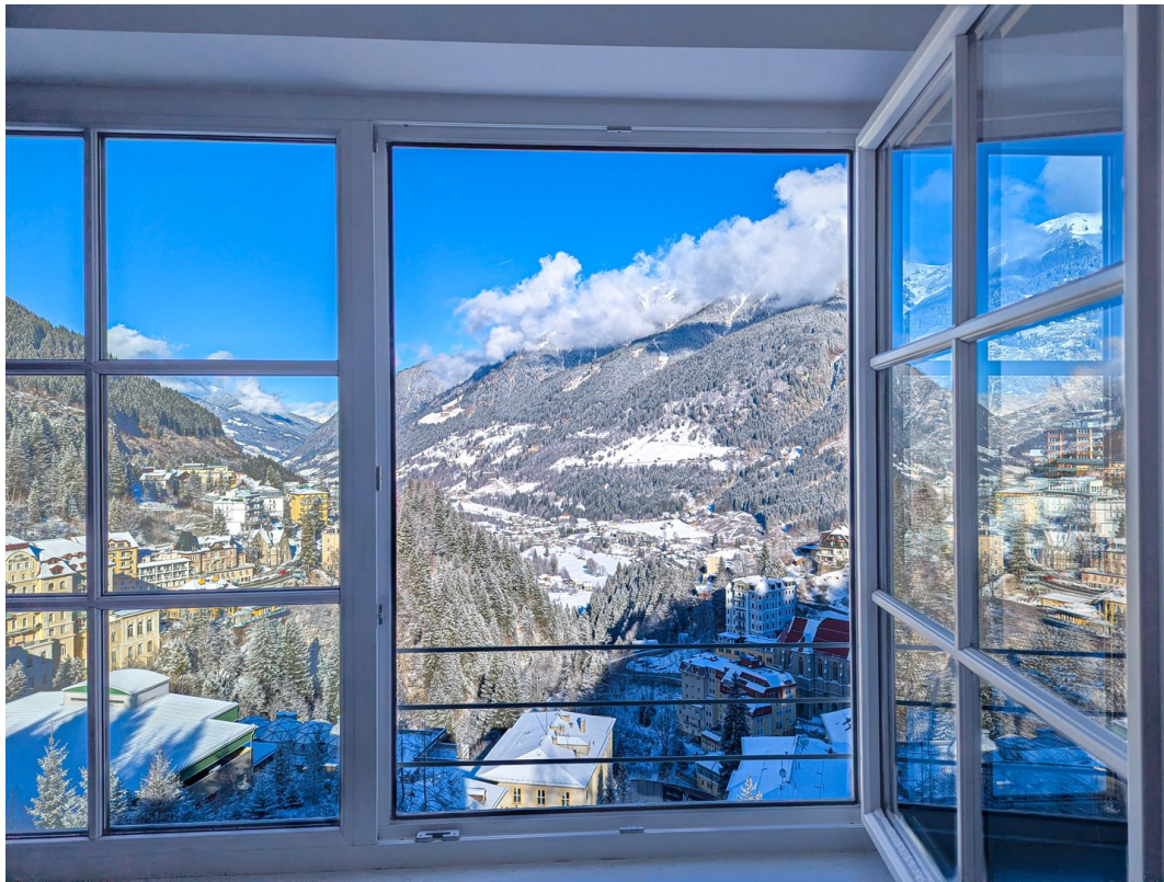
Fenster in die Alpen/Window