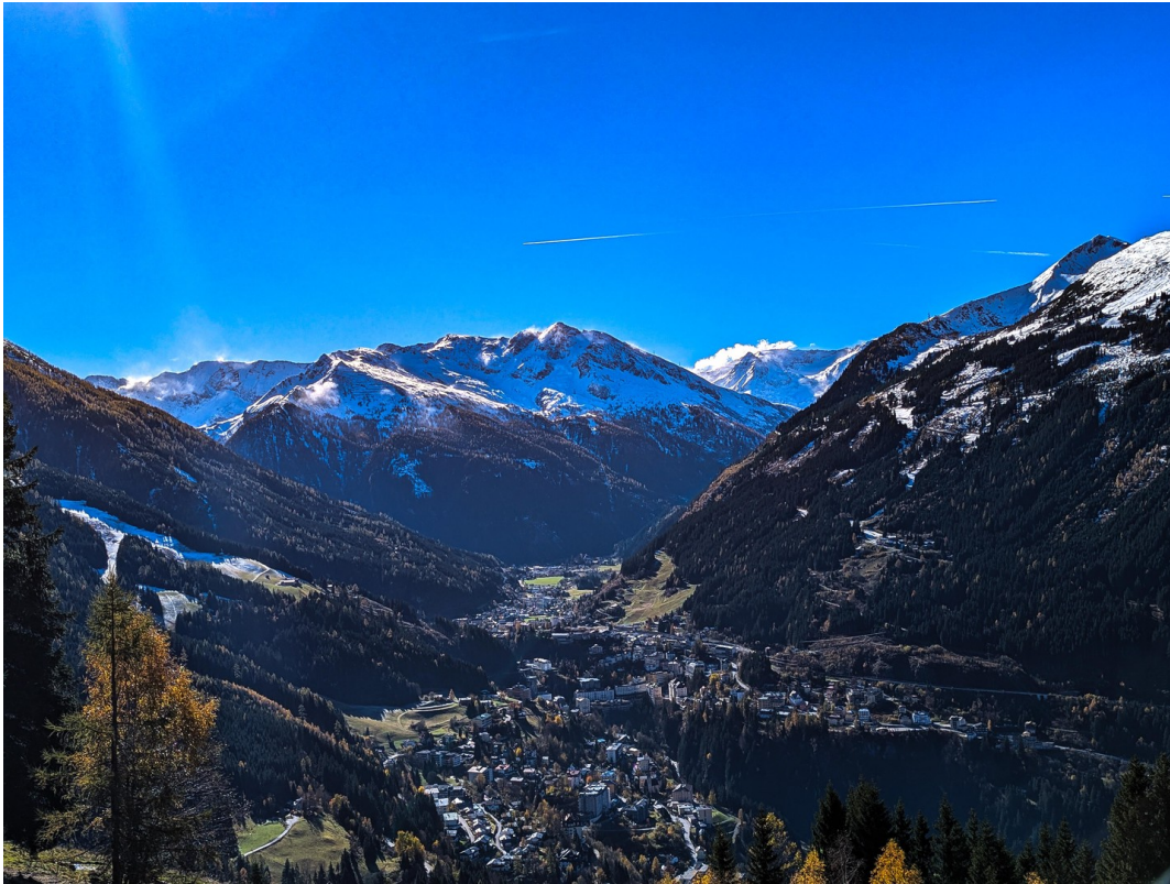
Blick auf Gebäude/View on Bldg