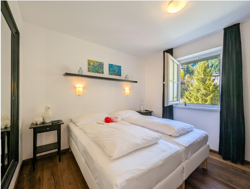
Schlafzimmer 2/Bedroom 2