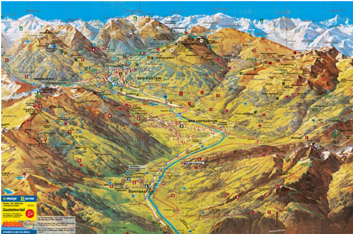
Wanderkarte/Hiking trail map