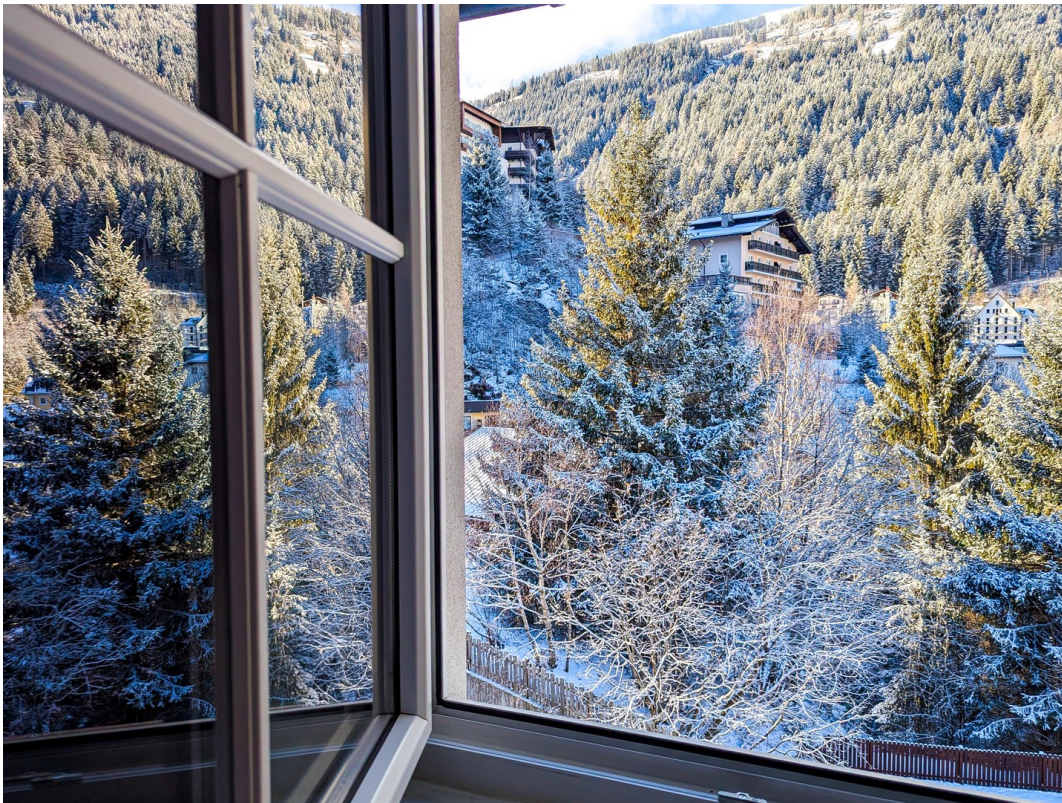
Schlafzimmerblick 2/BR view 2