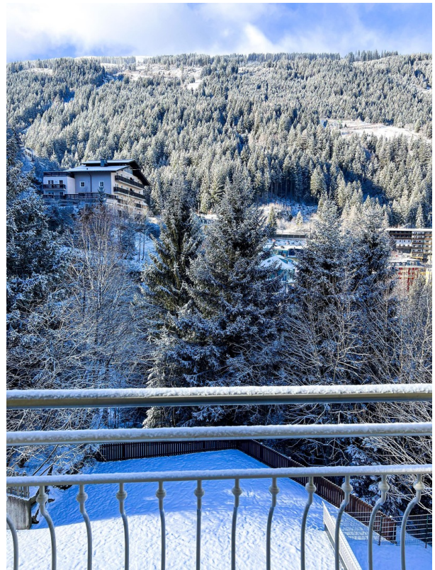
Balkon 2/Balcony 2