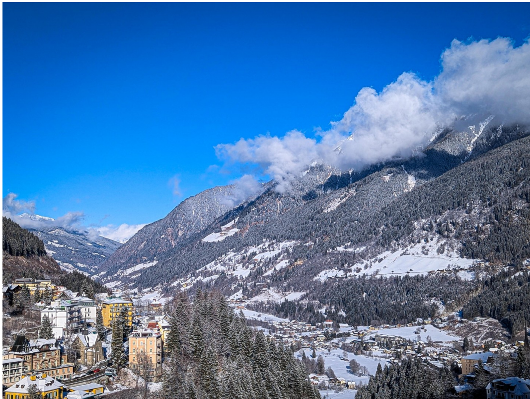
Balkon 1 Winter/Balcony 1 wint