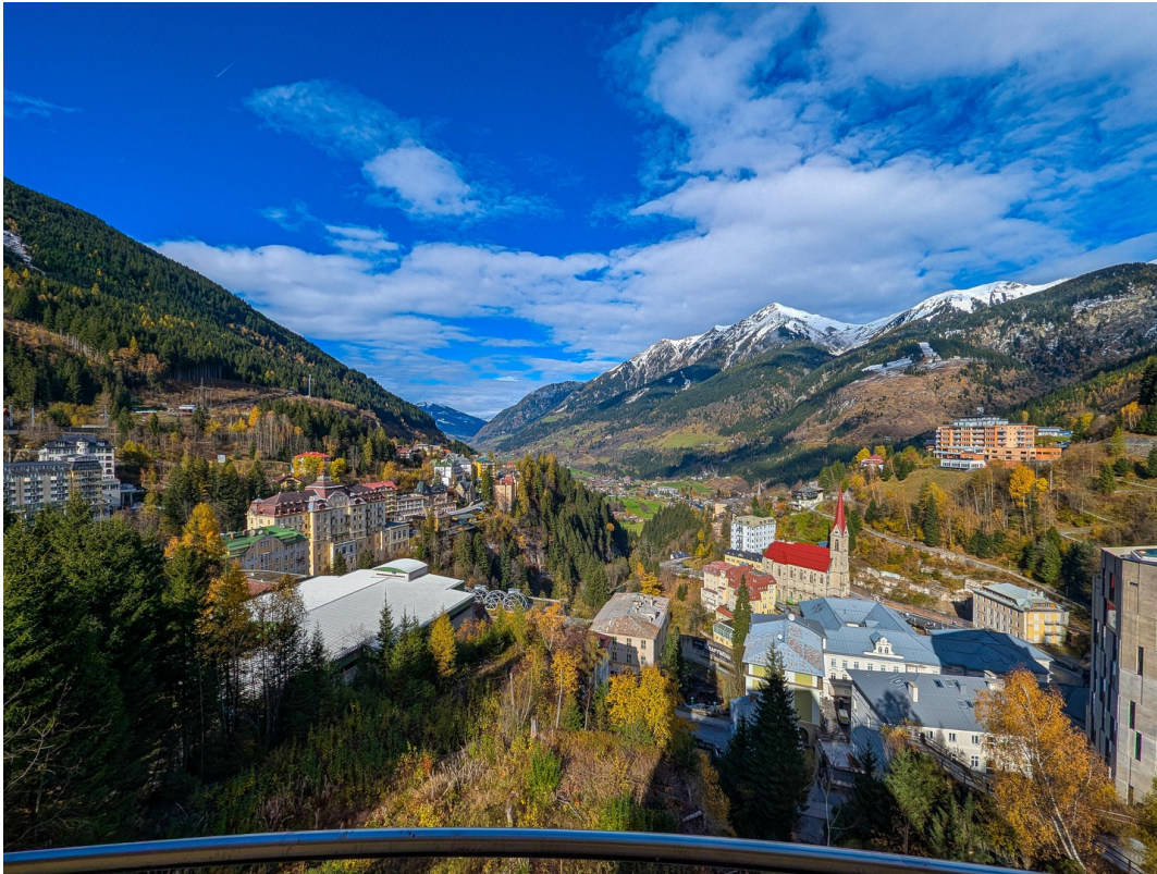
Balkon 1 Herbst/Balcony 1 fall