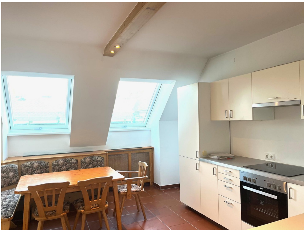
Wohnküche mit Essplatz