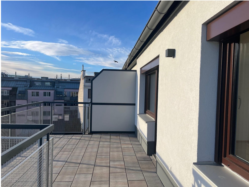
Südterrasse mit Blick