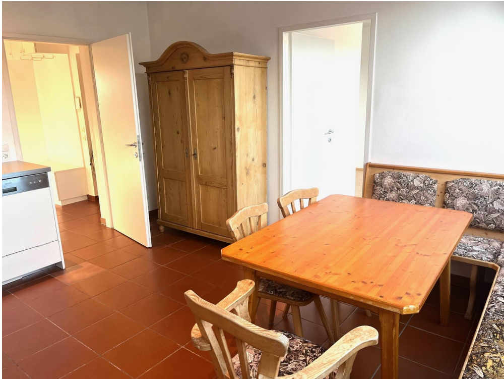
Wohnküche mit Essplatz