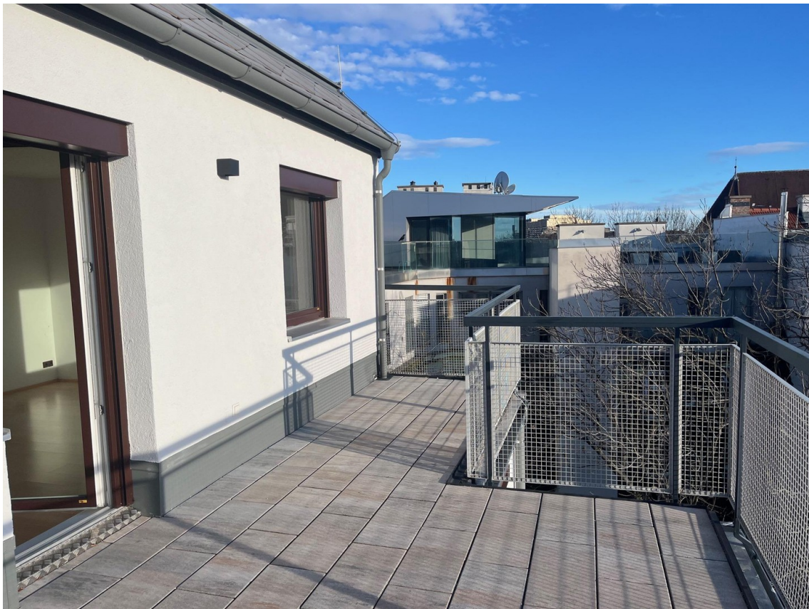
Südterrasse mit Blick