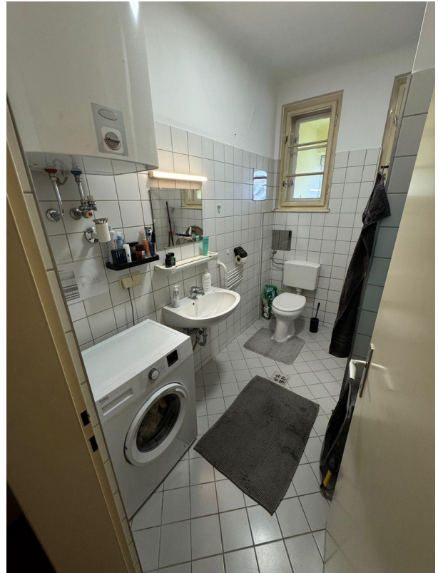
Bad/WC Dusche Waschm.