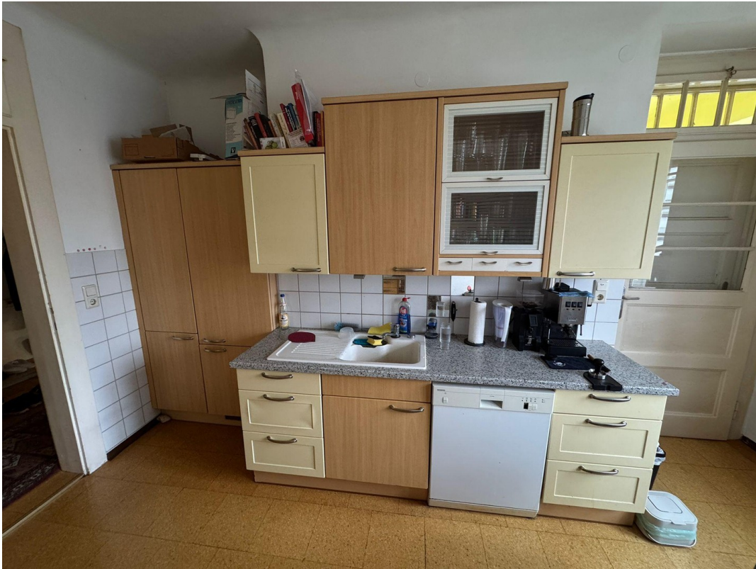
Küche (Kühlschr. Geschirrsp.)