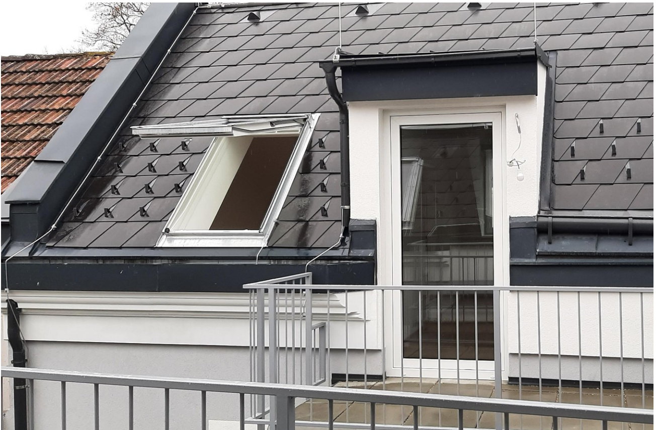
Balkon 4m 2