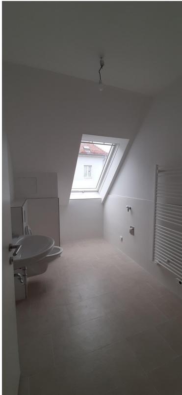
Duschbad mit Fenster