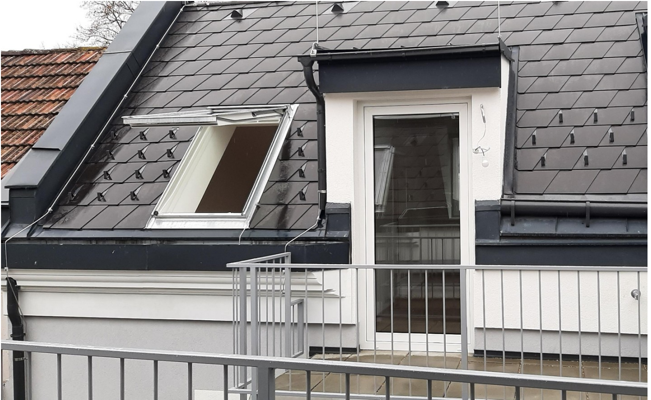
Balkon 4m 2