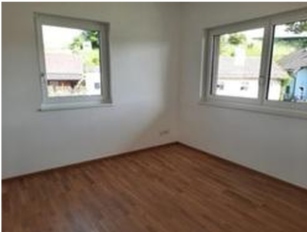
Wohnzimmer mit Eichenparkett