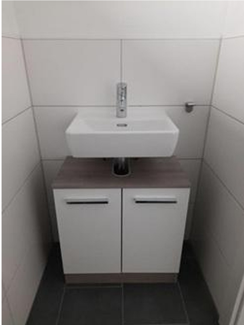
mit Handwaschbecken und Waschb