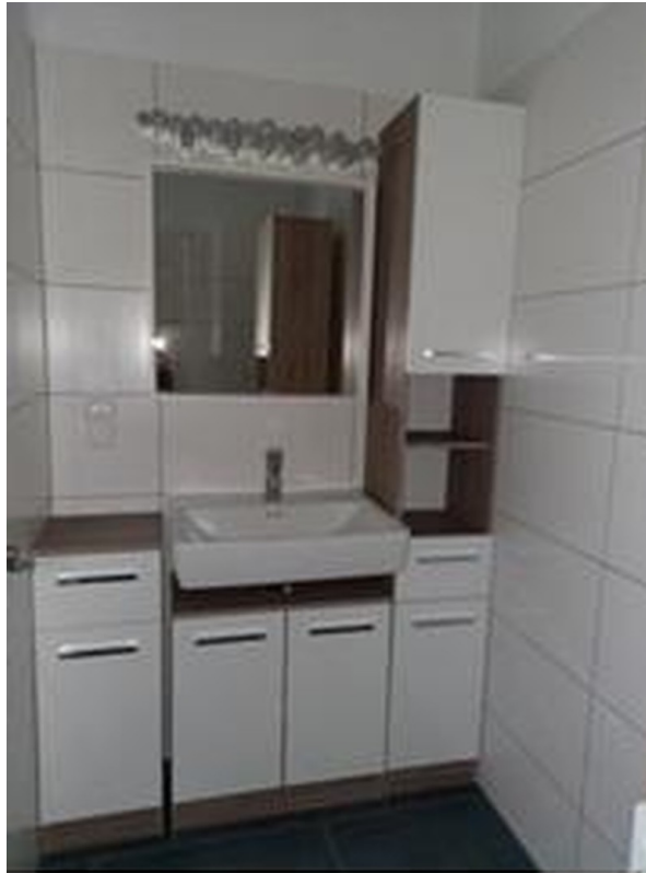
Badezimmer mit Handwaschbecken