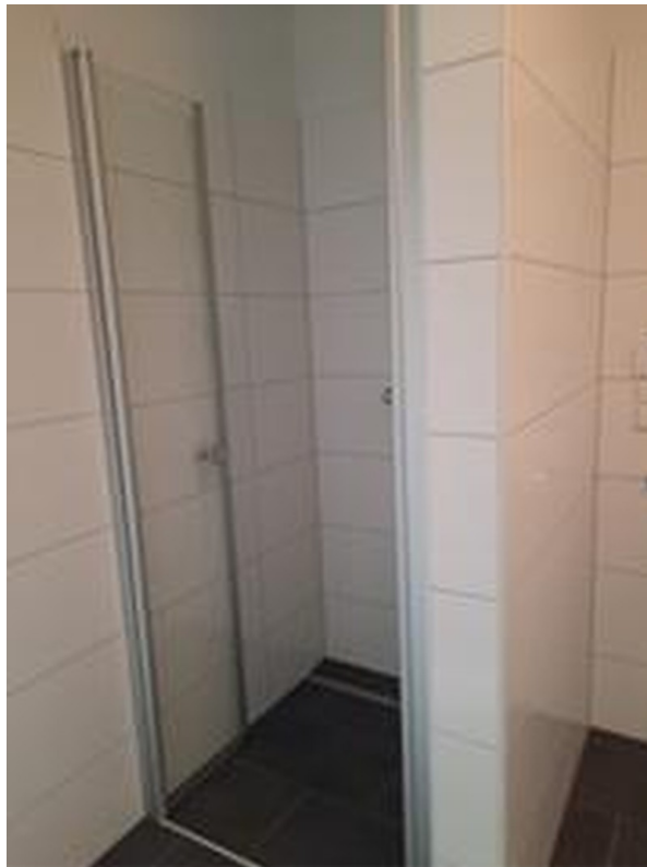
Badmöbel und bodenebenem