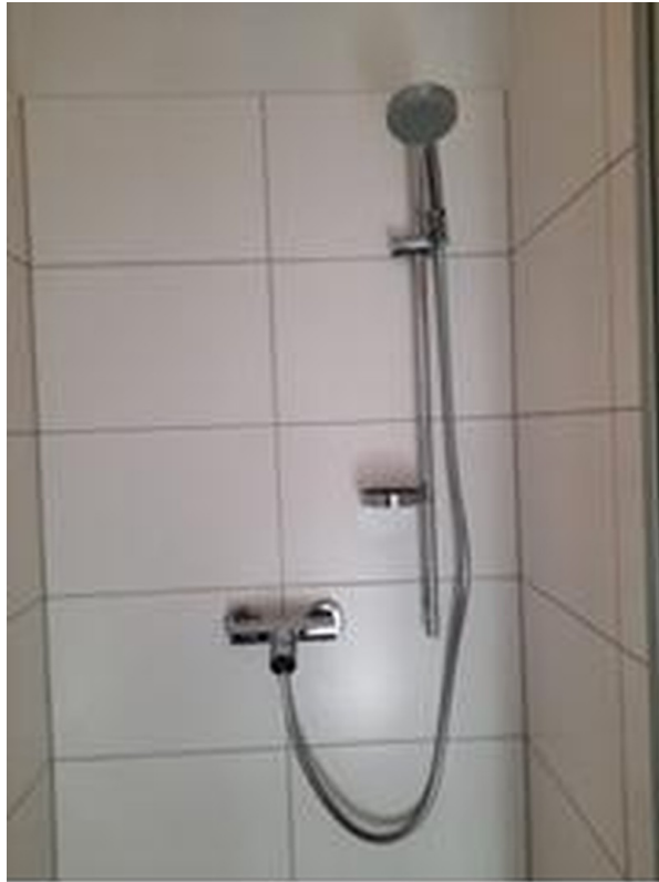
Duschbereich mit Duschrinne