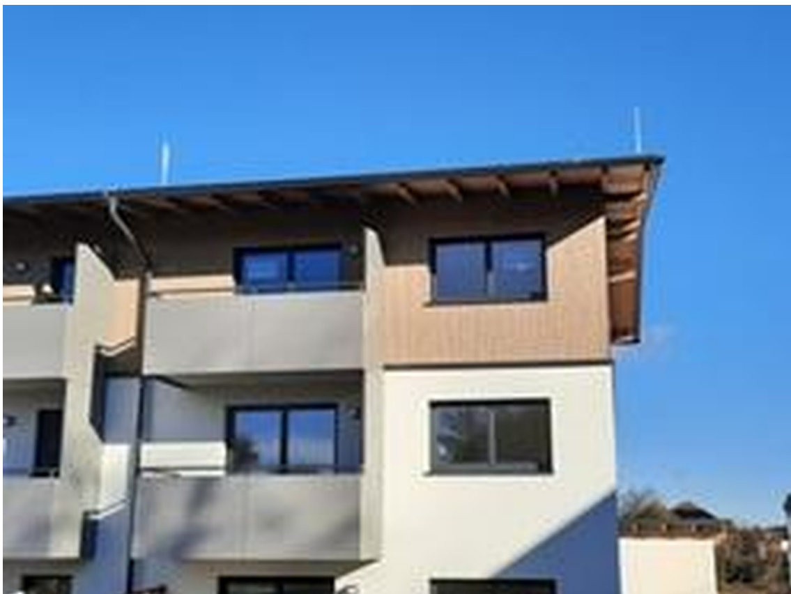
Balkonwohnung im 2. OG