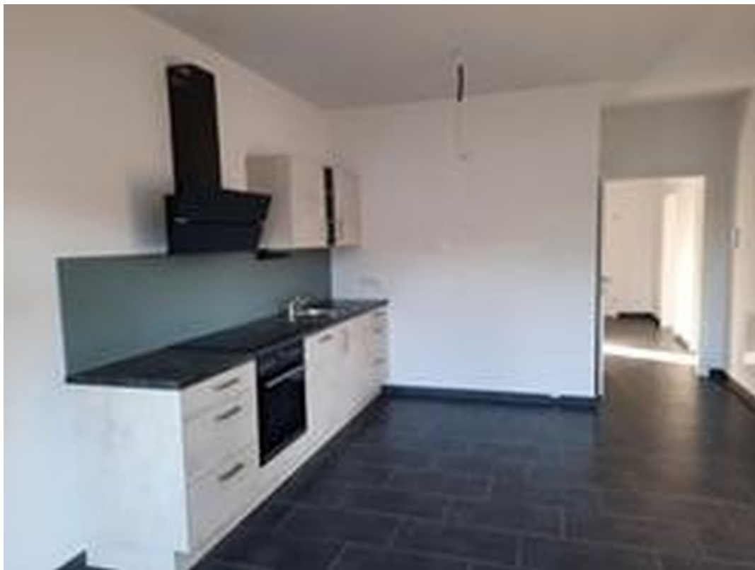
Wohnküche mit moderner EBK