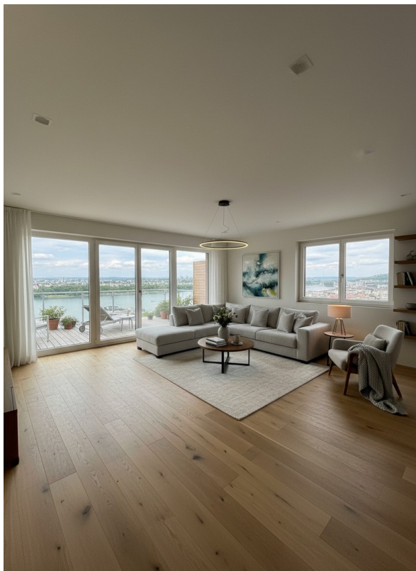
Wohnküchebereich - KI