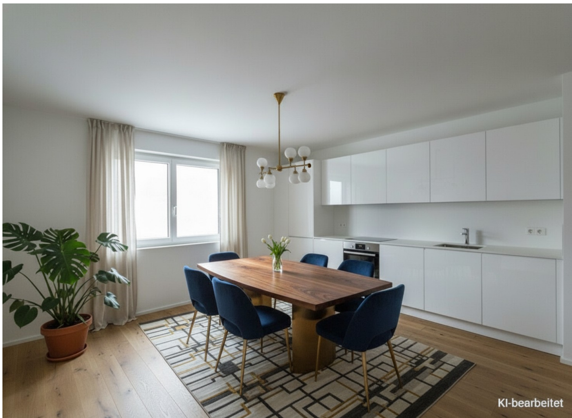
Küchenbereich - KI generiert