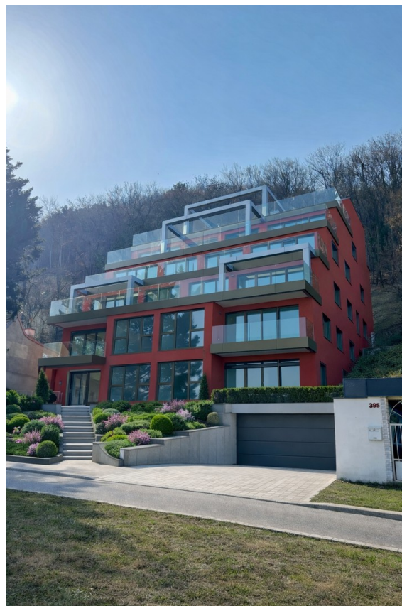
Außenfassade (Vorgarten KI)