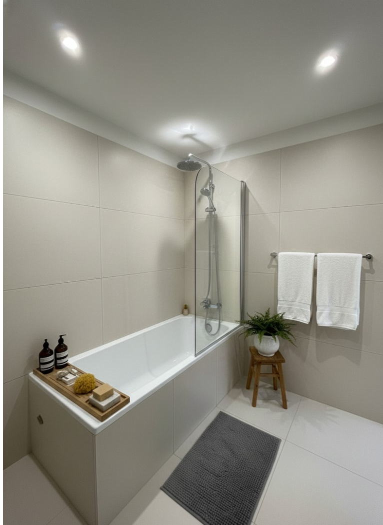
Badezimmer - KI generiert