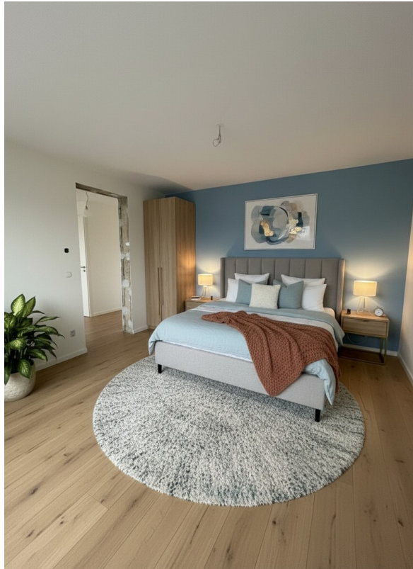
Schlafzimmer 1 - KI generiert