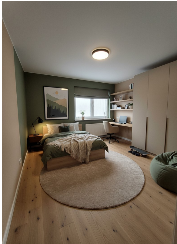
Schlafzimmer 2 - KI generiert