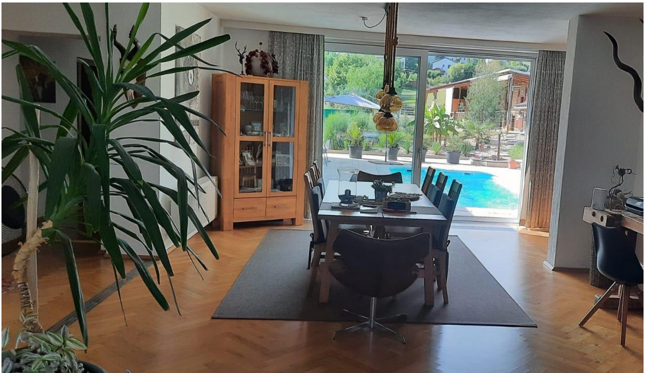
Essbereich mit Blick zum Stall