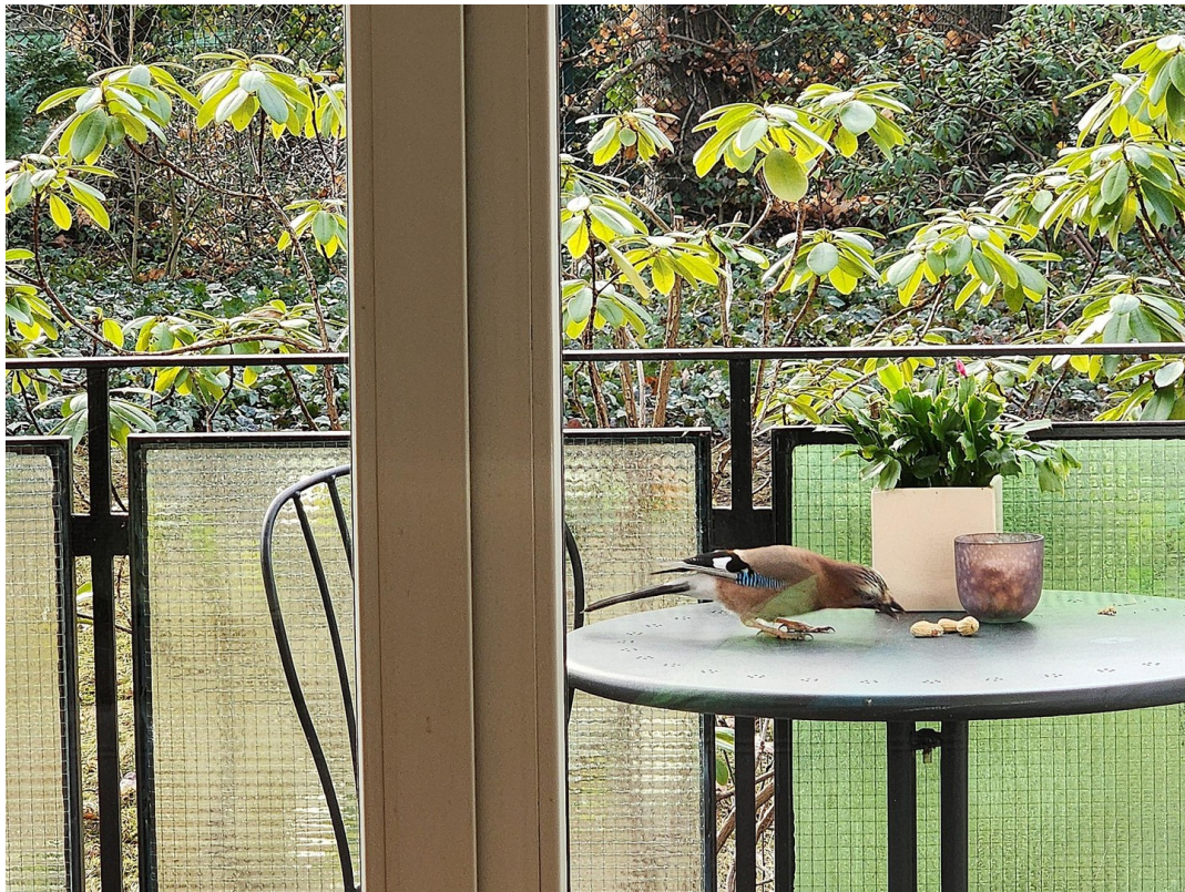
Eichelhäher beim Frühstück