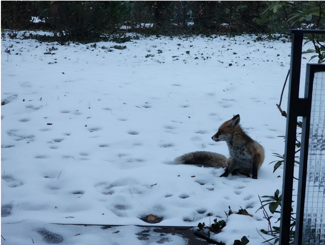
Was kommt wohl als Nächstes?