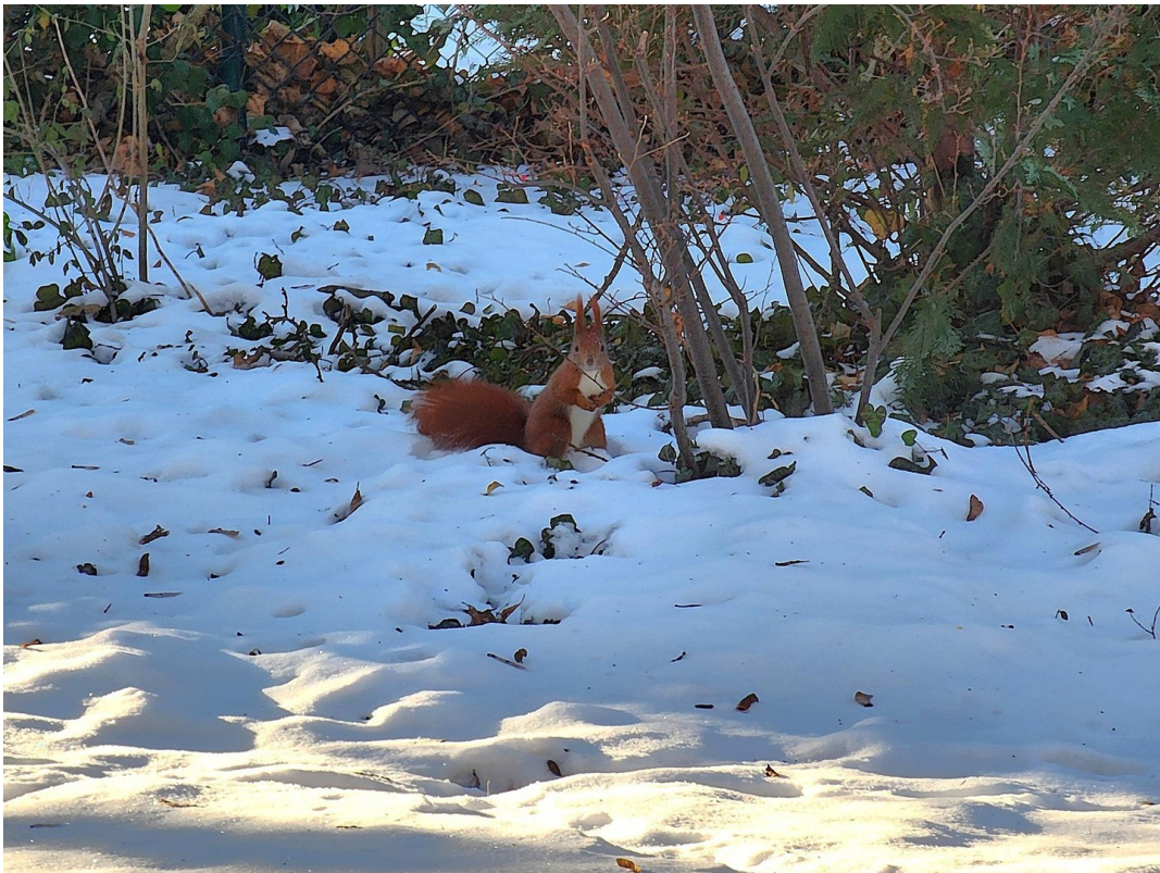
Das Versteck ist gefunden