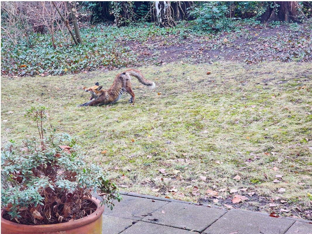
Fuchs-Yoga im eigenen Garten