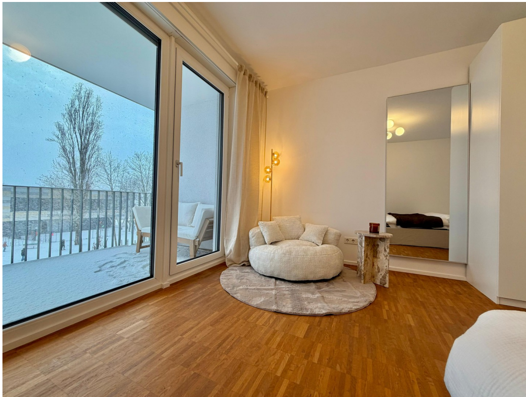
WG-Zimmer (1. rechts)