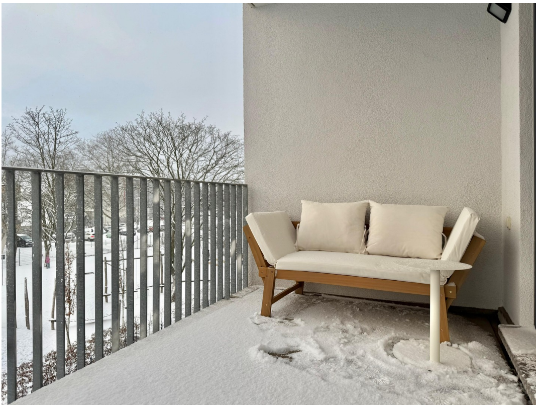
WG-Zimmer (1. rechts)