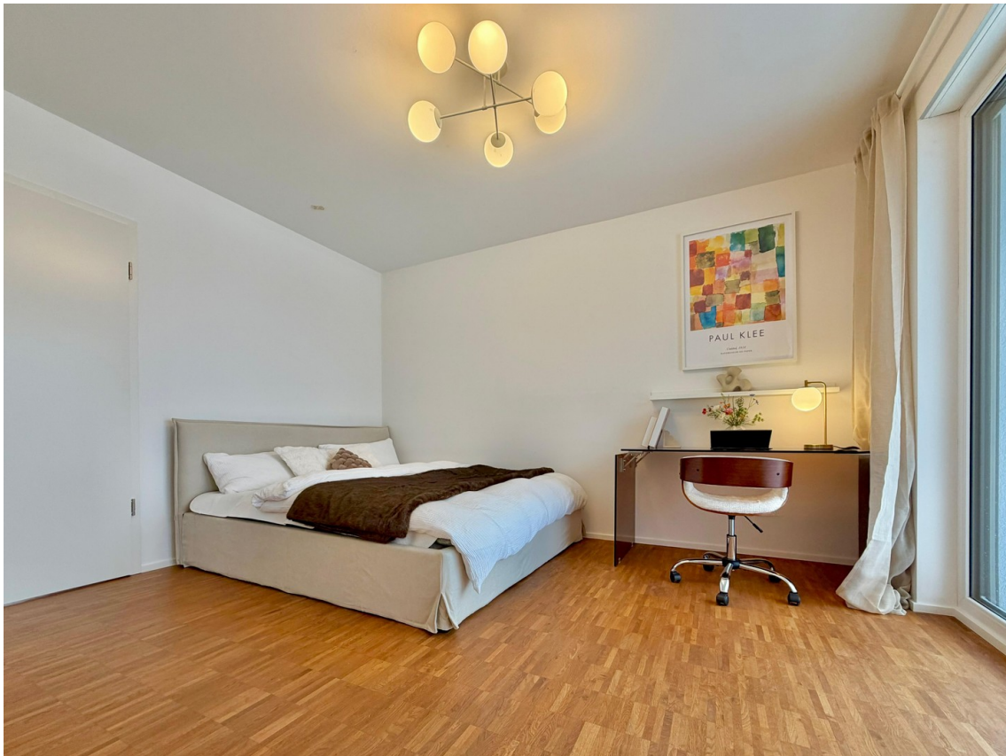
WG-Zimmer (1. rechts)