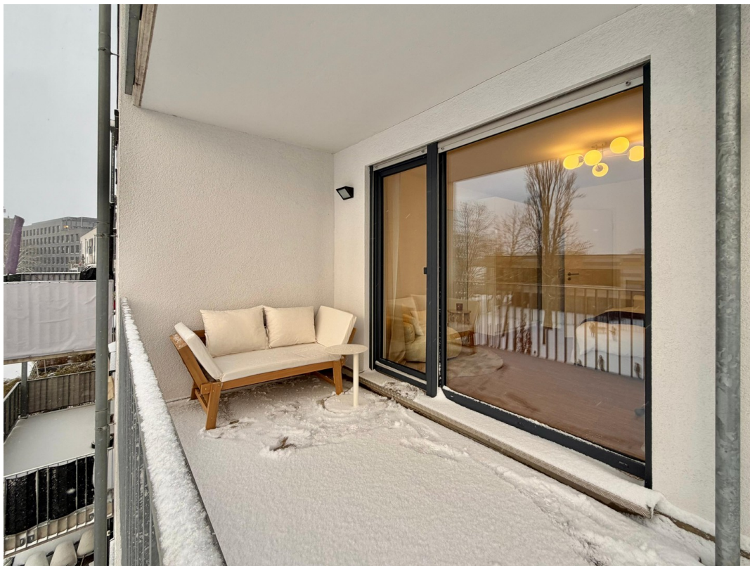
WG-Zimmer (1. rechts)