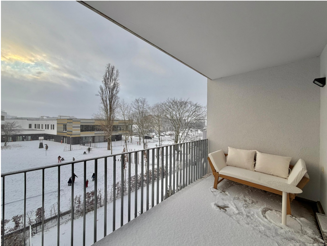
WG-Zimmer (1. rechts)