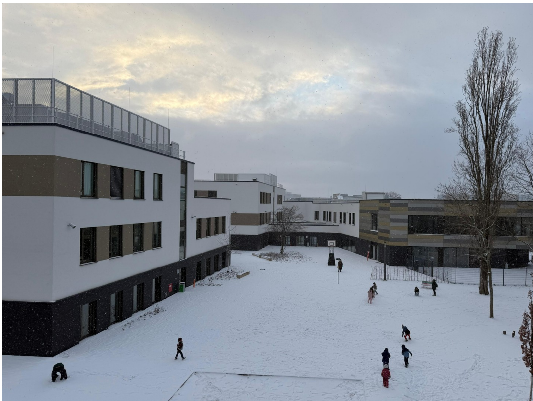
Aussicht WG-Zimmer (1. rechts)