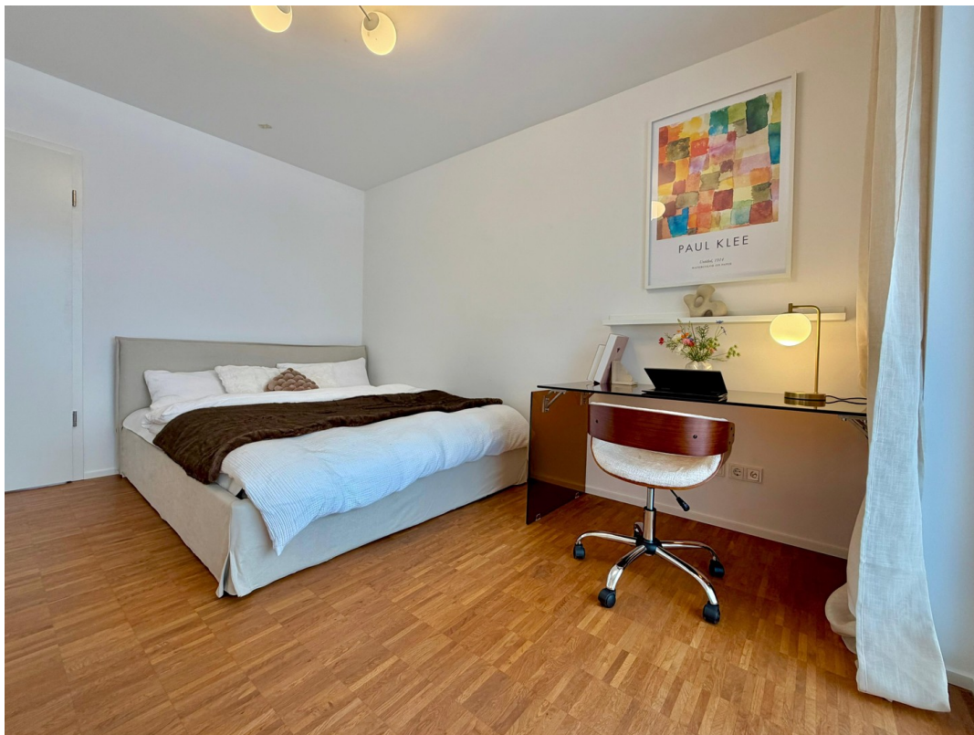
WG-Zimmer (1. rechts)