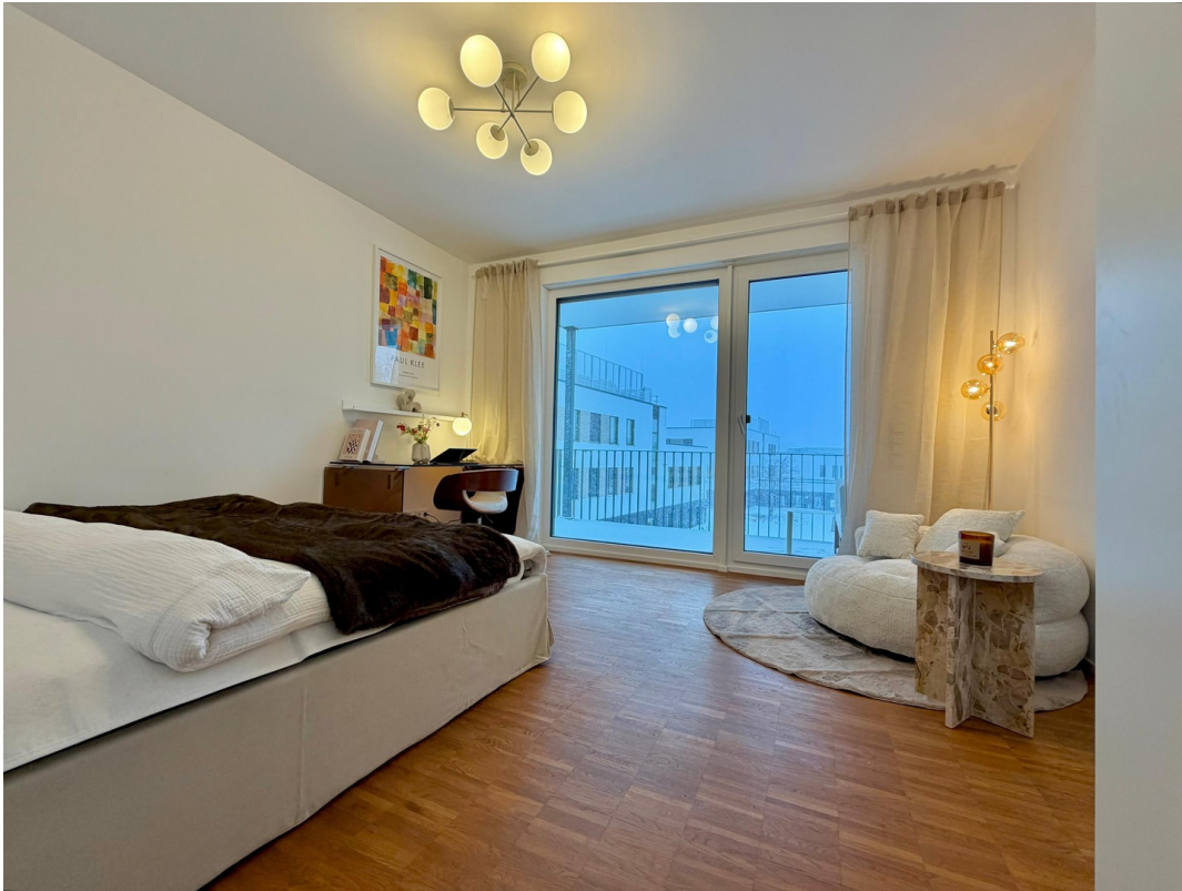
WG-Zimmer (1. rechts)