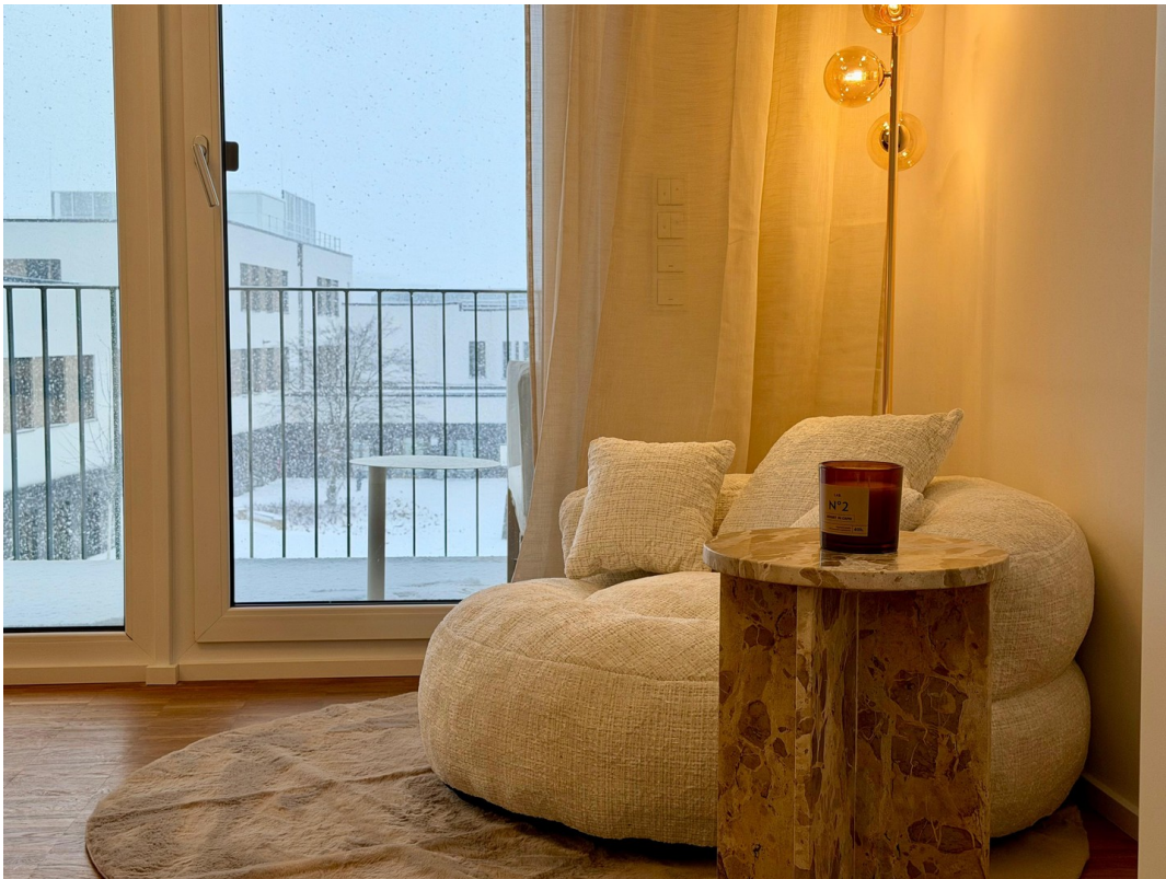
WG-Zimmer (1. rechts)