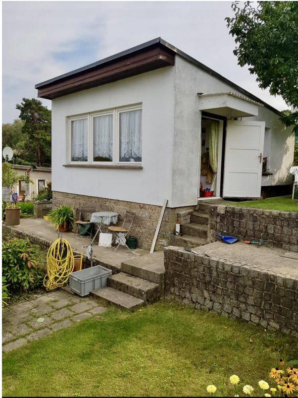
Laube mit Eingang