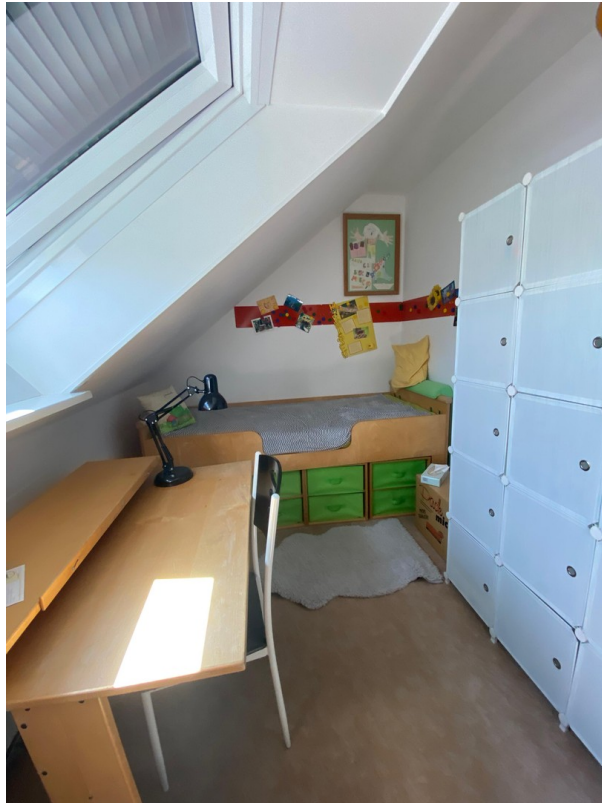
Schlafzimmer 2 - oben