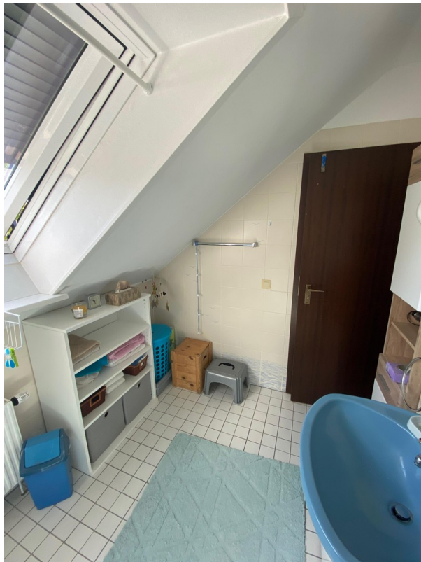
Bad - oben