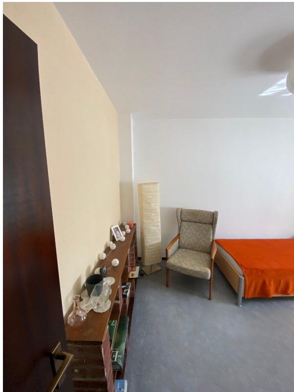
Schlafzimmer 2 - unten