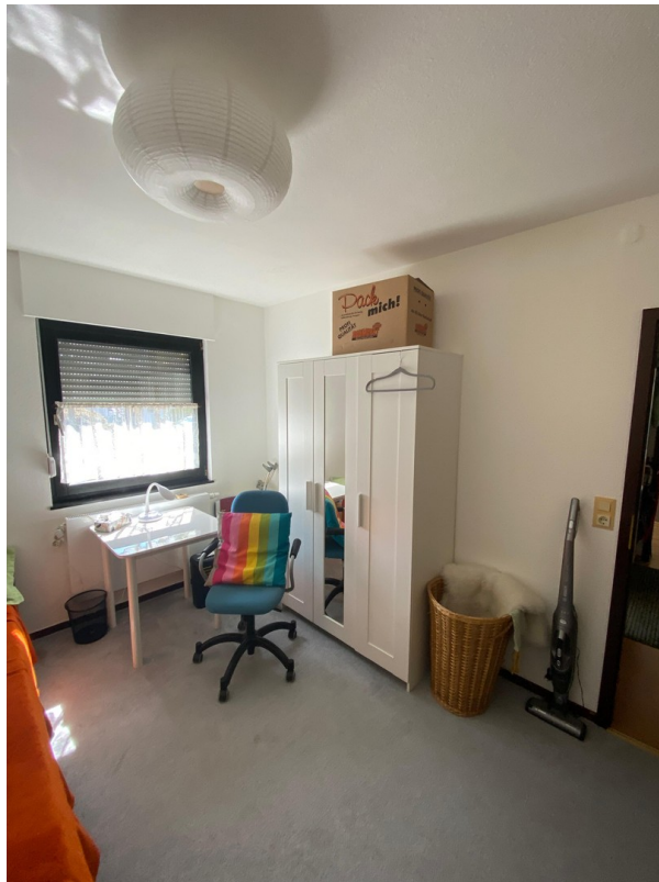
Schlafzimmer 2 - unten