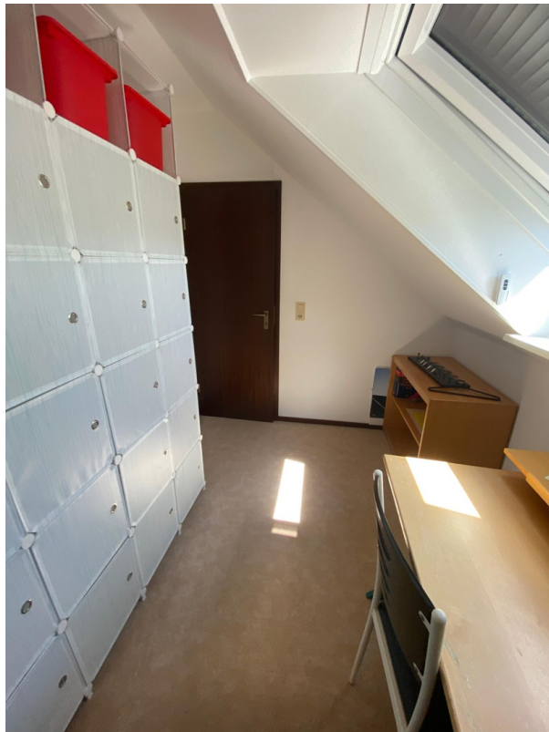
Schlafzimmer 2 - oben