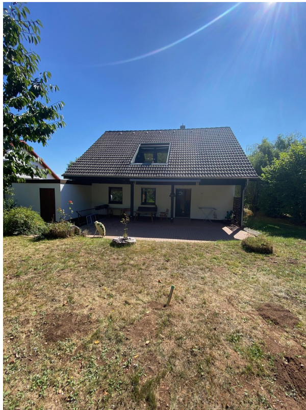
Rückseite mit Terrasse