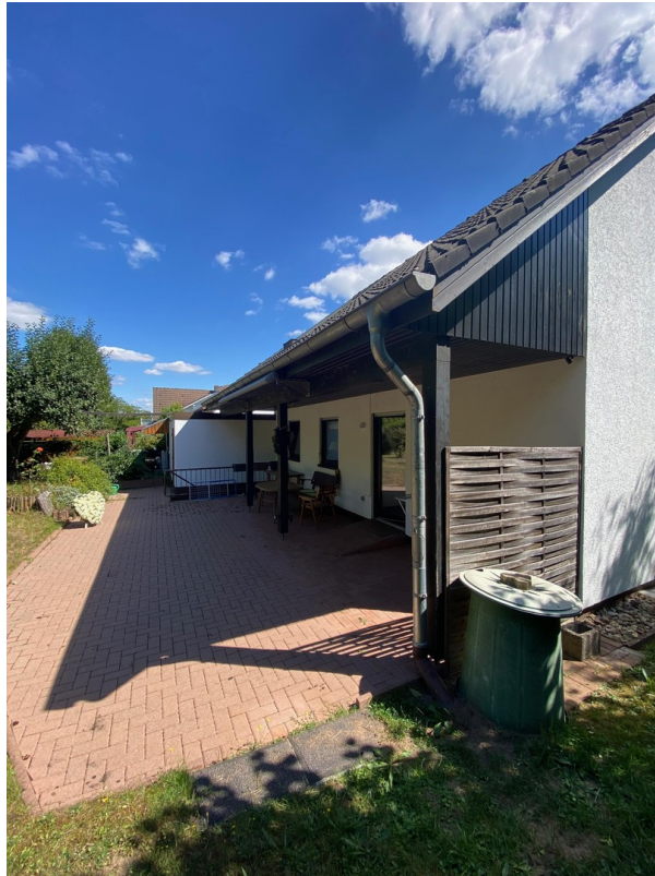
Rückseite mit Terrasse