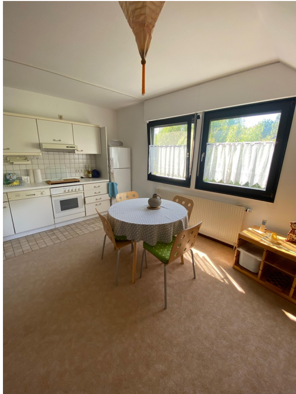
WoZi u. Küchenzeile oben