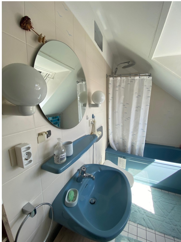
Bad - oben