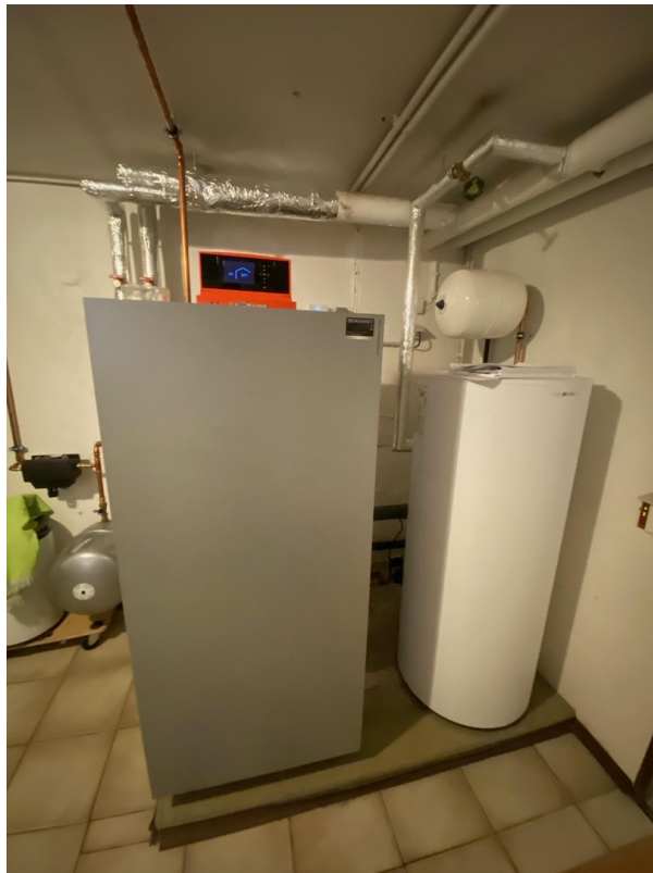
Moderne Brennwertheiz. v. 2020