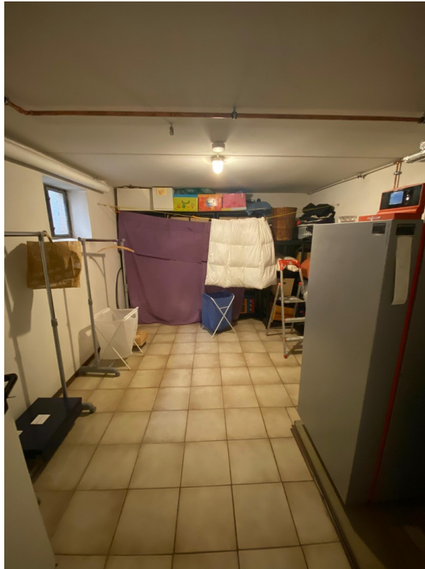
Waschküche und Heizungsraum