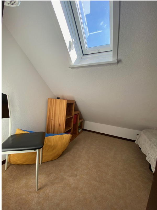
Kleines Zimmer - oben