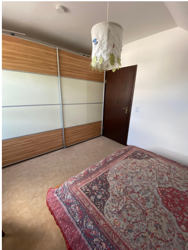
Schlafzimmer 1 - oben