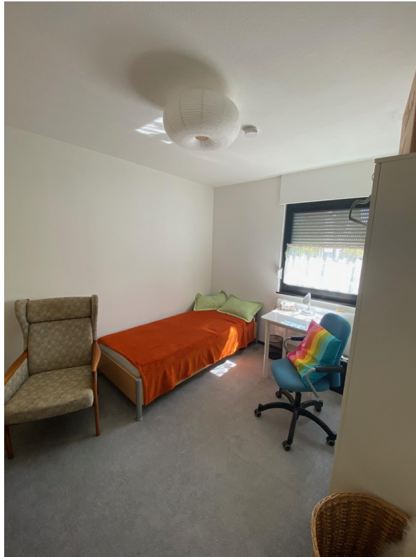
Schlafzimmer 2 - unten