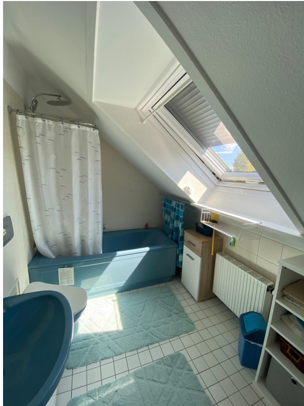
Bad - oben