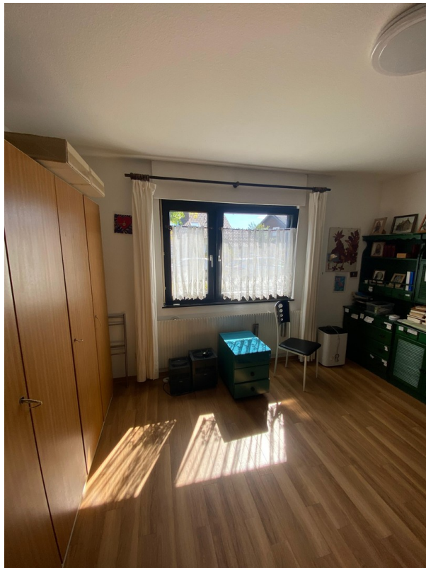
Schlafzimmer 1 - unten