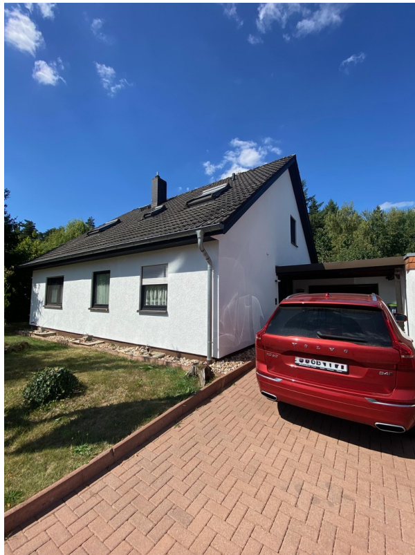
Seitenansicht re. mit Auffahrt