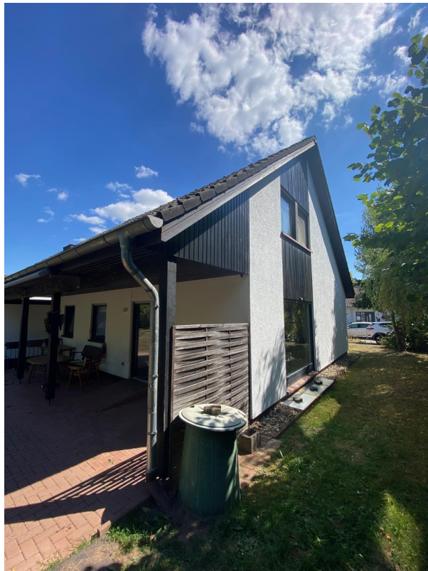
Seitenansicht links u. Rücks.