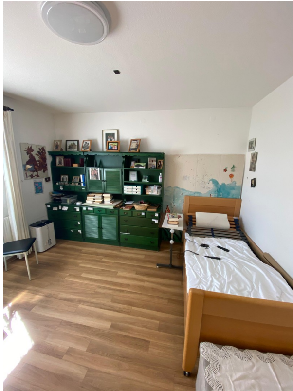
Schlafzimmer 1 - unten