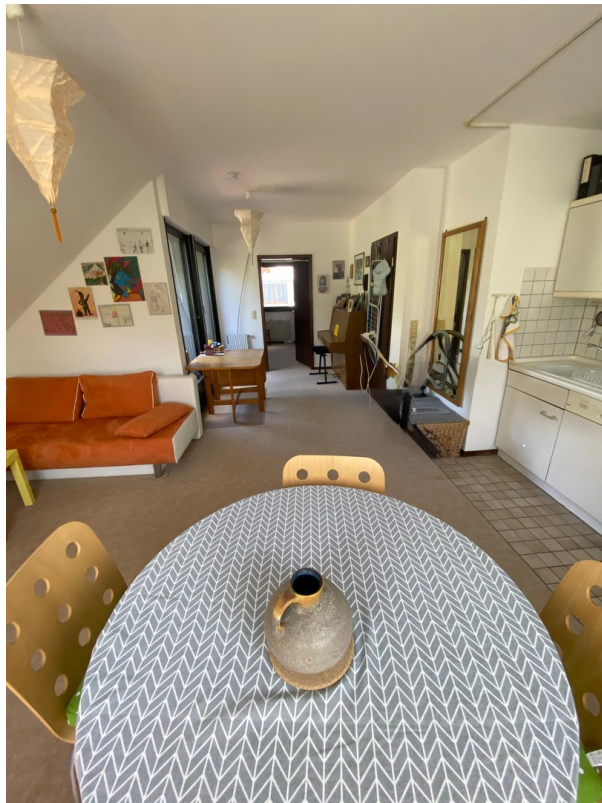
WoZi u. Küchenzeile oben