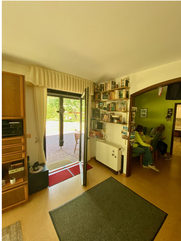
WoZi, Terrassetür u. Essz.