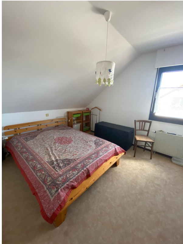
Schlafzimmer 1 - oben