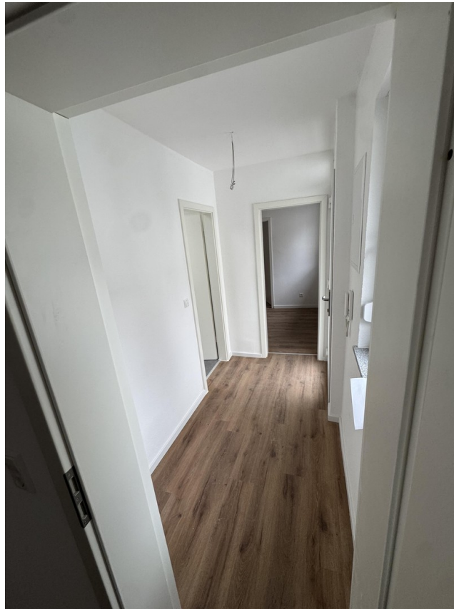
Flur / Eingang