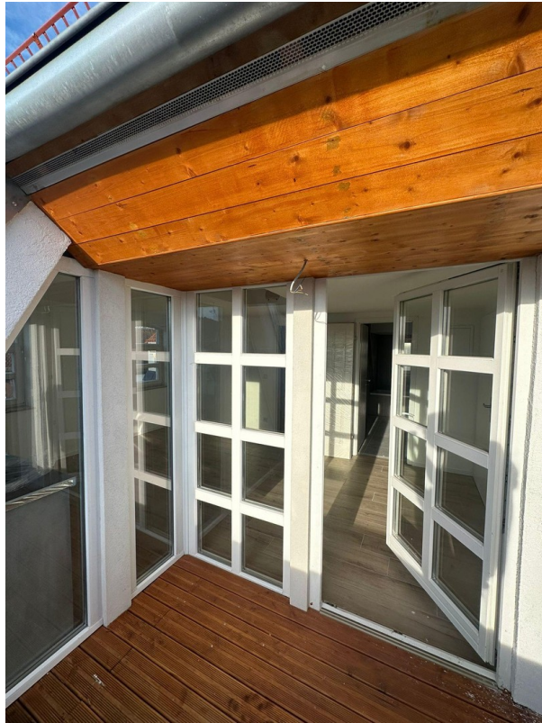
Balkon, Ansicht nach innen