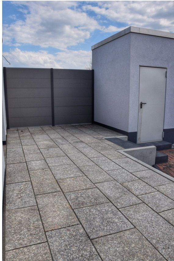
Terrasse und Schuppen