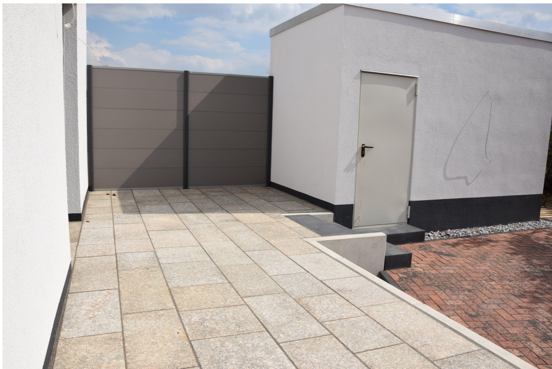
Terrasse und Schuppen