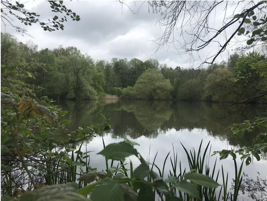
Umgebung - Ahrenriedener Teich