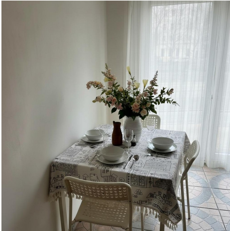
Küche - Esstisch