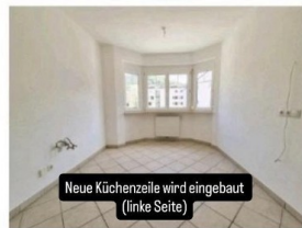
Neue Küchenzeile wird eingebaut (linke Seite)