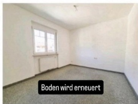
Boden wird erneuert