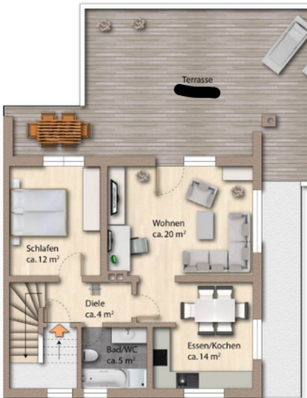
Grundriss OG mit ca. Maßangaben