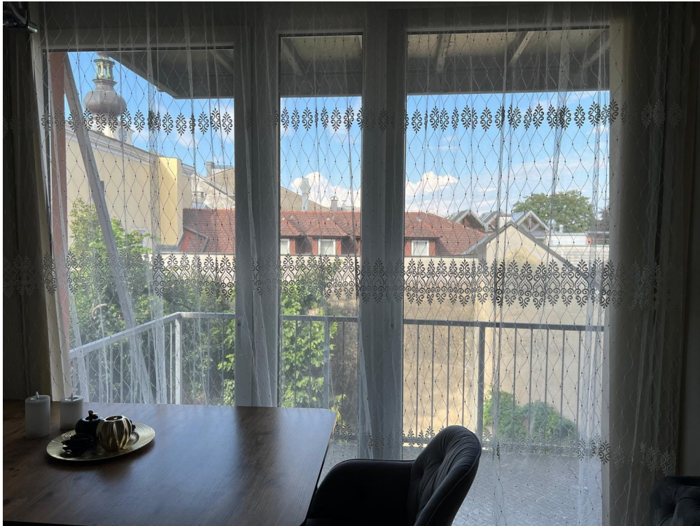
Ausblick über die Dächer