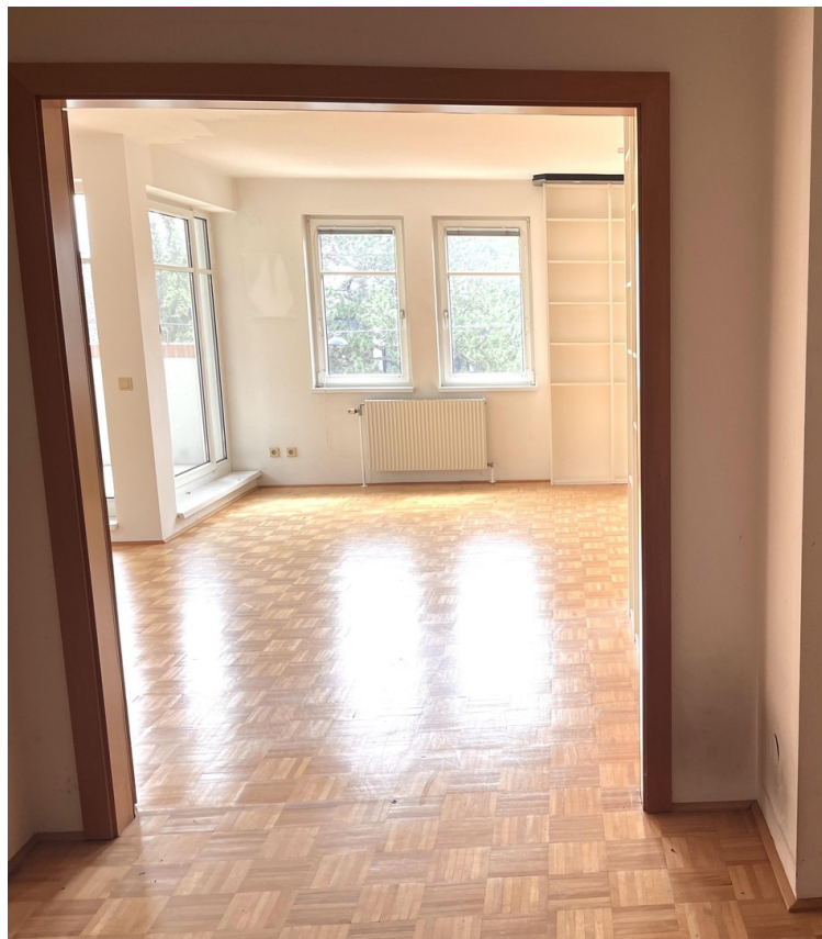
Salon / Flügeltüre