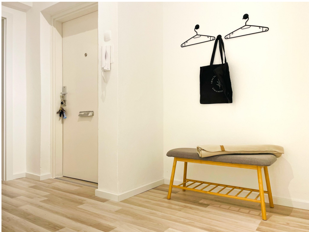
Flur / Garderobe