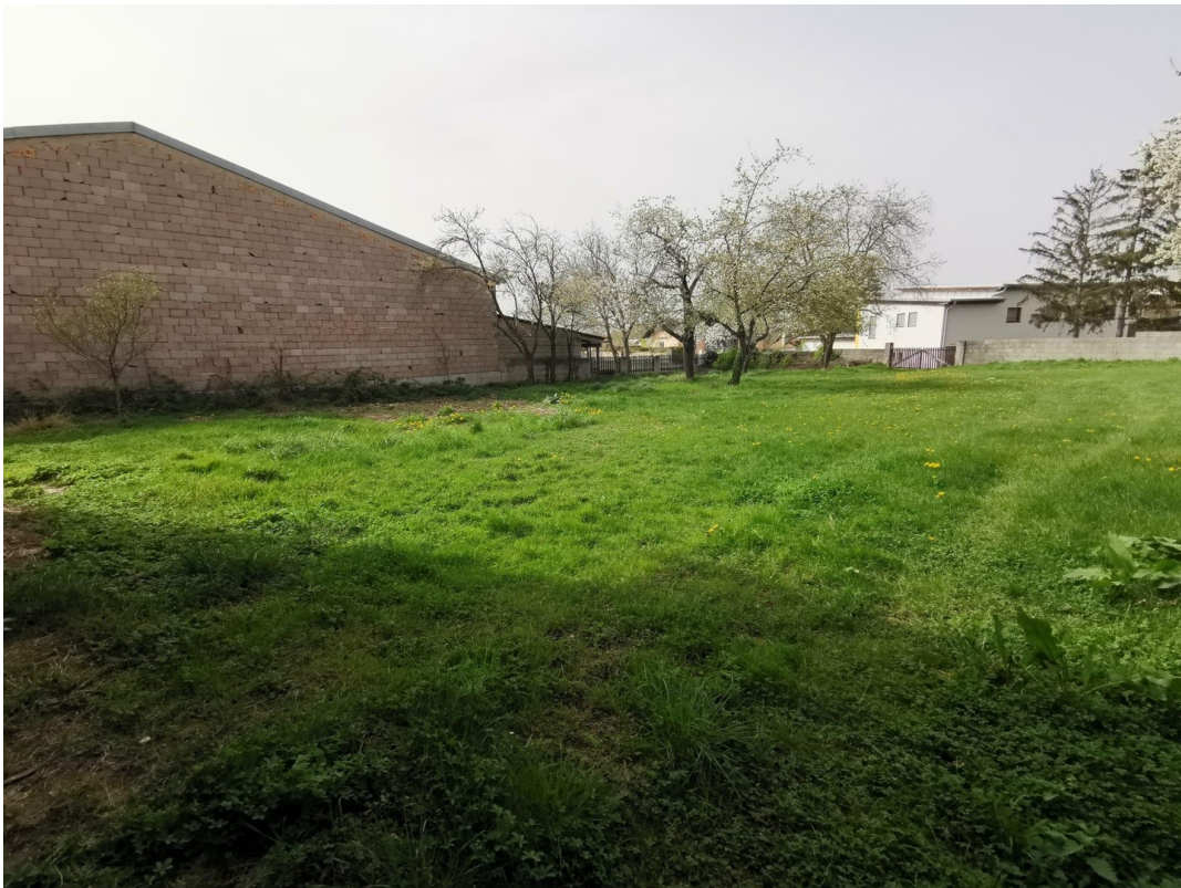
Garten mit Altbaumbestand