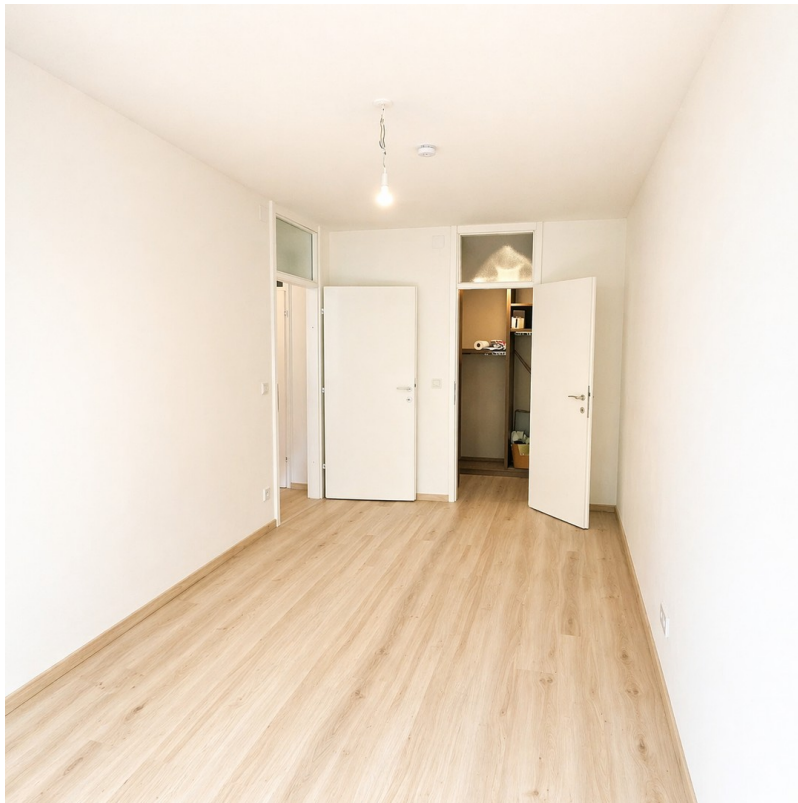
Großes Schlafzimmer + Ankleide