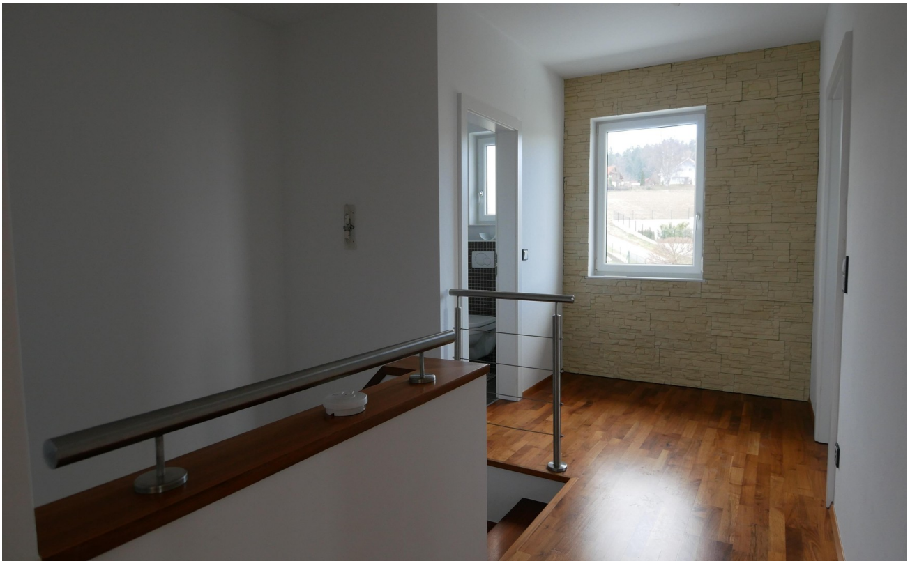
Vorraum 1. Stock