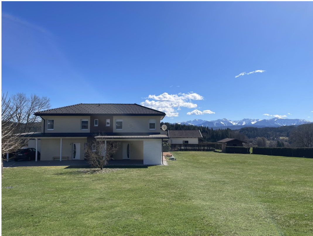
Blick nach Süden