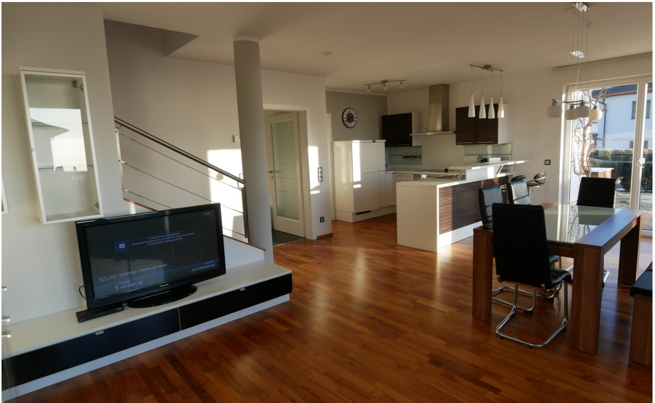
Blick zur Küche