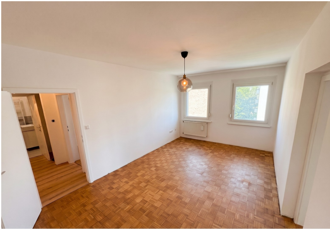
Wohnzimmer / Esszimmer