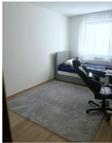
Elternschlafzimmer / unmöbliert und möbliert