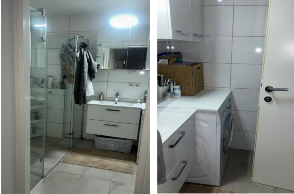
BAD mit WALK-IN Dusche