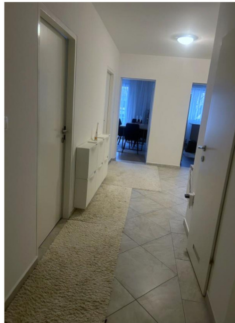
Eingangsbereich & Flur