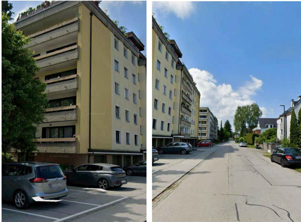
Hochparterre 1 OG Eckwohnung