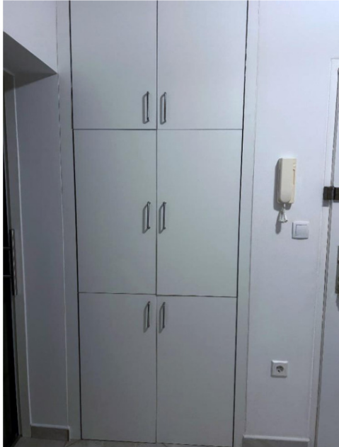
Nische mit Einbauschränk