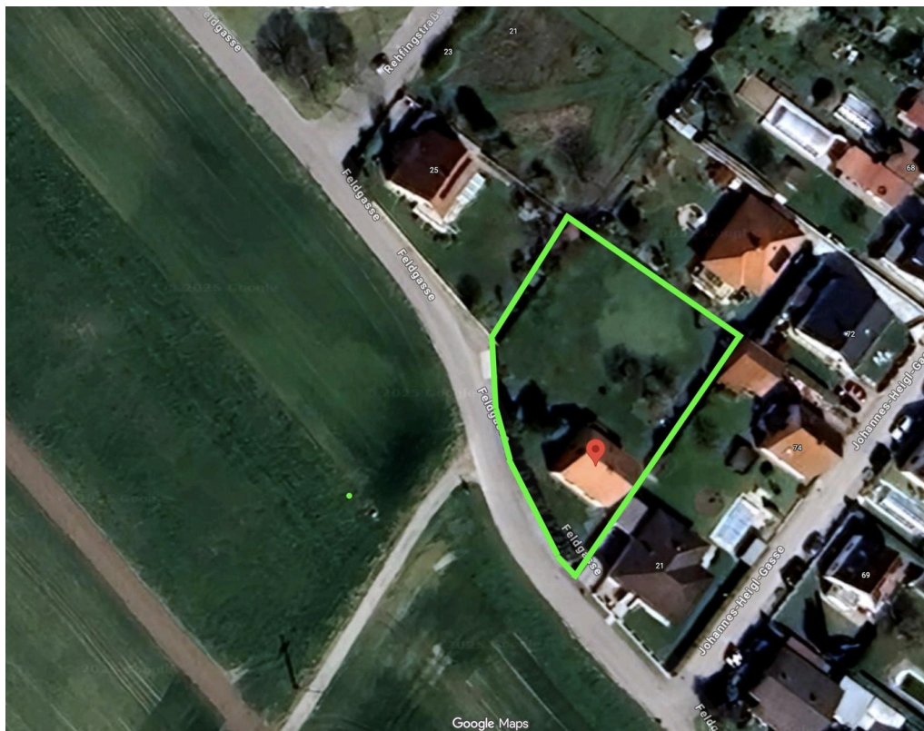
Lage & Grundstücksgrenzen