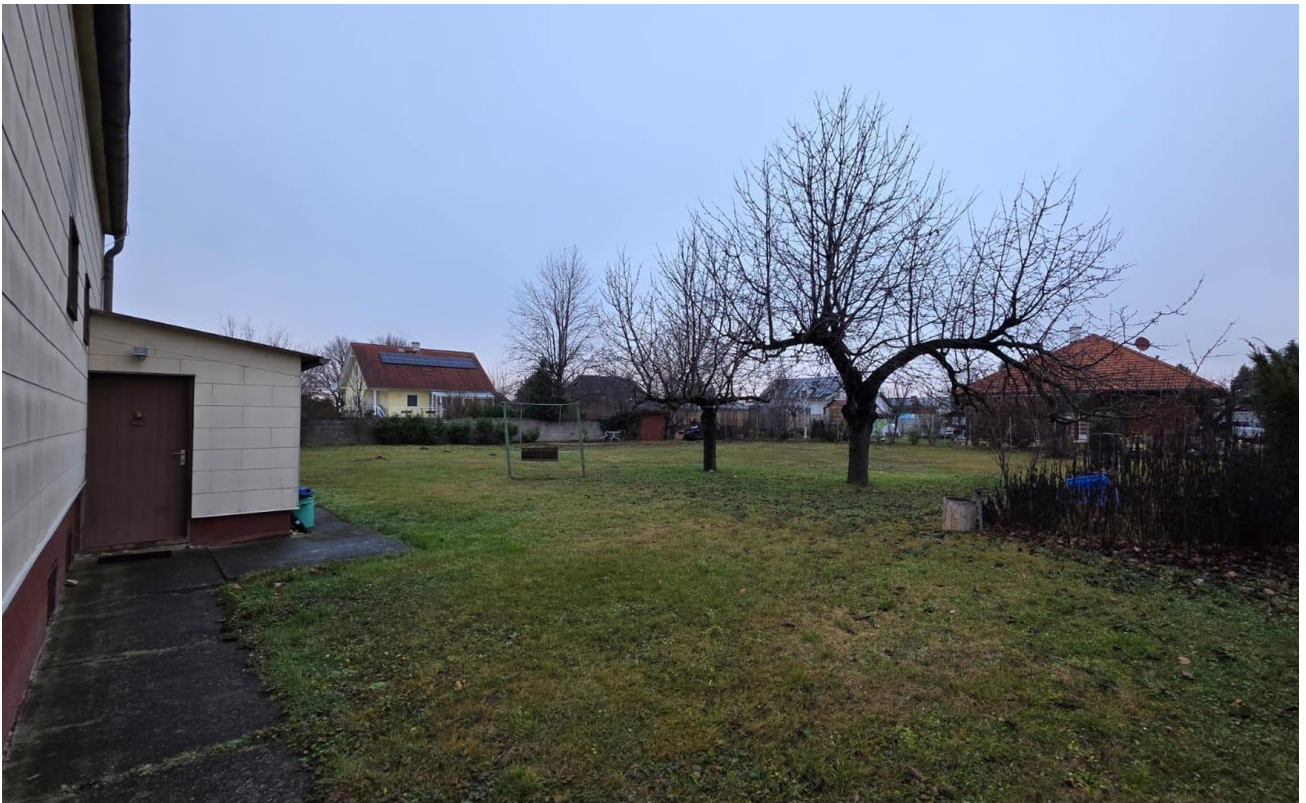
Ruhige Lage mit Weitblick