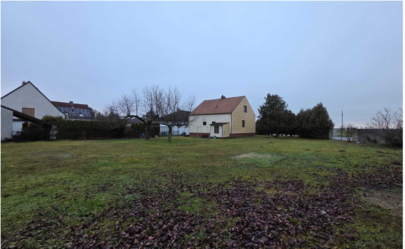
Grundstücksübersicht 1.465 m 2