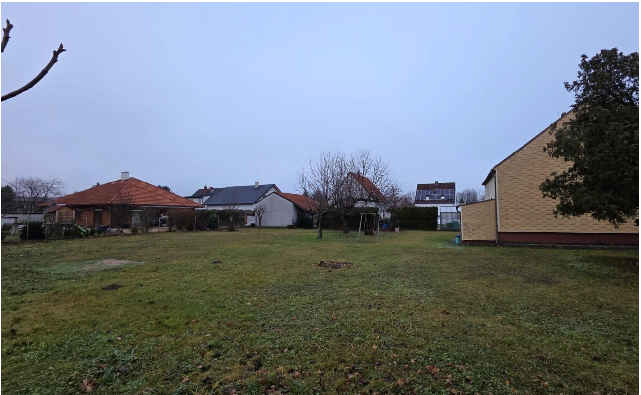
Haus auf großzügigem Grundstück