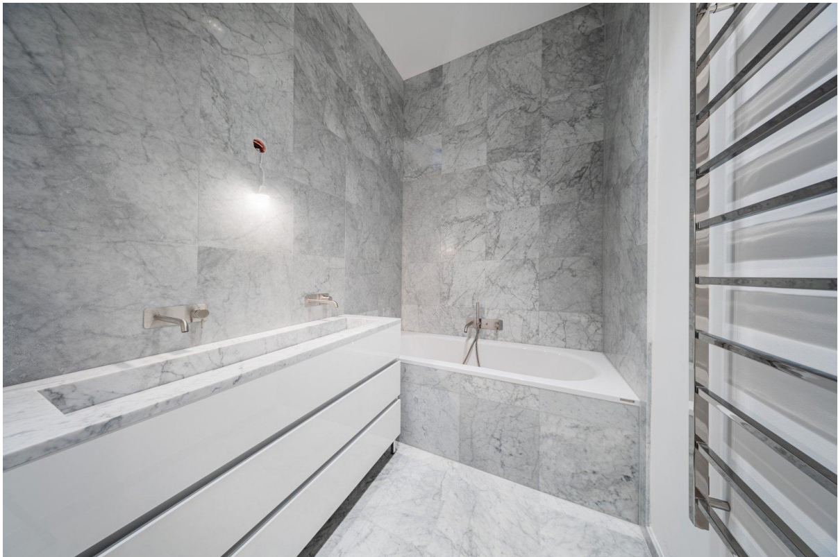
Badezimmer mit Badewanne