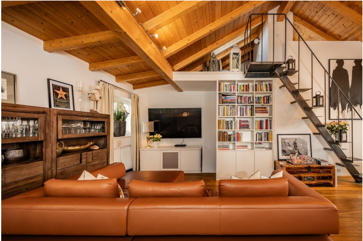
Wohnbereich mit Stahlterpe