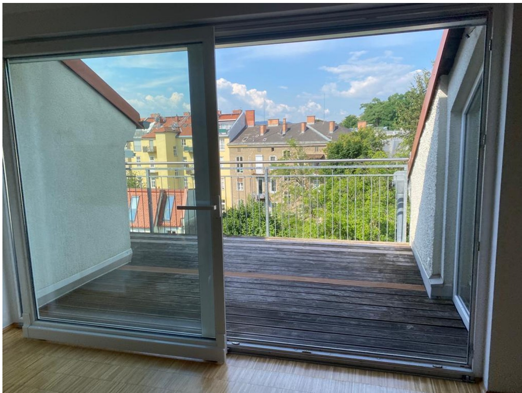
Terrasse / Balkon 10 m 2