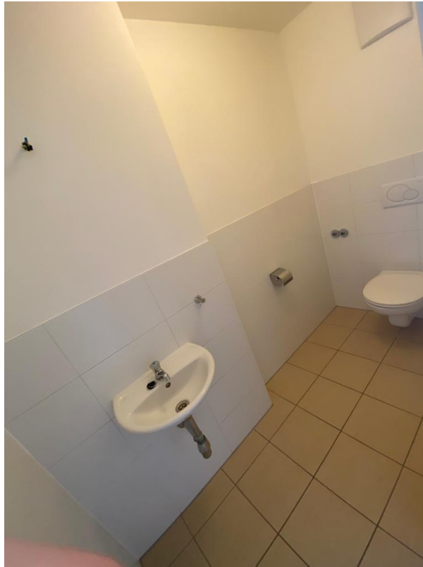
Toilette mit Waschbecken