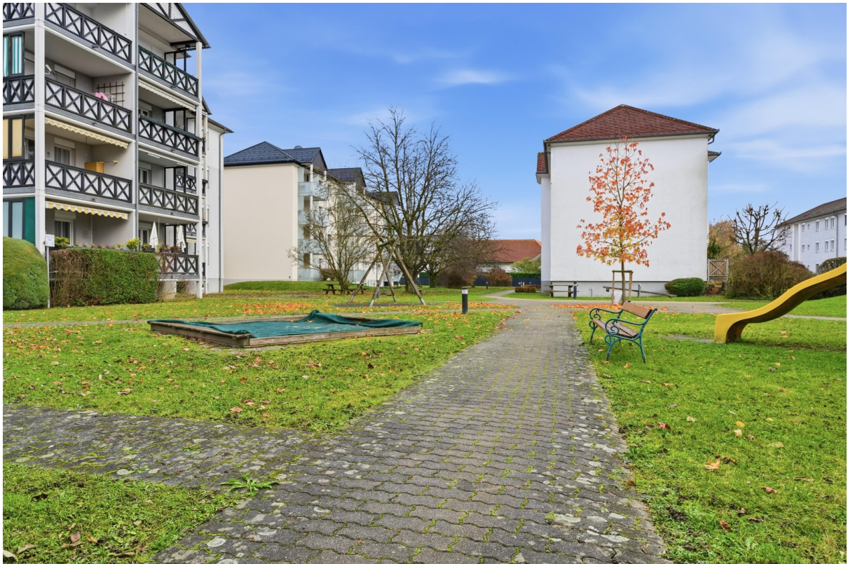
Innenhof mit viel Grün