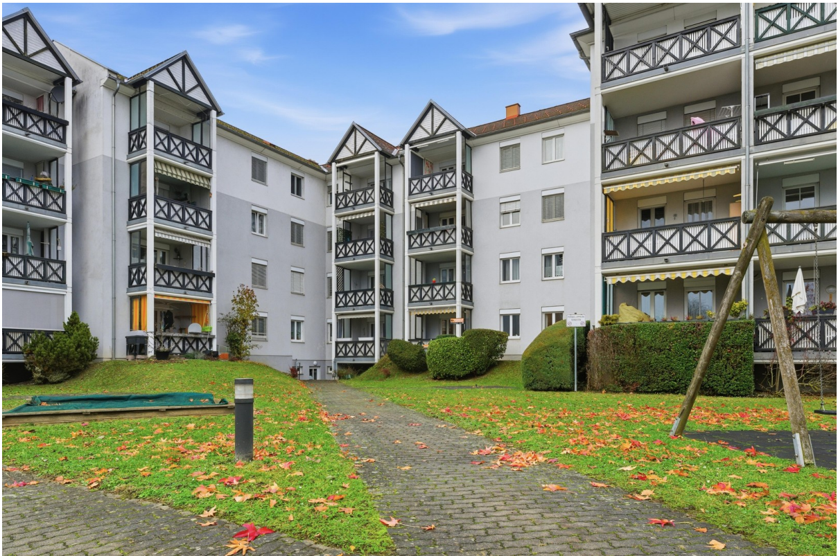
Innenhof mit viel Grün