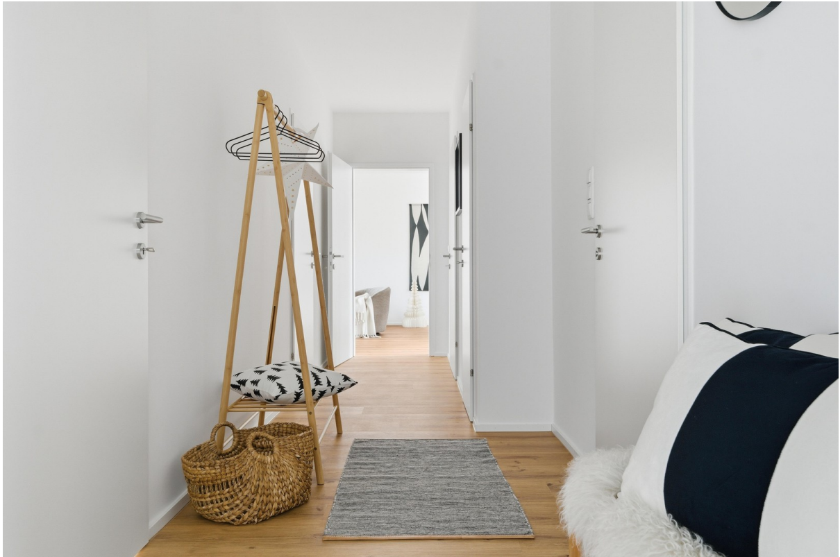
Vorraum mit Garderobe