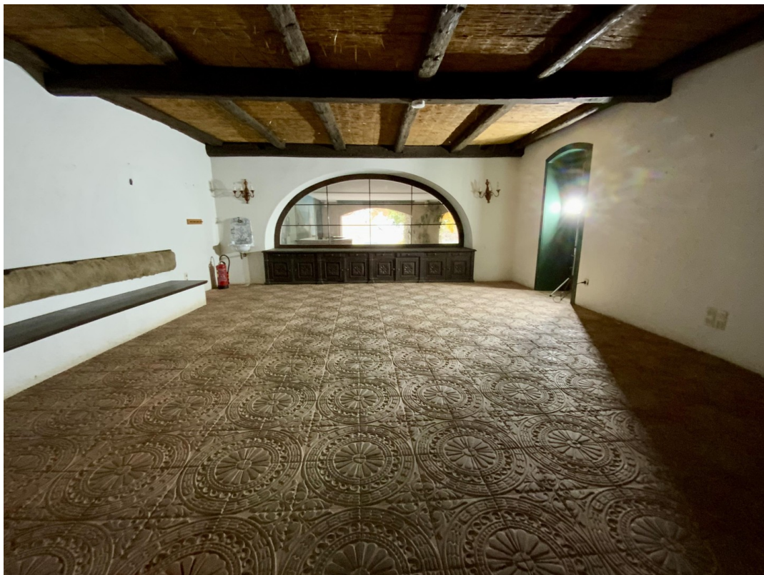
Esszimmer mit Poolblick