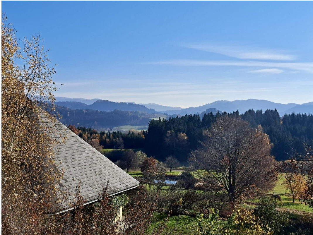
Blick von der 'Alm'