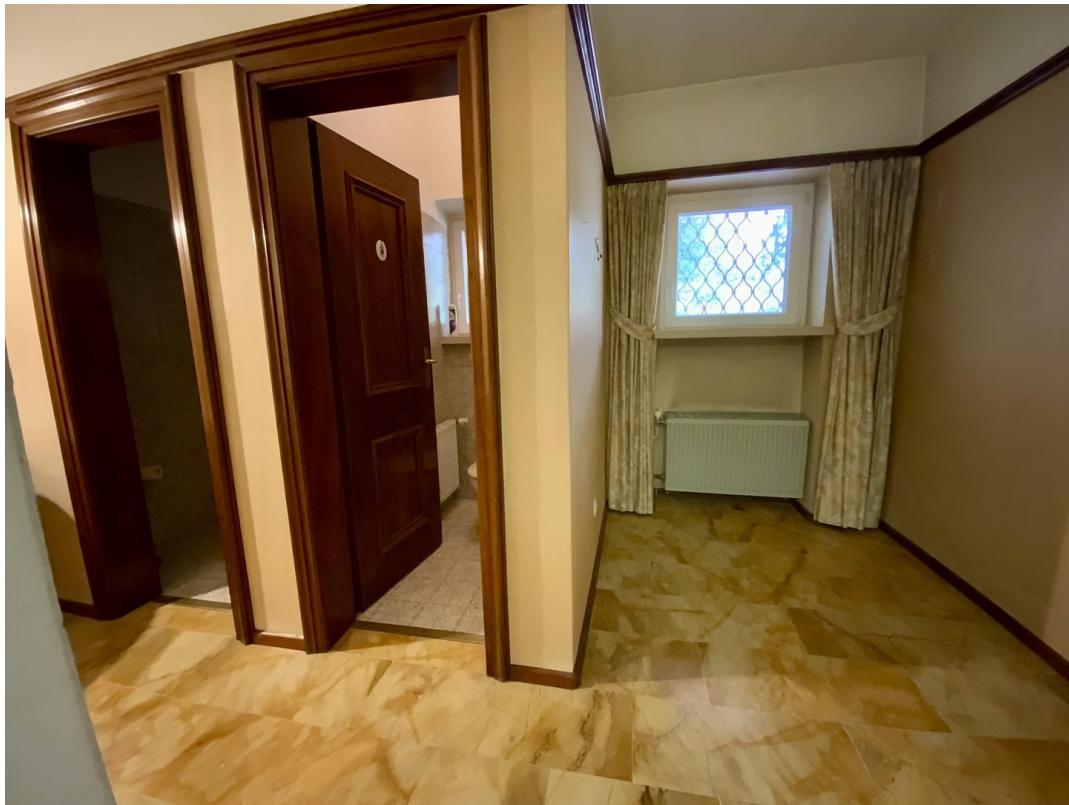
Gäste WC und Garderobe