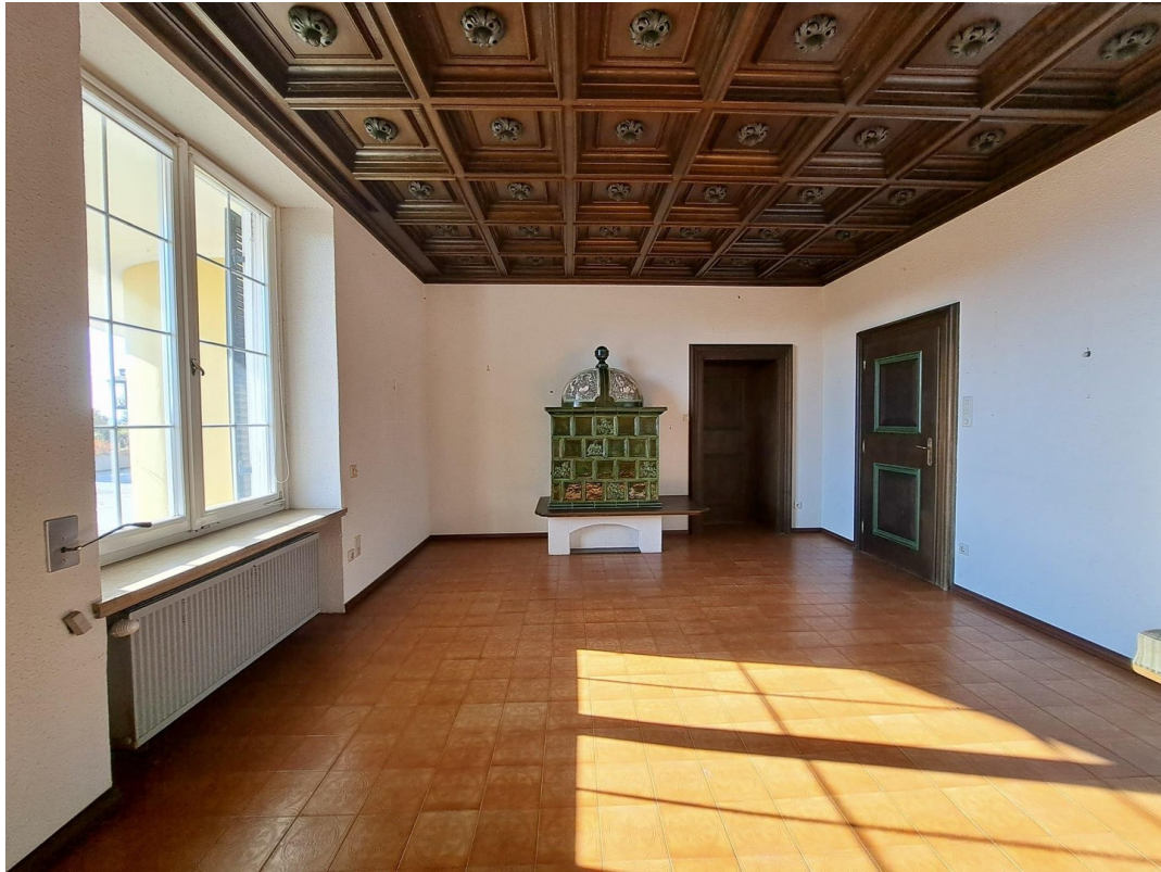
Esszimmer mit Kamin