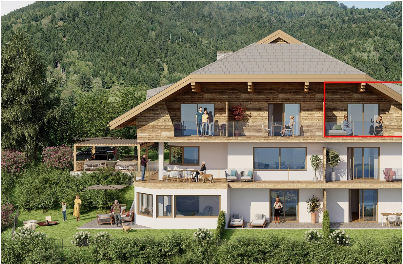
Lage im see-landhaus