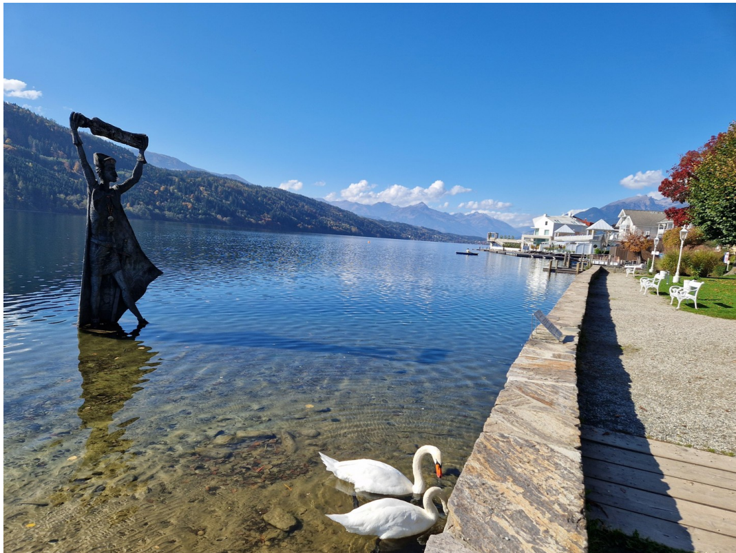
Schwäne in Millstatt