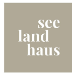
DACHGESCHOSS Top 6, Top 7, Top 8