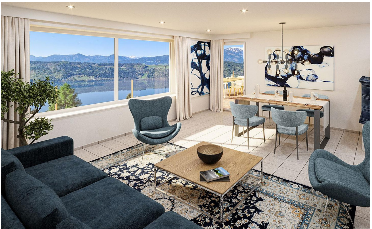
Hell, modern mit Blick!