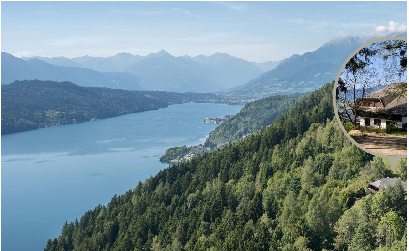
Lage am See Luftaufnahme