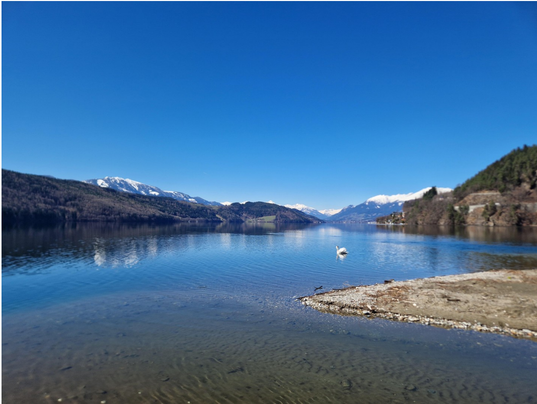
See vom Ostufer aus