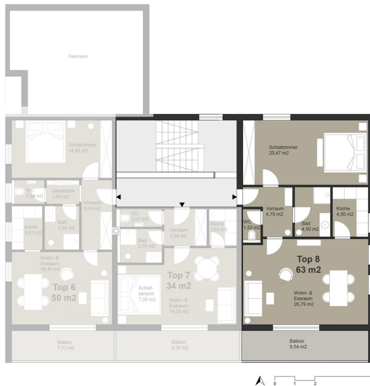
DG Grundriss TOP 8