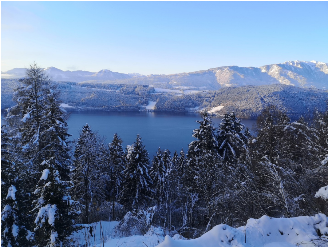
Aussicht im Winter