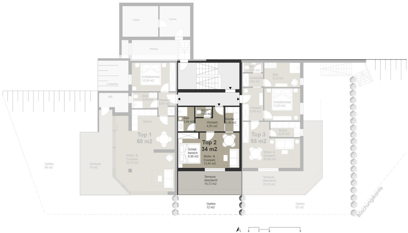
EG Grundriss TOP 2