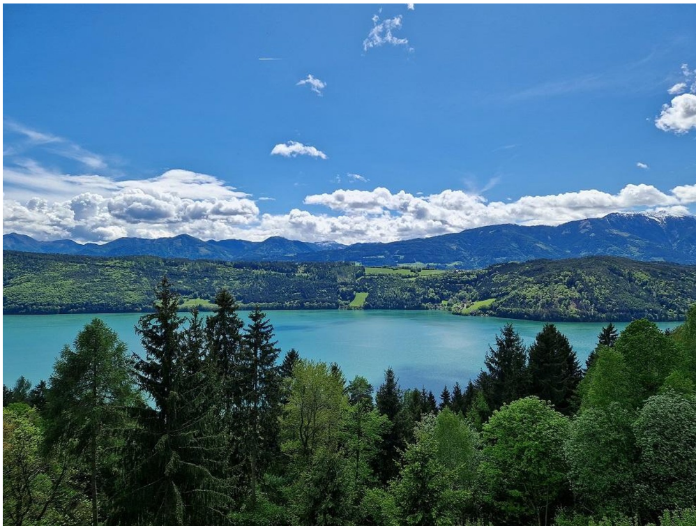
Seefarbe nach einem Regen