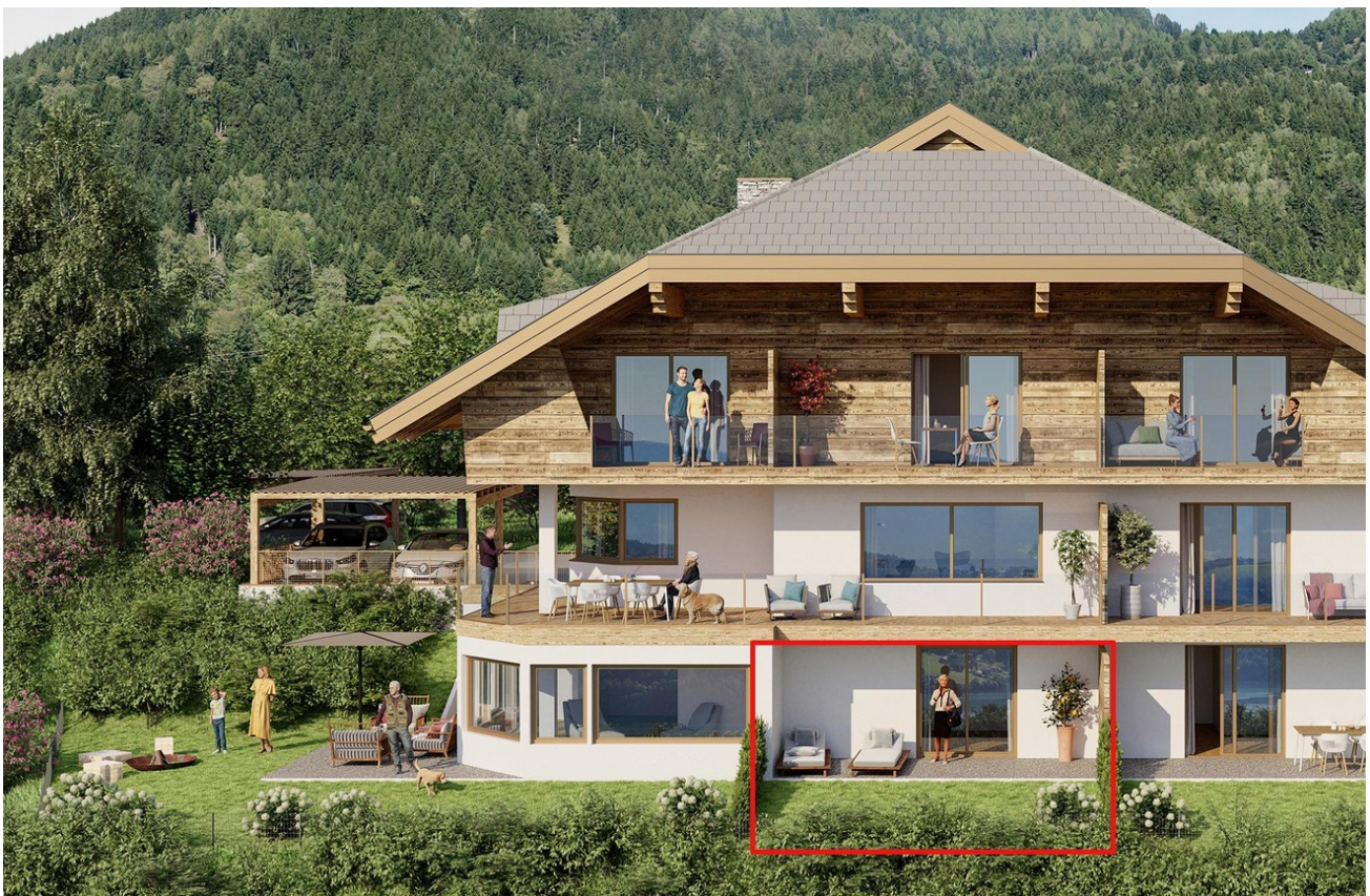
Lage im see-landhaus