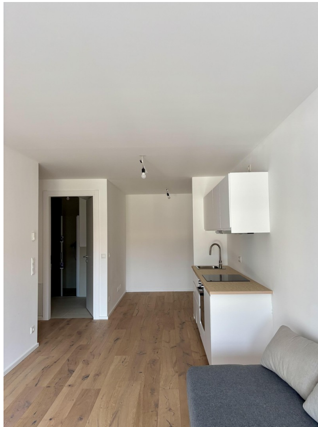
Trennbereich / Küche