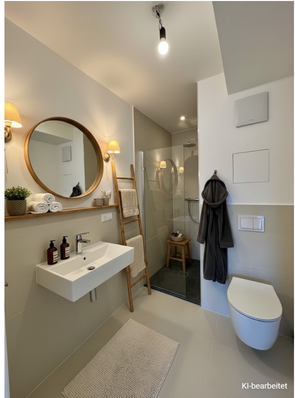
Badezimmer - KI generiert