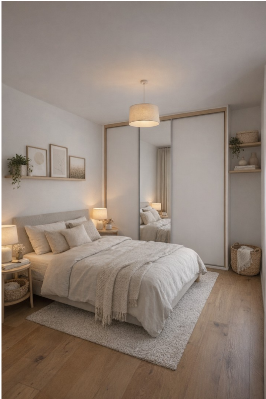
Schlafnische - KI generiert