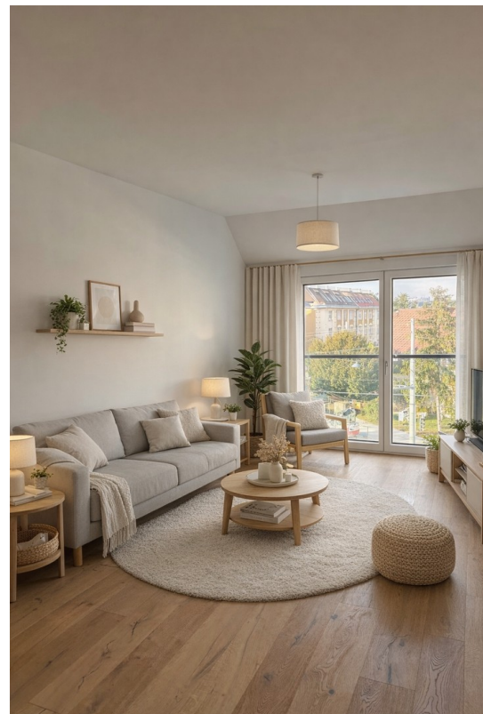
Wohnbereich - KI generiert