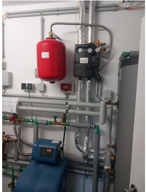
BWT Anlage & Solar