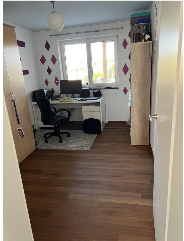
Büro / Kinderzimmer