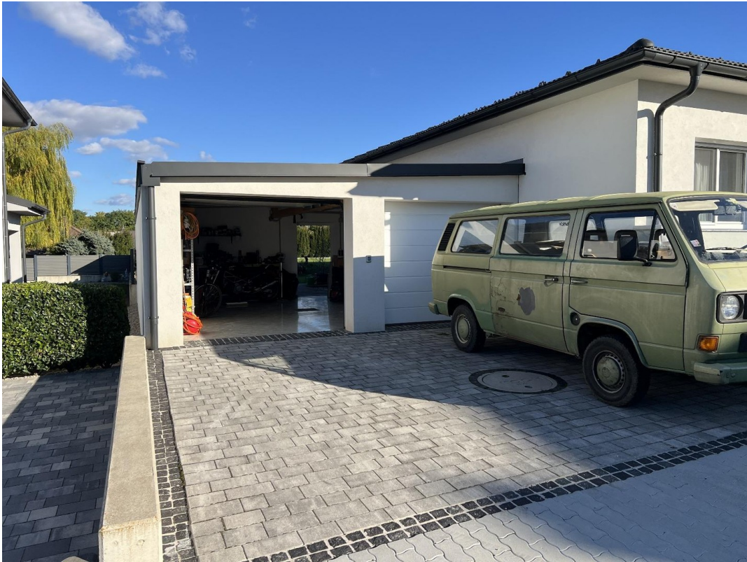
Vorplatz und Garage