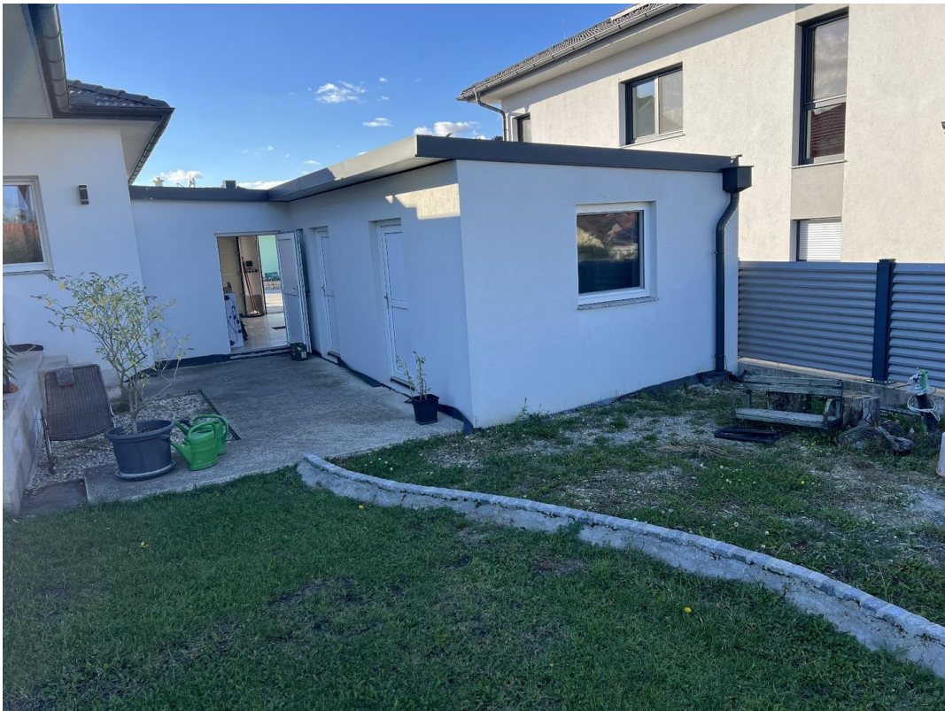
Nebengebäude hinter Garage