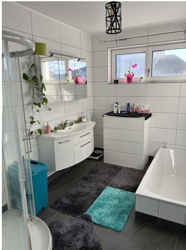
Blick ins Bad