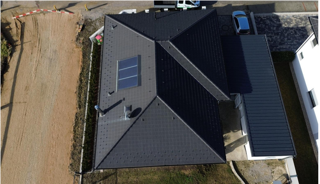
Guckst Du von oben