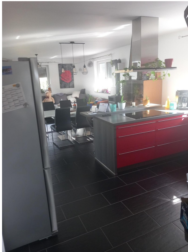
Küche Blick Ess/Wohnbereich